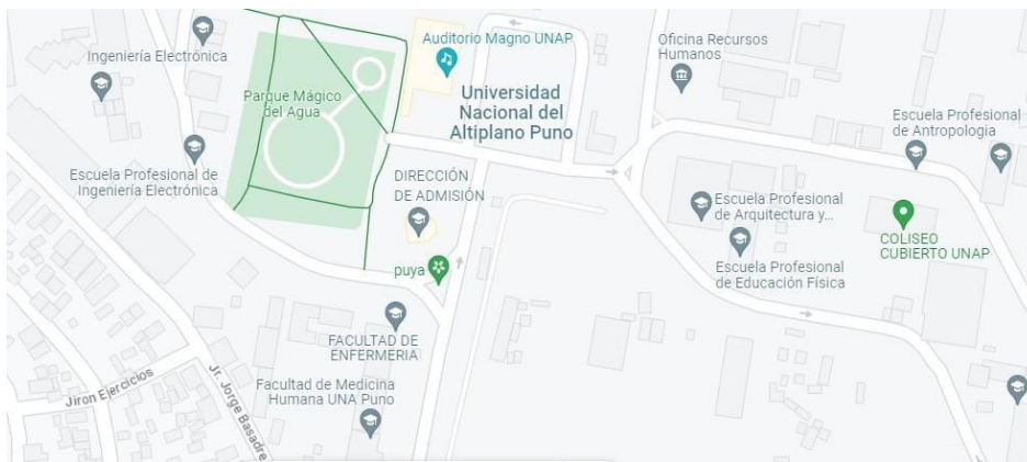
Figura 1. Ubicación de la Universidad Nacional del Altiplano Facultad de Enfermería (42).

Se realizó en la Facultad de Enfermería de la Universidad Nacional del Altiplano, que se encuentra en la ciudad de Puno la misma que se encuentra a 3825 metros de altitud sobre el nivel del mar, en Perú (41).