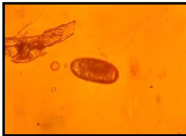
Huevo de Lamanema spp.