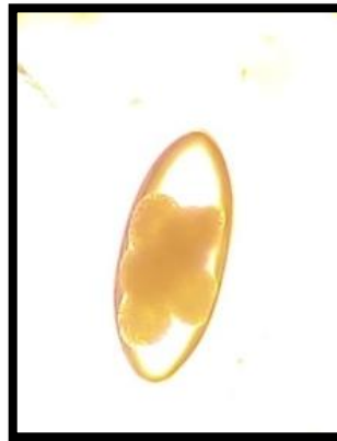
Huevo de Nematodirus spatiger