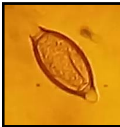
Huevo de Trichuris sp.