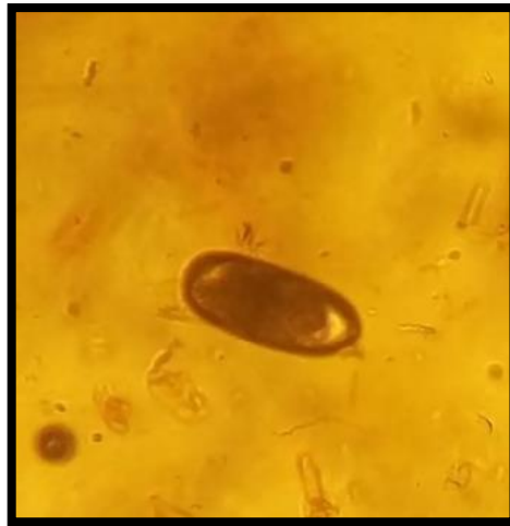
Huevo de Nematodirus lamae