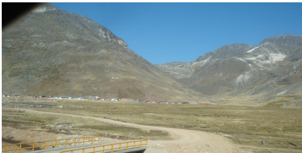
Figura 4. Carretera de acceso a Chacaconiza