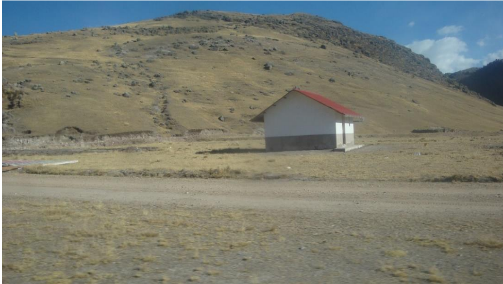
Figura 12. Vivienda construidos por el Tambo

Fuente: Fotografía registrada en junio del 2018