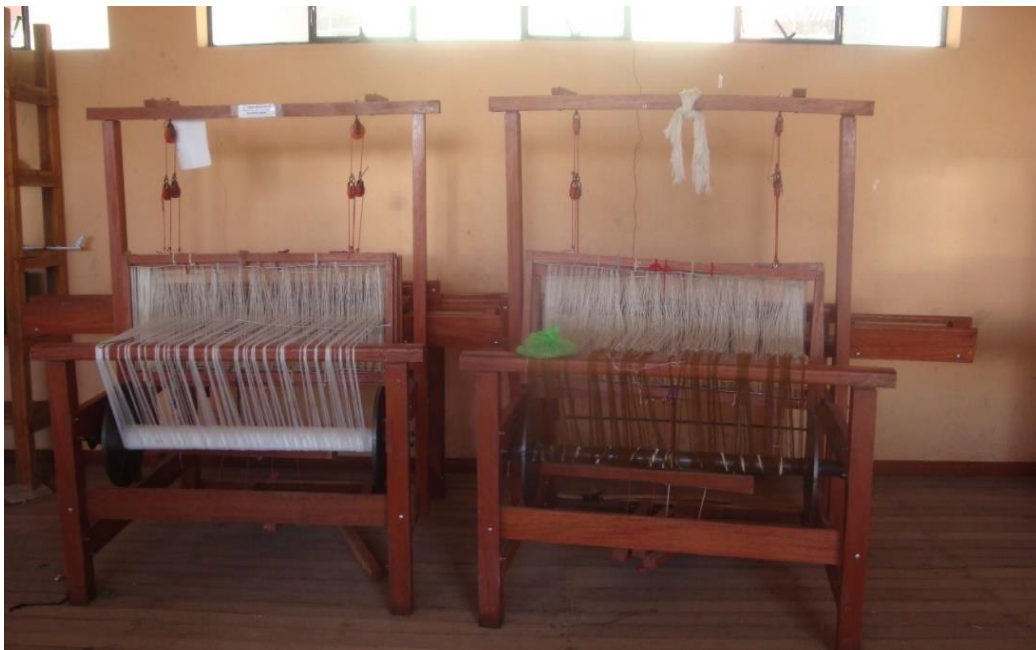
Figura 11. Telares a pedal implementados por la empresa