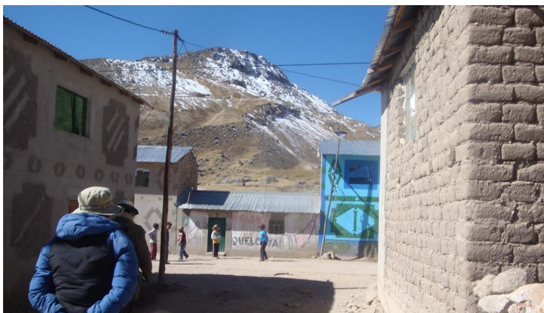
Figura 5. Viviendas de la Comunidad Chacaconiza

La mayoría de las viviendas son rústicas (hechas de adobe y piedra) con techos de paja y calamina. Cada familia, por lo general tiene tres habitaciones, una para la cocina, para el dormitorio y otro para almacenar sus alimentos y algunas cosas.