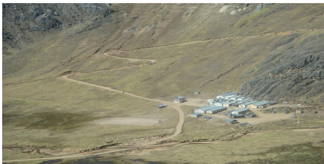
Figura 7. Campamento de Bear Creek Company sucursal del Perú