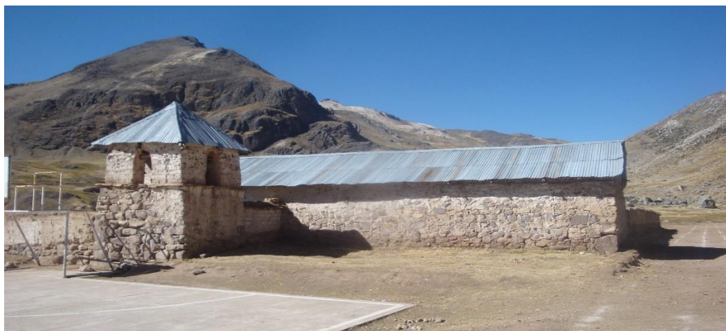
Figura 6. Capilla de la comunidad Chacaconiza