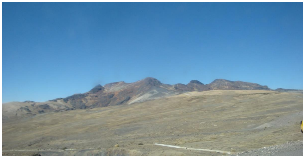
Figura 2. Topografía de la zona