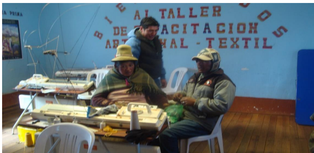
Figura 9. Actividad artesanal en la comunidad

posibilidad de tener vías de acceso y que estas sean mejoradas para casos de emergencia, como de trasladar a un enfermo al hospital provincial por eso yo pienso que la minería es bueno, además, a las mujeres les capacita en artesanía”.