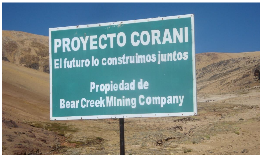
Figura 8. Propiedad de Proyecto Corani

Fuente: Fotografía registrada en julio del 2018.