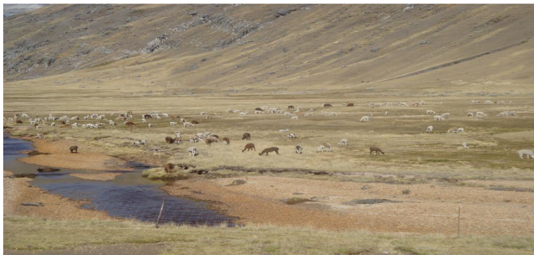
Figura 3. Crianza de alpaca y llamas

La ganadería es una de sus actividades principales de la comunidad; cada familia tiene aproximadamente 200 a 300 cabezas de ganado tanto alpaca como llama. Su crianza está dada con la finalidad de procrearlos para después ponerlo en el mercado; asimismo, constituye la ganadería la actividad económica del poblador.