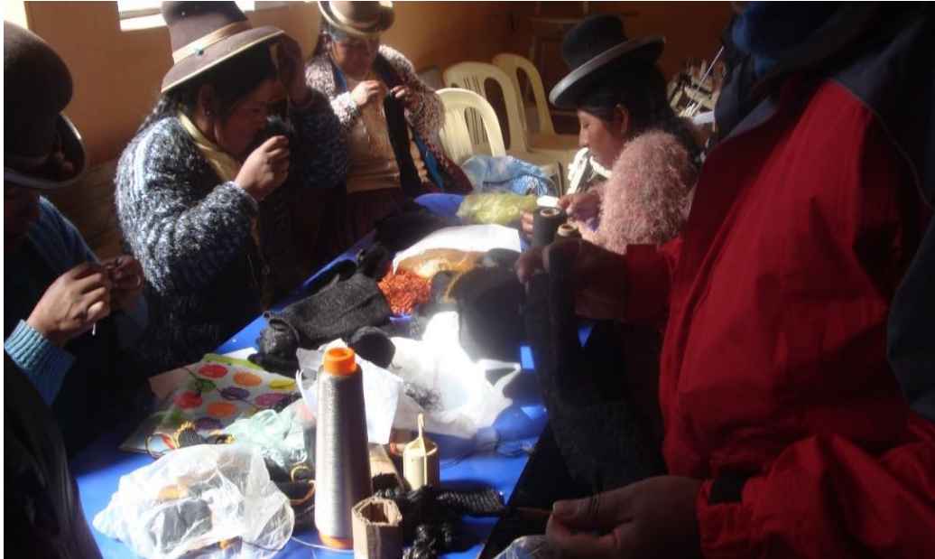
Figura 10. Las mujeres en la artesanía