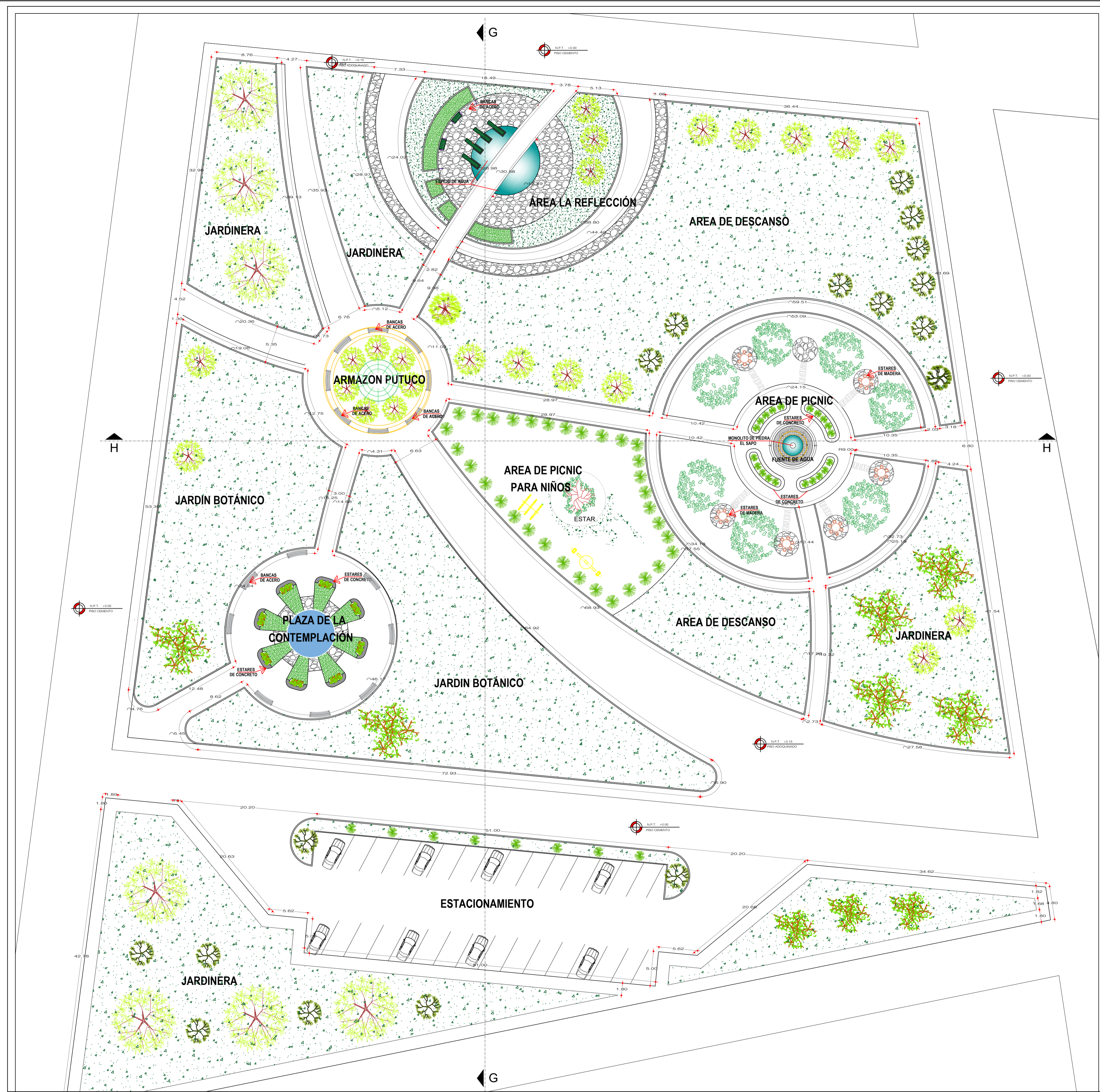
PLANO DE PLANTA - PARQUE RECREATIVO ARQUITECTURA ESC 1/300