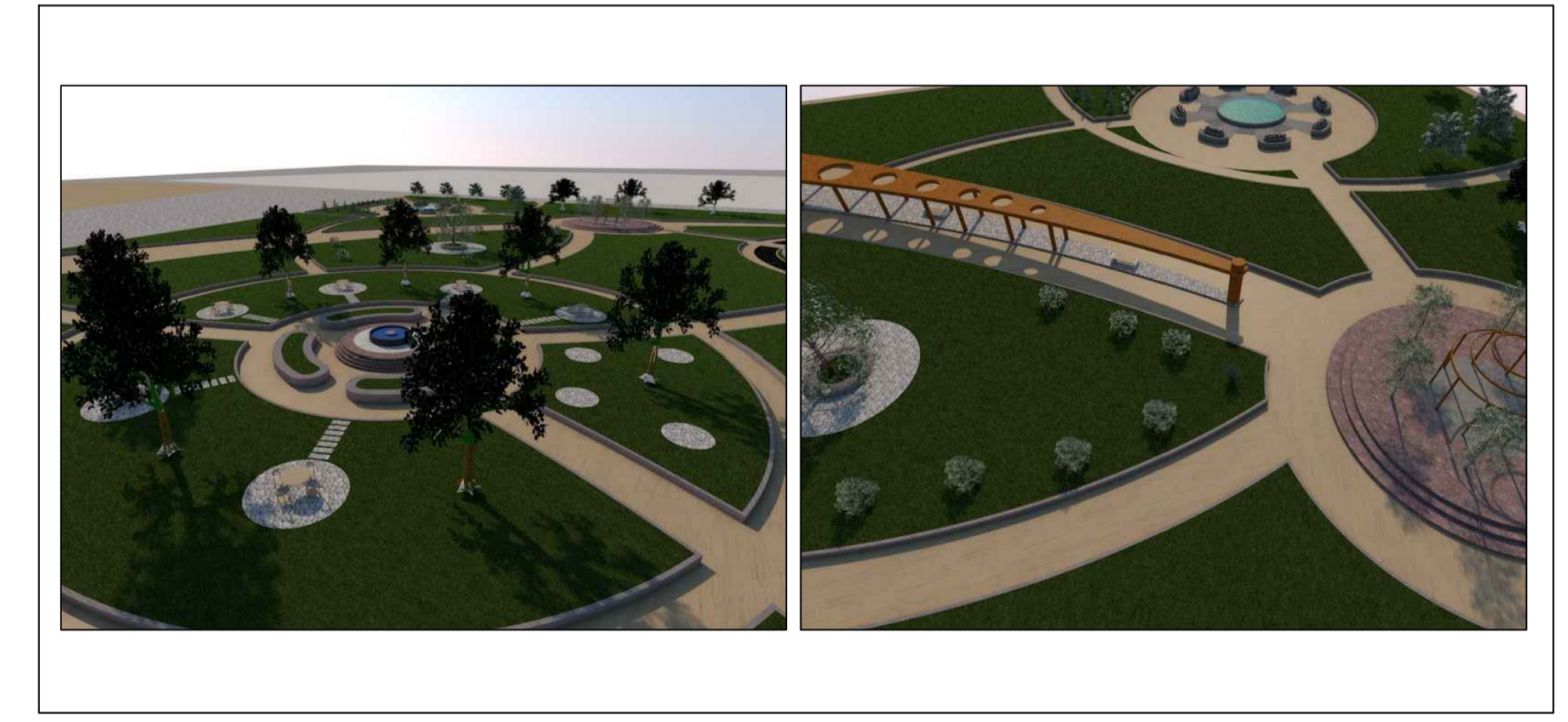
MODEL 3D ARQUITECTURA