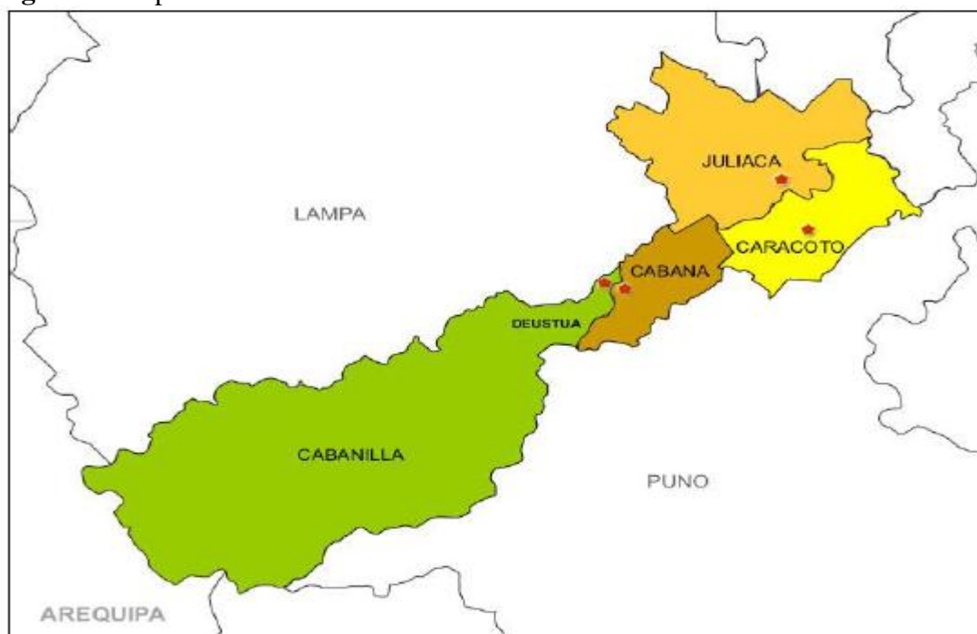
Figura 1: Mapa del Distrito de Juliaca