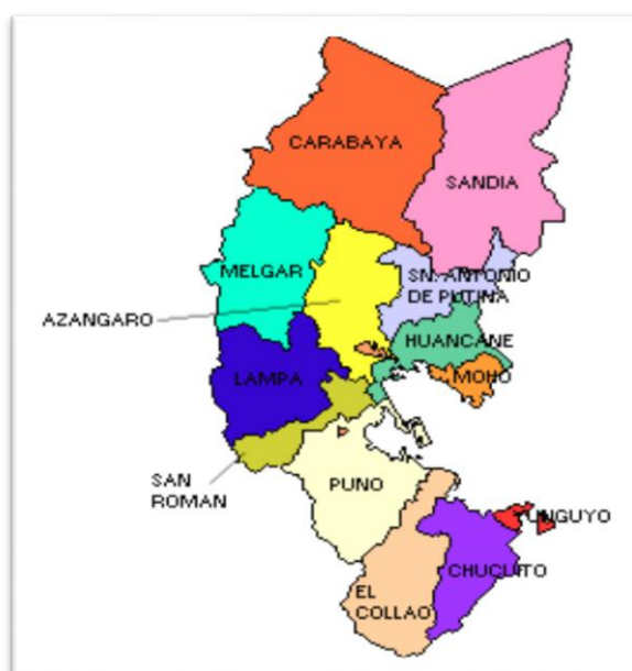
Mapa del Departamento de Puno

https://www.google.com.pe/search?q=mapa+de+puno