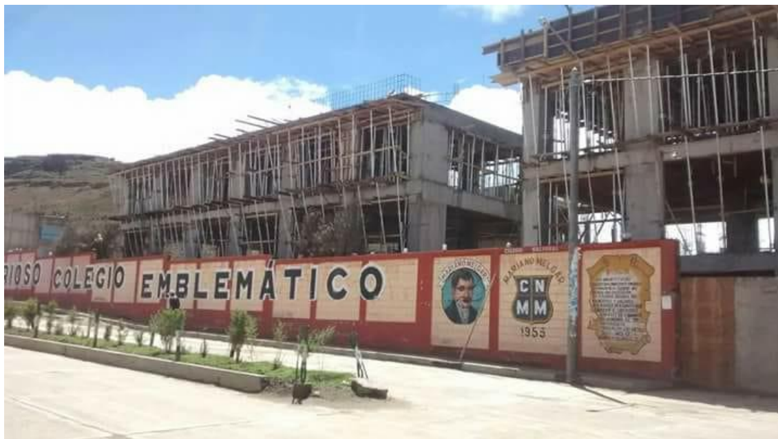
Fotografía 1. Puerta principal de la Institución Educativa Secundaria Glorioso San Antón (toma 1).