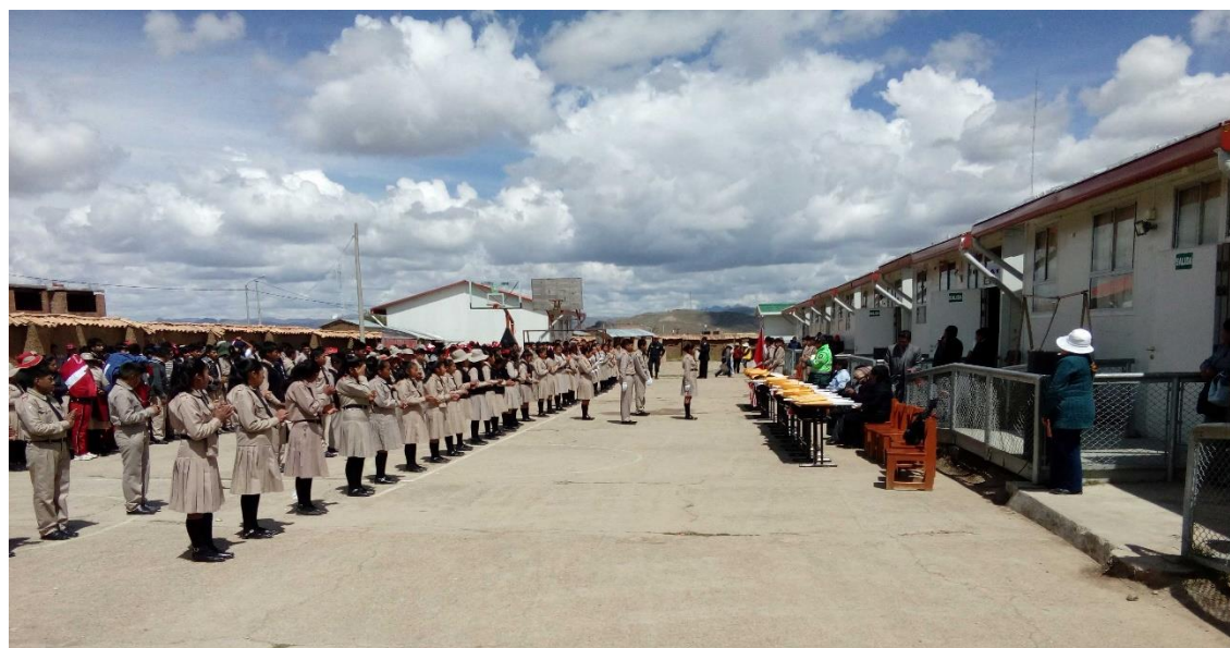
Fotografía 2. Estudiantes realizando actividades del colegio Glorioso Mariano Melgar (Toma 2).