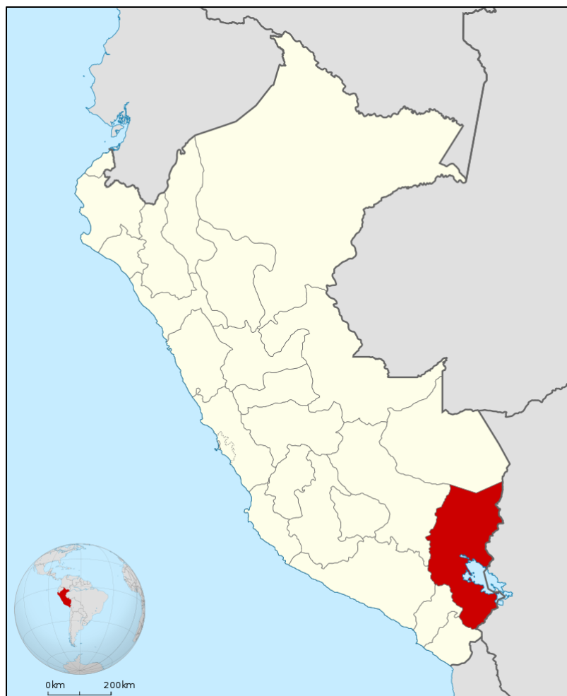
Figura 1. Ubicación de la región de Puno en el Perú