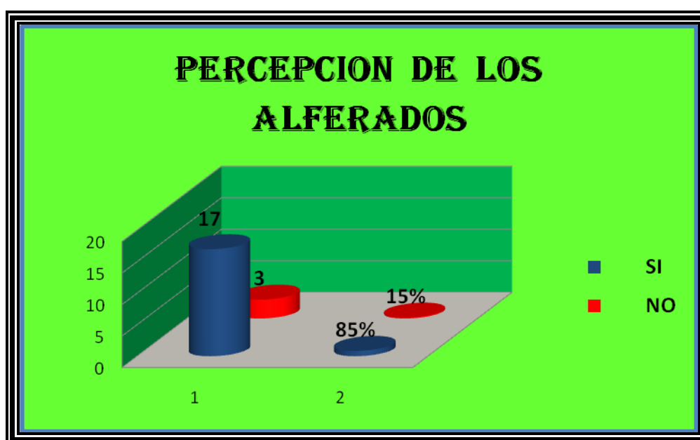
Figura 19. Le Gustaría ser Alferado de la Fiesta de la Virgen Inmaculada Concepción

Al 85 % de la población entrevistada de San Juan de Salinas le gustaría ser alferado, ya que para ellos es una muestra de devoción a la Virgen y de alguna manera motivar su agradecimiento. Además al pasar el cargo de alferados es una forma de predecir su bienestar, no solo económico sino también tendrán una buena salud para ellos y para su familia. Pero al 15 % no le gustaría ser alferados, porque esto demanda un gasto, y no cree tanto en las bendiciones de la Virgen.