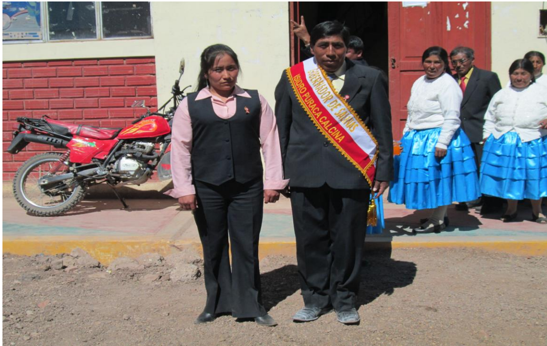
Figura 27. Gobernador del distrito.