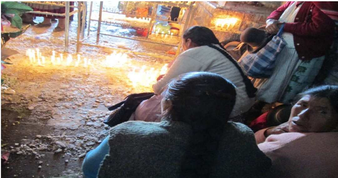
Figura 11. En la fotografía se observa el significado de las velas.