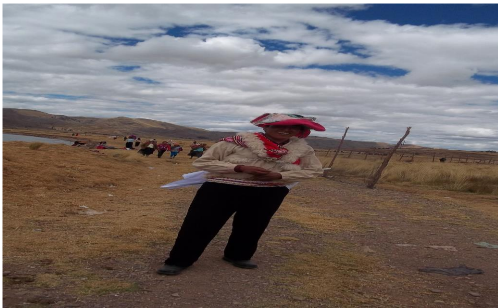
Figura 12. En la fotografía se observa la vestimenta de la danza Wifalas.

Los varones, visten: monteras multicolores, camisa y pantalón de montar de bayeta color blanco o negro. En la espalda lleva una lliklla de P'HITAY en donde contiene serpentinas, talcos y mixturas. En la mano portan un látigo trenzado de lana de llama o alpaca con adornos de rozones multicolores y en la punta trenzan de la cerda de la cola del caballo para que cuando se desafían, hacen reventar el piso produciendo un sonido de cohete con el látigo que se denomina Warak'a. Los jañachus (hombres) y las manzanas (mujeres) descalzos se adornan con abundante serpentina en el cuello y las mejillas están pintadas con talco y polvos aromáticos.