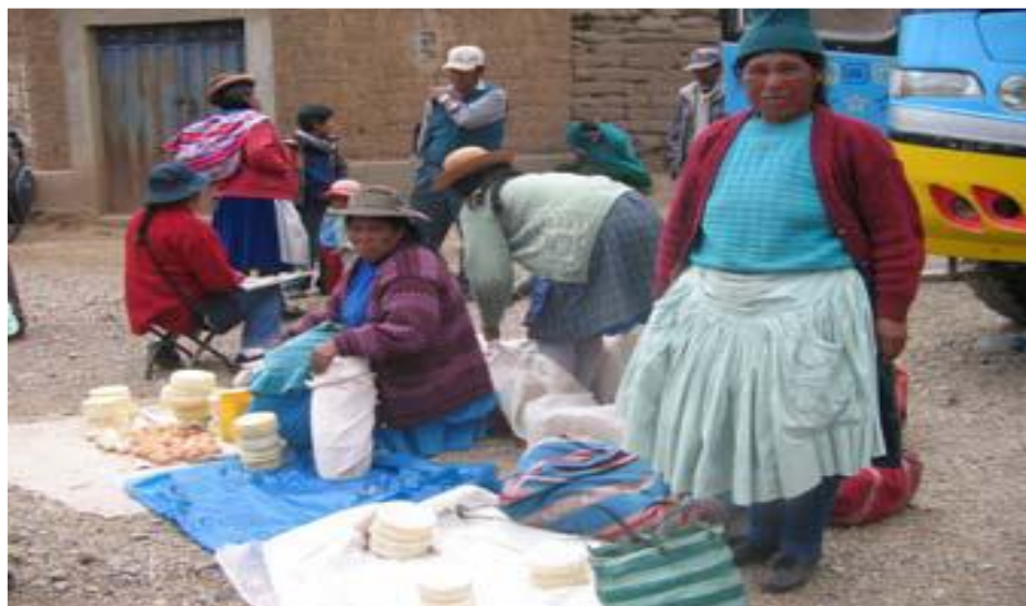
Figura 5. En la fotografía se observa la venta de quesos.

De la misma manera se realiza la venta de vacunos, cabe mencionar que en la actividad de la crianza de vacunos, lo que más llevan para vender son los toros. Es considerada como la actividad principal fuente de ingresos económico, para poder abastecer los gastos de la familia tanto en la educación, la salud de sus hijos y entre otras necesidades básicas.