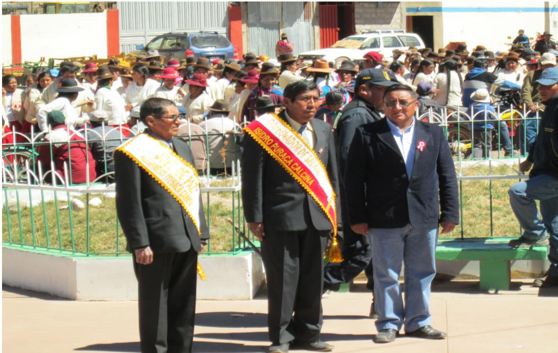
Figura 25. Autoridades de la municipalidad San Juan de Salinas.