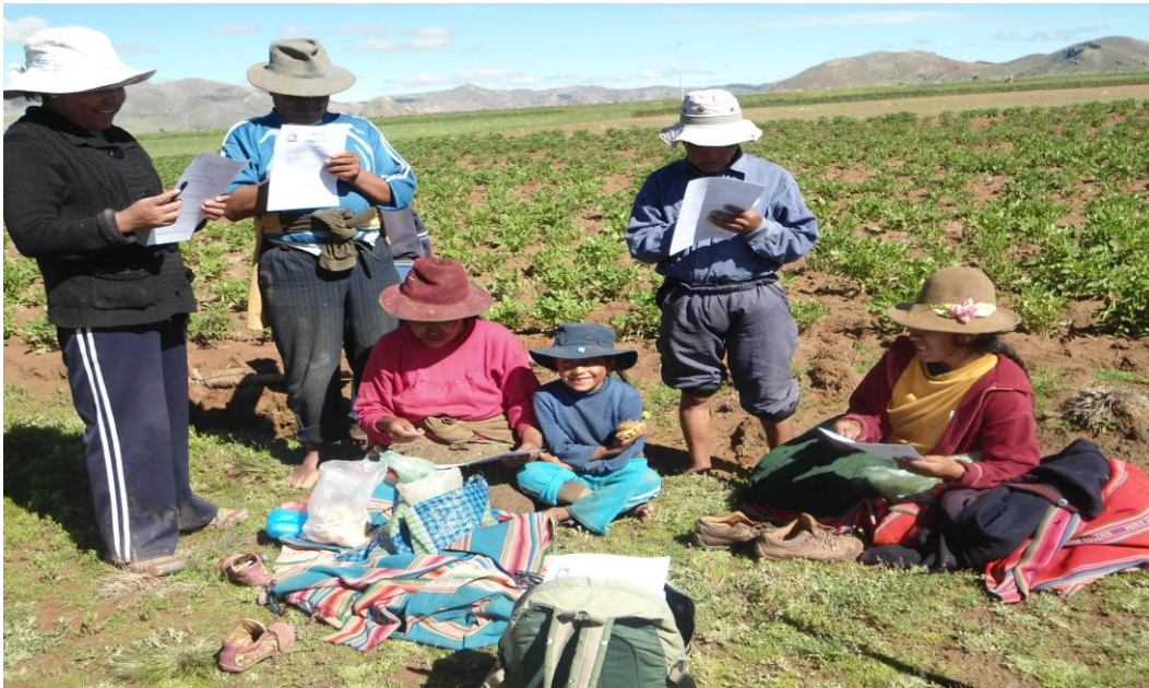
Figura 2. En la fotografía se observa a los pobladores.