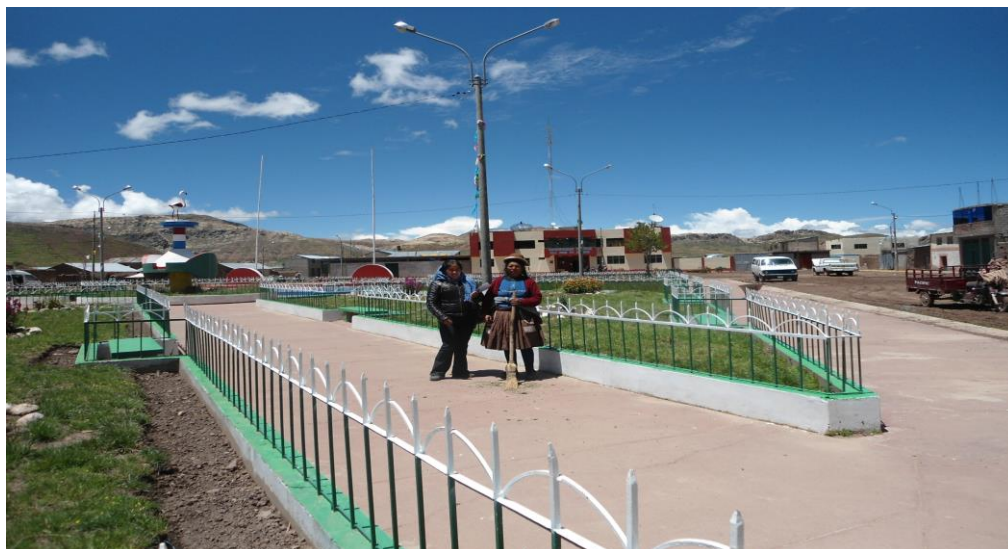
Figura 10. En la fotografía se observa la plaza del distrito de San Juan de Salinas.