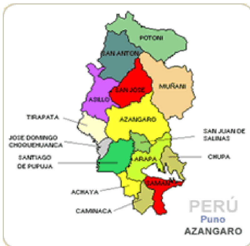
Figura 1. Mapa de Azángaro.

El presente tesis de investigación se ejecutara en el mismo Distrito de San Juan de Salinas, que está ubicado en el centro de la provincia de Azángaro, en la zona norte de la región Puno y en la parte sur del Territorio peruano. También está integrado por su Ciudad Capital, Comunidades Campesinas y además por Caseríos, Anexos.