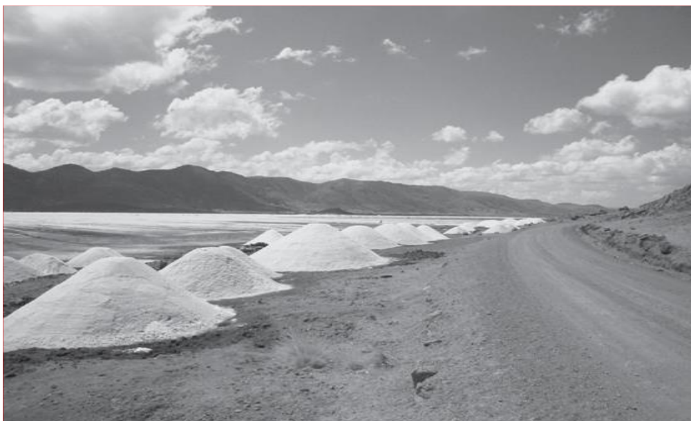
Figura 7. En la fotografía se observa extracción de la sal.

La comercialización de dicho producto es todo los años, el precio es variado de 10 a 15 nuevos soles el saco de 50 kilos, que es embolsado en el mismo lugar. En la época de escases la sal es donde el precio se duplica y posteriormente son trasladados en camión procedente a la ciudad de Azángaro, Juliaca y entre otras ciudades.