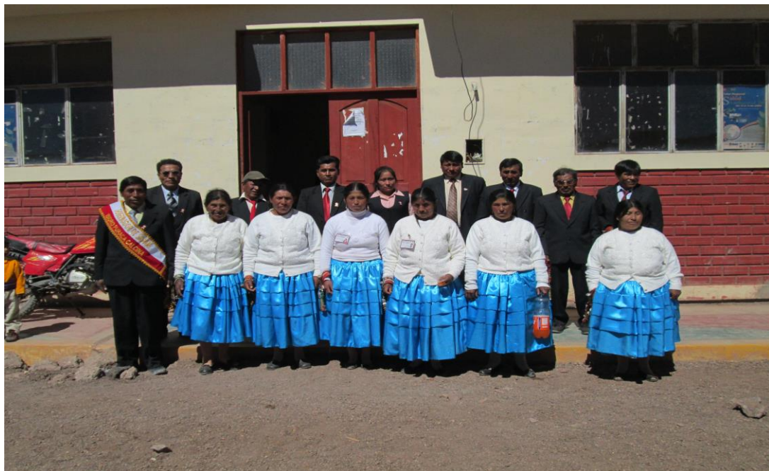
Figura 26. Los señores tenientes, señoras tenientinas del Distrito.