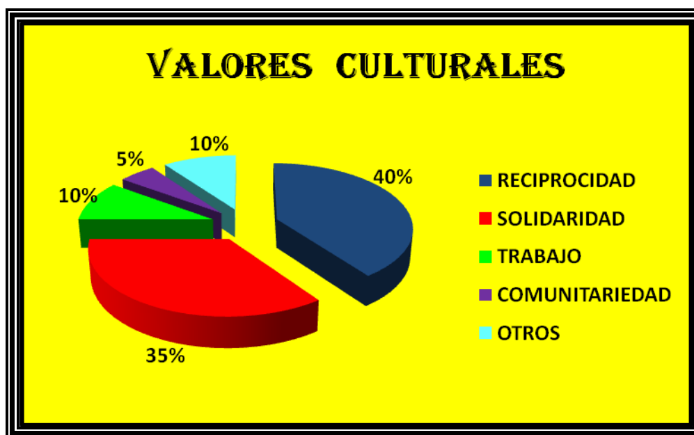
Figura 21. Los Valores Culturales con Mayor Intensidad en la Festividad de la Virgen Inmaculada Concepción