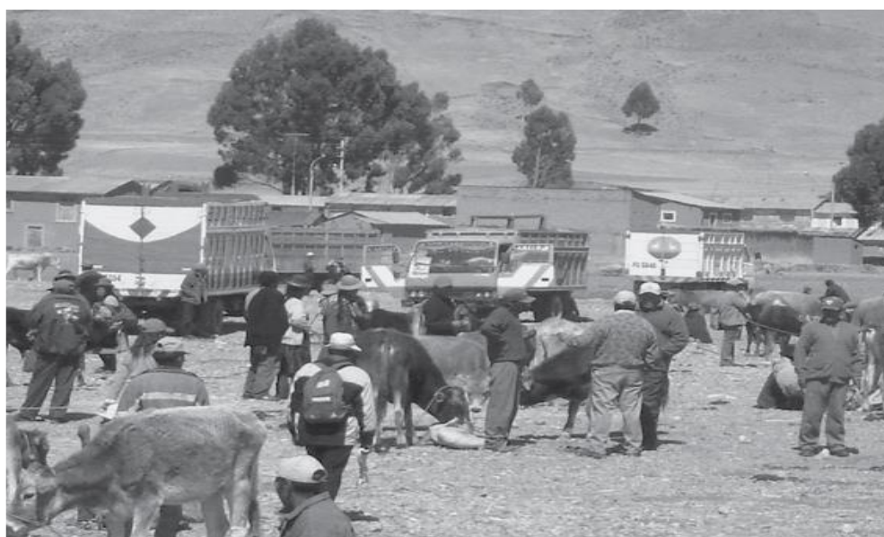
Figura 6. En la fotografía se observar la venta de vacunos en la feria.

De la misma manera se realiza la venta de vacunos, cabe mencionar que en la actividad de la crianza de vacunos, lo que más llevan para vender son los toros. Es considerada como la actividad principal fuente de ingresos económico, para poder abastecer los gastos de la familia tanto en la educación, la salud de sus hijos y entre otras necesidades básicas.