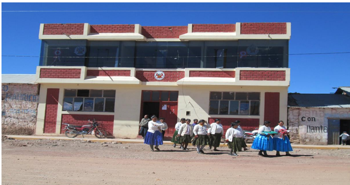
Figura 24. Gobernación del Distrito de San Juan de Salinas.