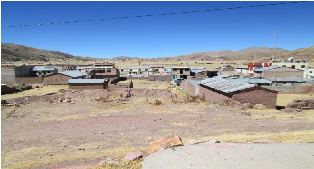
Figura 28. Pueblo de San Juan de Salinas.