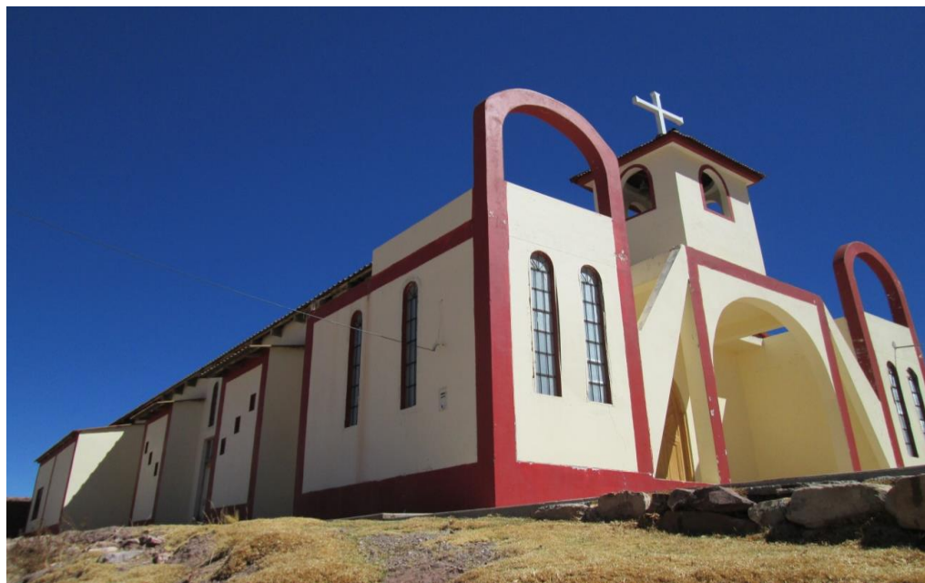
Figura 8. En la fotografía se observa la moderna fachada de la iglesia.

De igual manera se observa una torre antigua con tres vientos, construido a base de adobe, techo de calamina y palos. En la actualidad se encuentra abandonado, dicha iglesia fue edificada en devoción a la Virgen Inmaculada Concepción, la población lo venera un 15 de diciembre de cada año.