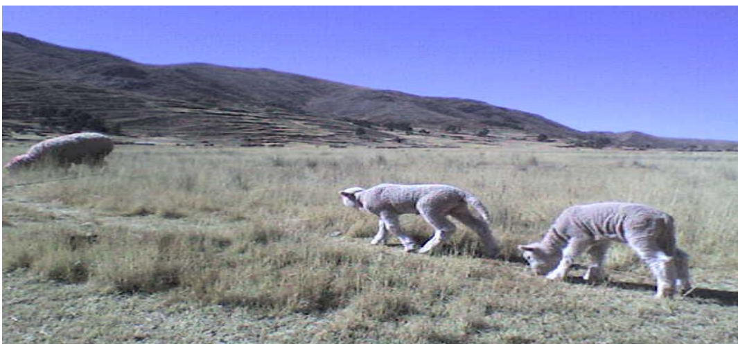
Figura 3. En la fotografía se observa a los ovinos.

Los pobladores del distrito, hasta la fecha son excelentes criadores de ganado vacuno, ovino, camélidos sudamericanos, y animales menores como aves de corral. La buena crianza de los animales se adecua al ambiente climático sin mayor riesgo de alimentación, sanidad y manejo, la población del distrito cuentan con la crianza de los animales netamente criollos.