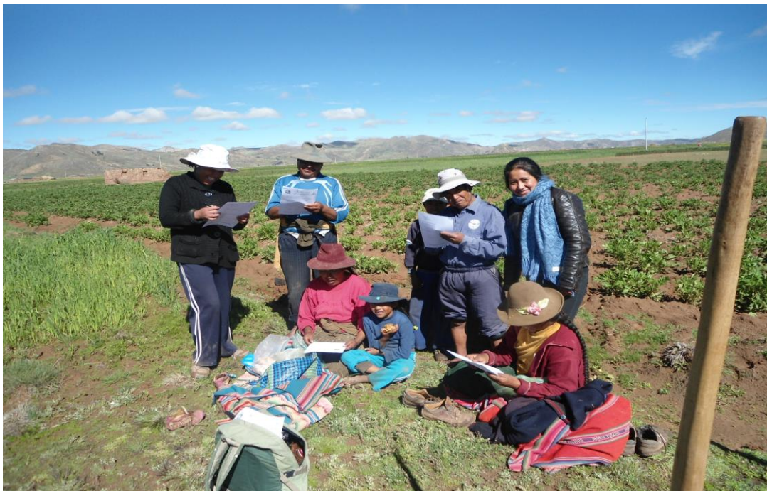
Figura 4. En la fotografía se observa Los productores de la agricultura.

Es agricultura es la actividad económica principal en donde se desarrolla a través del sistema de zonificación o rotación de cultivos. La papa, quinua, cañahua y chuño, son los productos que se lleva al mercado para vender y tener un ingreso económico, para abastecer los gastos de la familia.