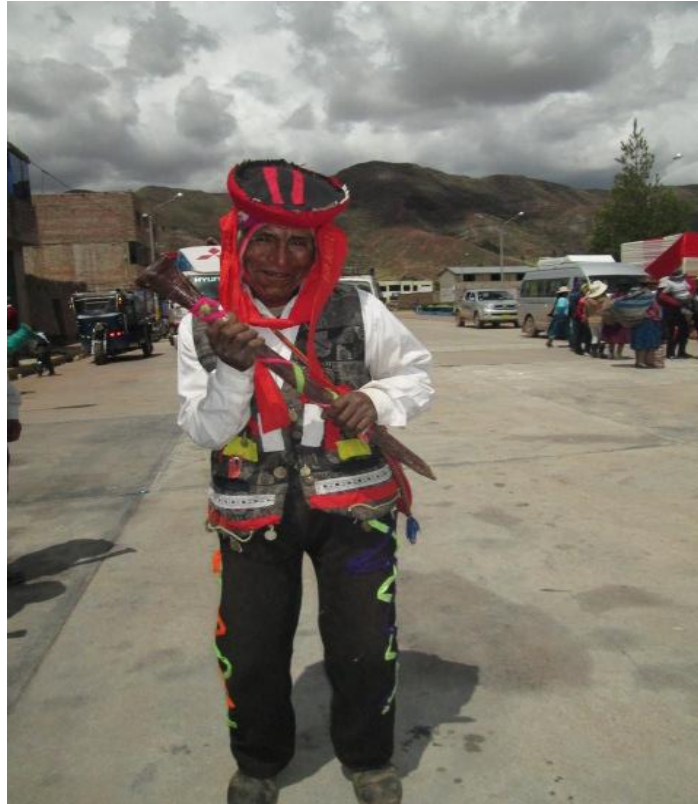
Figura 14. En la fotografía se observa la vestimenta de la danza tayta.