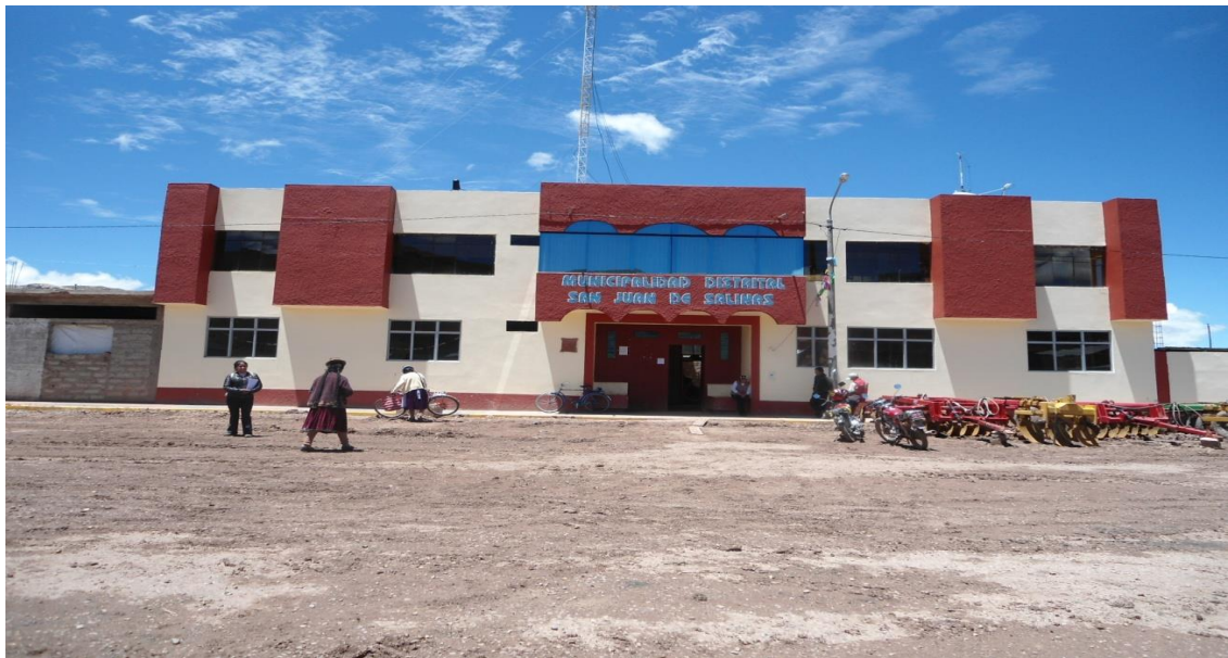
Figura 23. Municipalidad del Distrito de San Juan de Salinas.