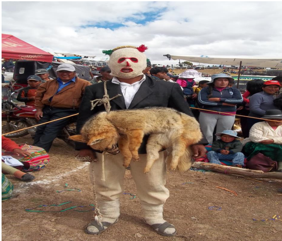
Figura 15. En la fotografía se observa la vestimenta de la danza “atoq’challay”