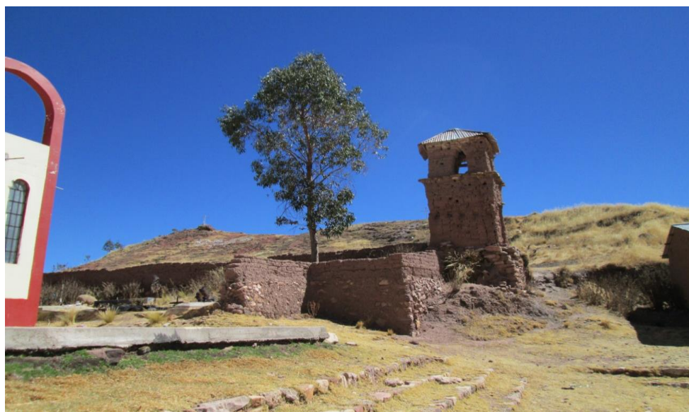
Figura 9. En la fotografía se puede observar la torre antigua.

De igual manera se observa una torre antigua con tres vientos, construido a base de adobe, techo de calamina y palos. En la actualidad se encuentra abandonado, dicha iglesia fue edificada en devoción a la Virgen Inmaculada Concepción, la población lo venera un 15 de diciembre de cada año.