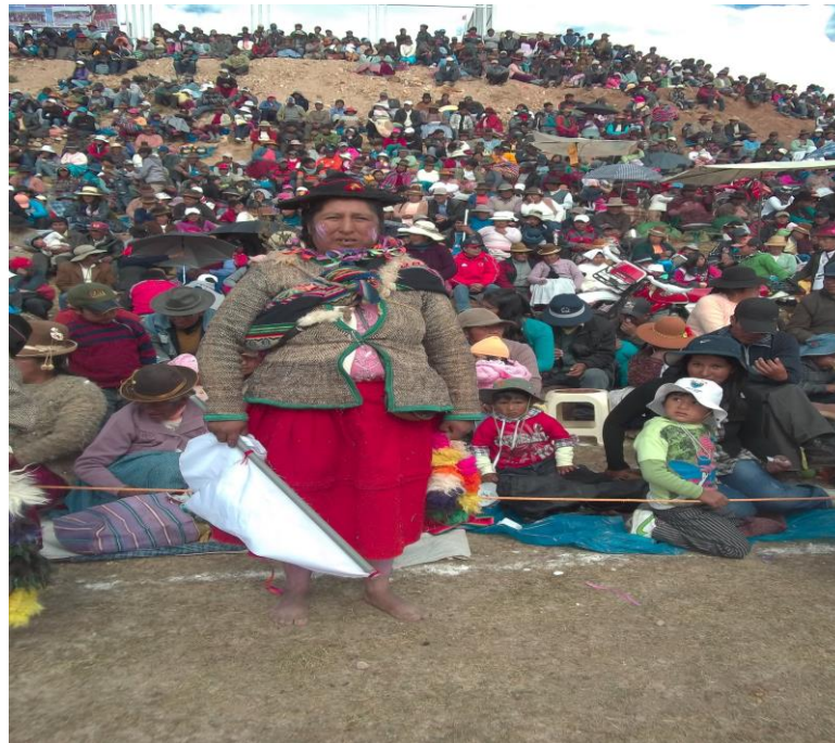
Figura 13. En la fotografía se observa la vestimenta de la Danza wifalas.

hondas en formas de rozones y trenzadas de lana de llama; los rozones están cosidos a la honda en forma de flores de diversos colores graduados artísticamente y al medio de la honda.