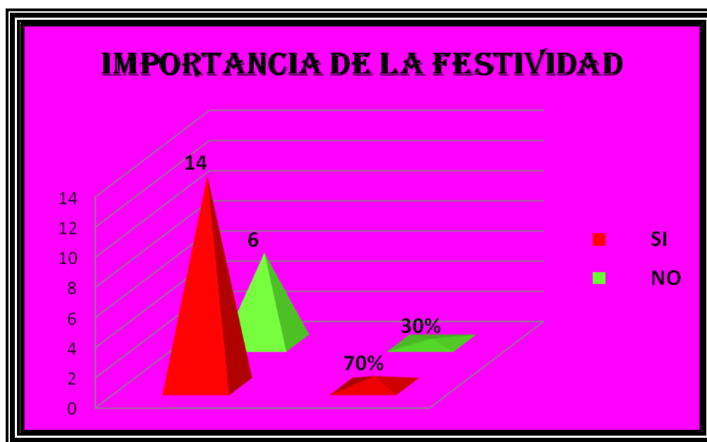
Figura 20. La Importancia de la Festividad de la Virgen Inmaculada Concepción

En el siguiente cuadro podemos observar que: el 70 % de los entrevistados le da importancia a la festividad de la Virgen y el 30 % no le importa porque para ellos ya es algo que normalmente, cada año se realiza y por lo mismo se repite cada año.