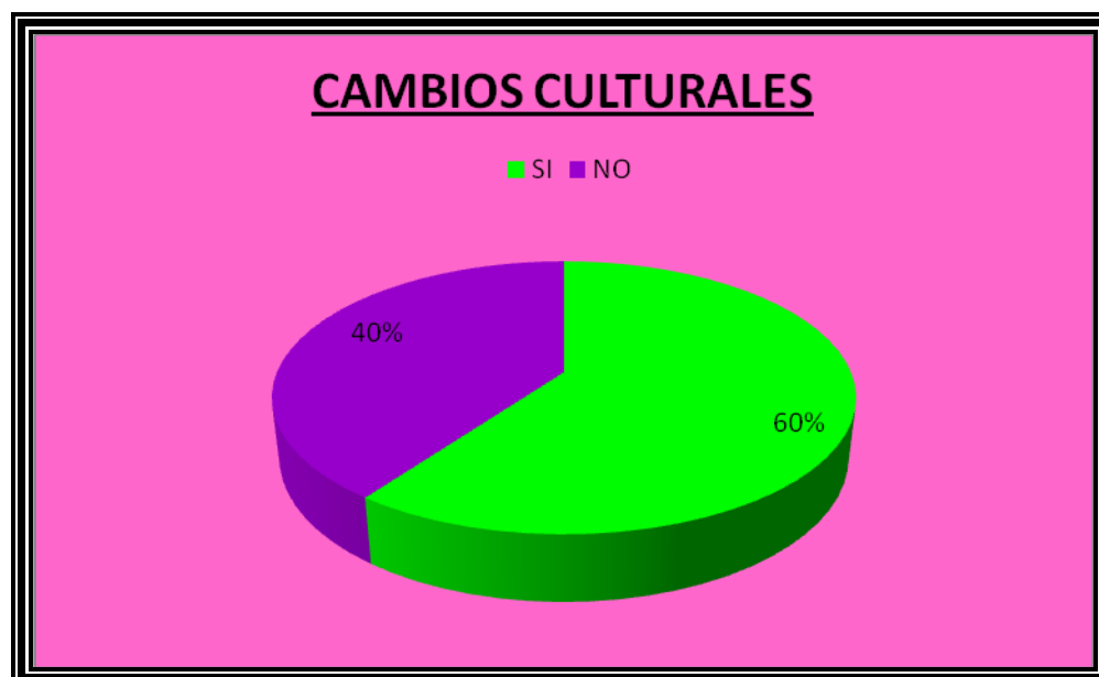
Figura 17. Cambios Culturales que se Viene dando en la Actualidad en la Festividad de la Virgen Inmaculada Concepción