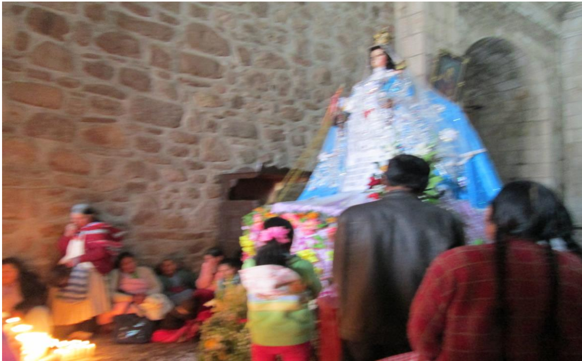
Figura 31. Virgen Inmaculada Concepcion del distrito de San Juan de Salinas.