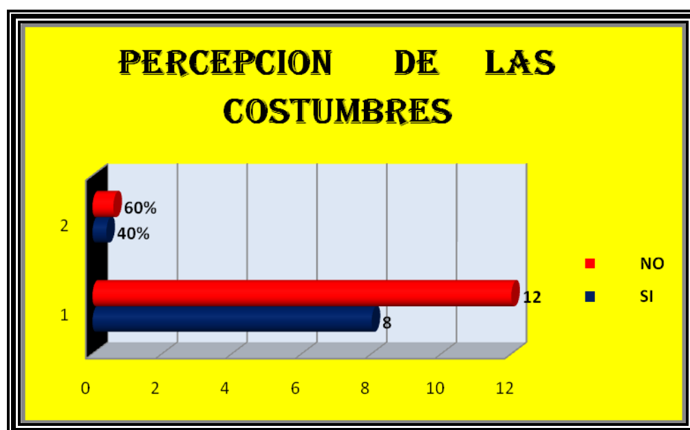
Figura 18. Estaría de acuerdo que Cambie las Costumbres de la Festividad de la Virgen