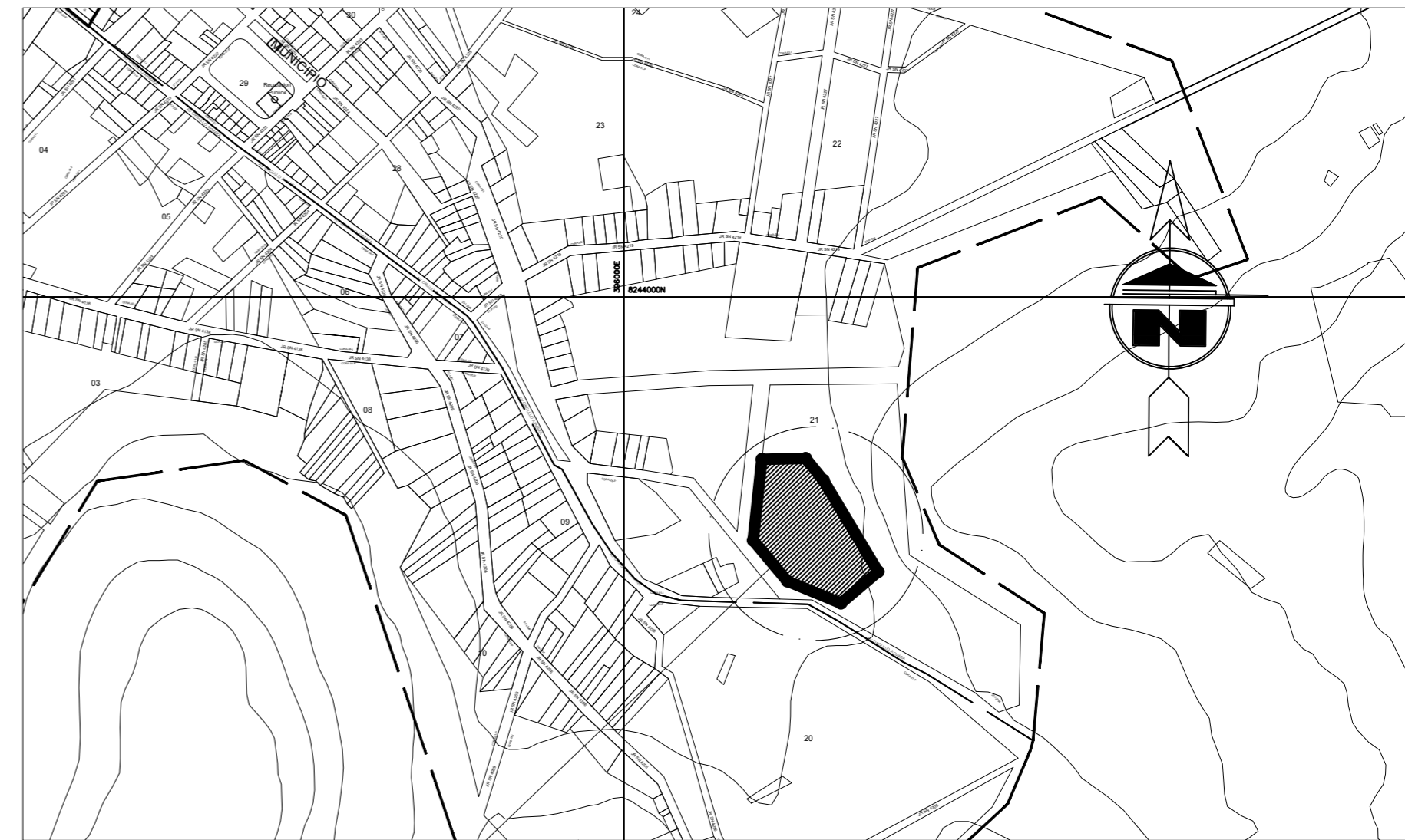
PLANO DE LOCALIZACIÓN ESC : 1/5000

AREA = 11969.90 m2 PERIMETRO = 434.19 ml.