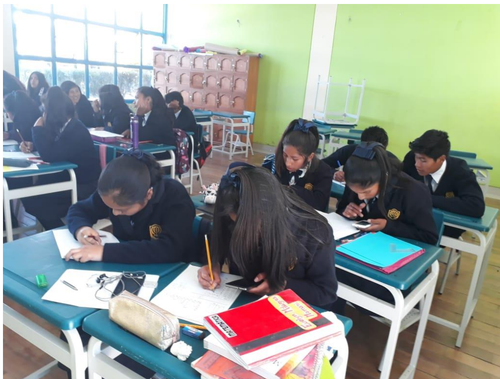
Figura 3. Llenado del Test de Inteligencia