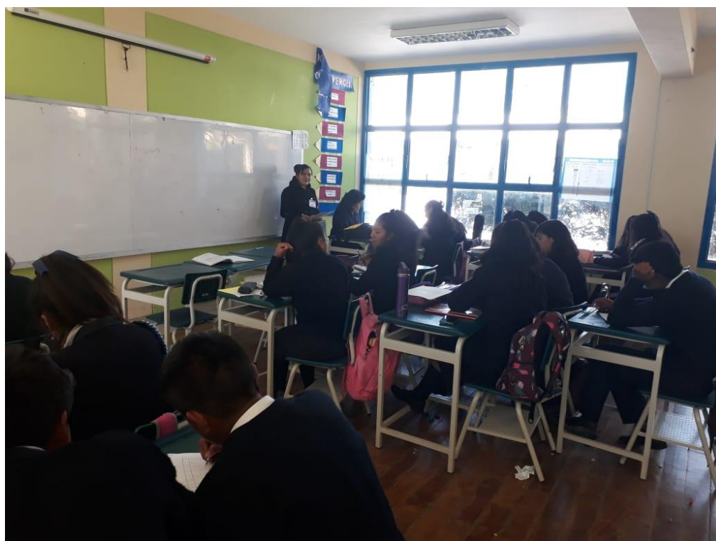
Figura 4. Realizando las indicaciones para el correcto llenado del Test de Inteligencia