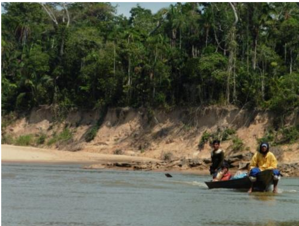
Figura 13. Embarcación de los comuneros de Sonene