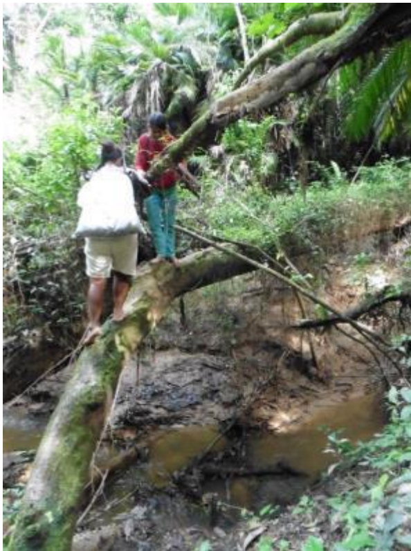
Figura 9. Artesanas pasando una quebrada cargando sus semillas