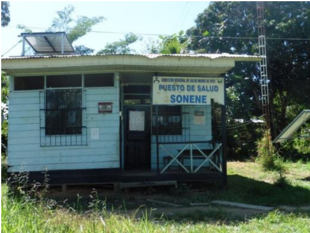
Figura 6. Puesto de salud de la comunidad Sonene