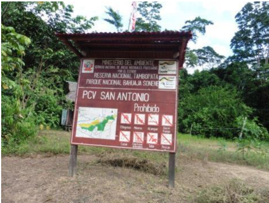
Figura 11. PC. San Antonio del Parque Nacional Bahuaja Sonene.