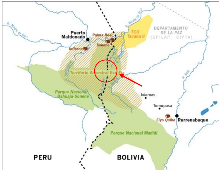
Figura 1. Mapa de la comunidad Sonene