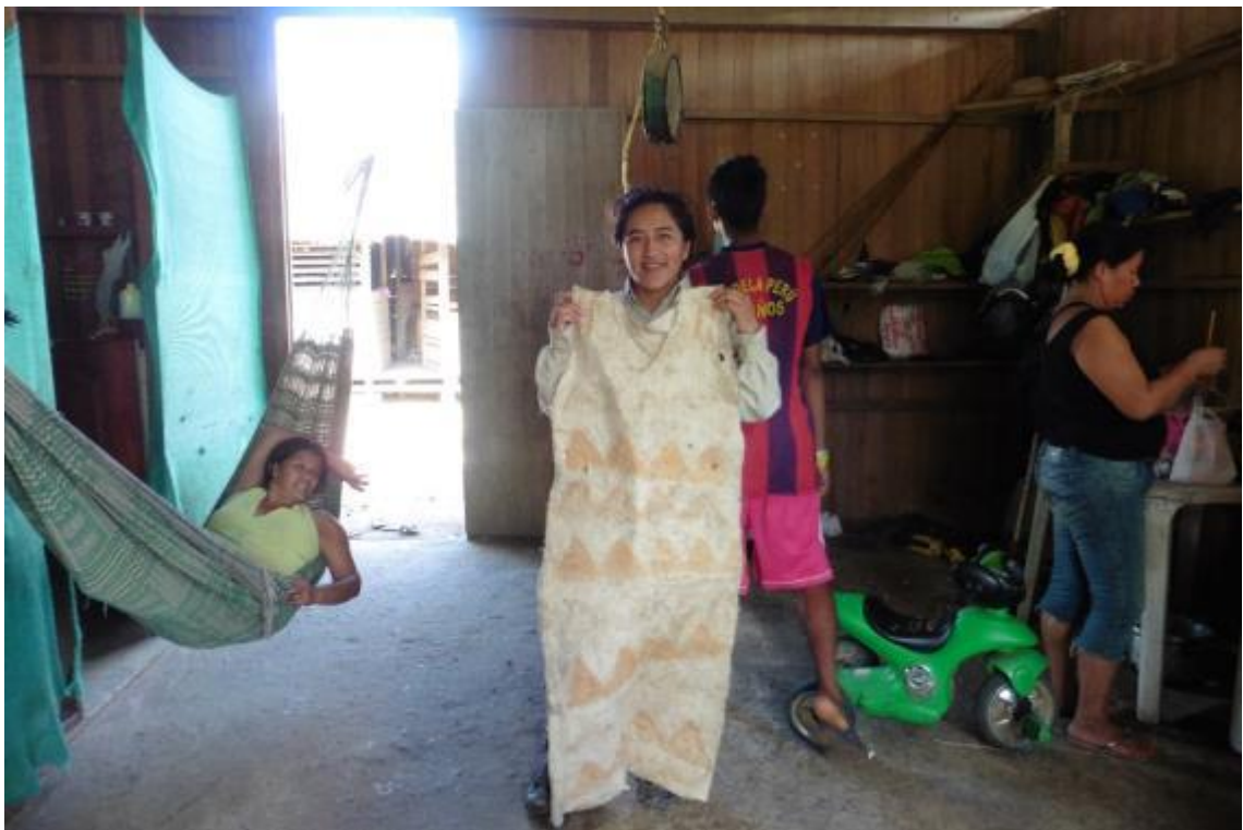
Figura 7. traje de la comunidad Sonene (jasa)