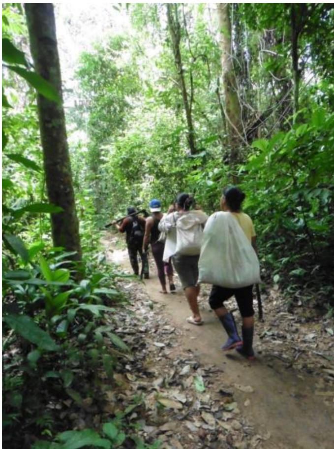
Figura 5. mujeres Ese'ija colectando frutos y semillas en la selva