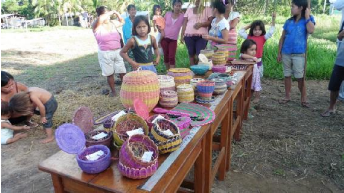
Figura 8. Artesanías elaboradas por las mujeres de la comunidad Sonene