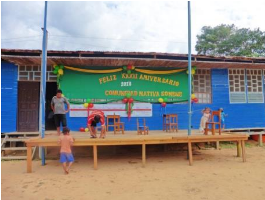
Figura 12. Preparativos de la comunidad en su aniversario