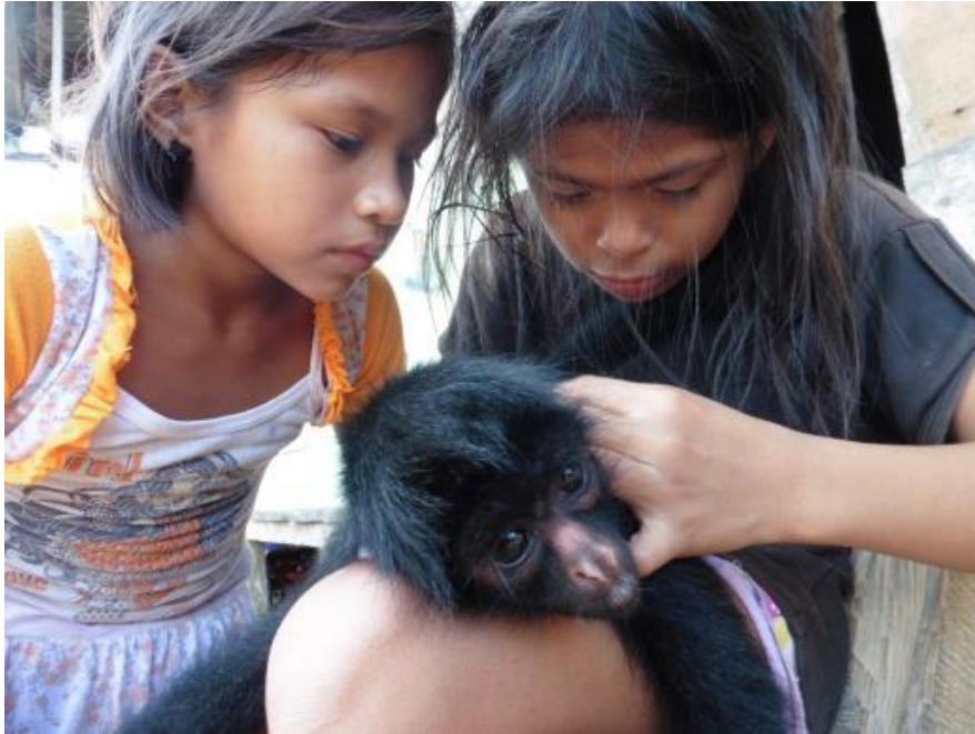
Figura 4. Niñas de la comunidad Sonene buscando piojos a su mascota