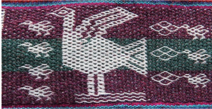
Figura 12: Ave con sus crías, diciembre.

El poblador de la isla, siempre en contacto con la naturaleza, observa los lugares donde anidan estas aves, una vez descubierto el nido contará la cantidad de huevos, si ve entre cinco a más es señal de un buen año, que se traducirá en una buena cosecha, más si ocurriera lo contrario, no habrá la cosecha esperada; este actuar del poblador se convierte en característica principal de este mes la observación de las aves, el número de crías que estas tienen, son indicadores claves para predecir el buen o mal tiempo.