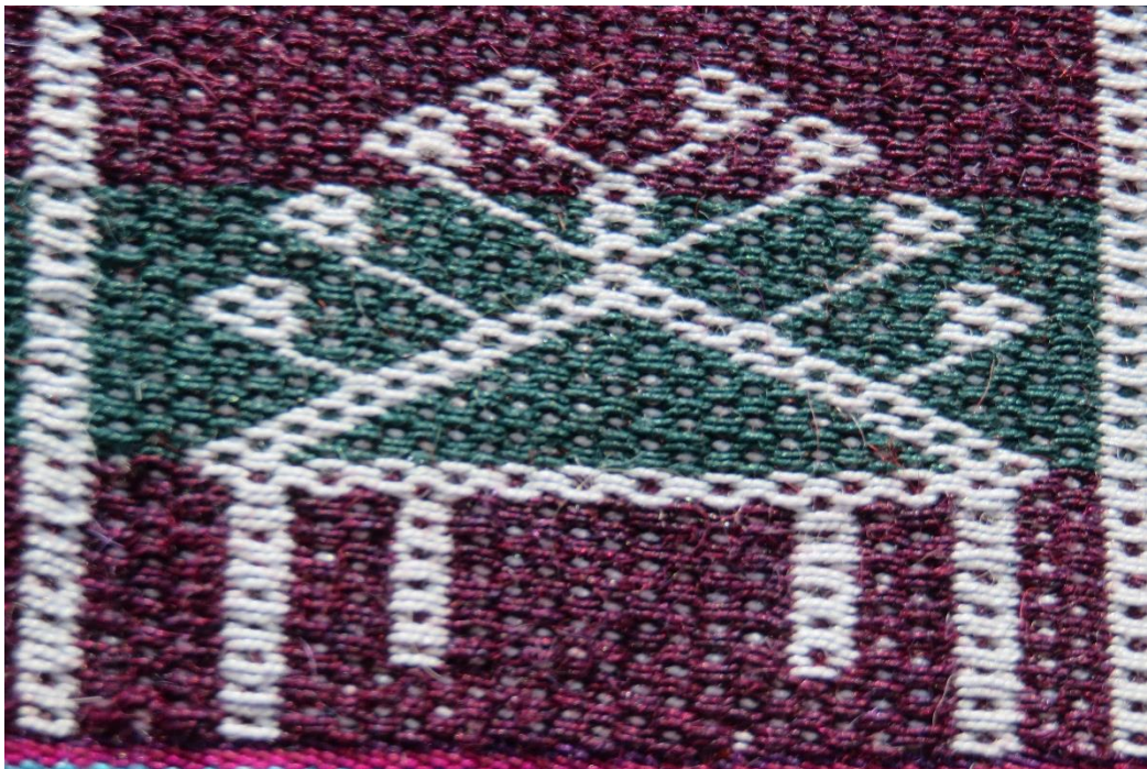
Figura 19: Altar wasi, julio.

En el calendario festivo-religioso encontramos que desde el mes de mayo hasta julio se rinde pleitesía a santos católicos venerados en esta isla; para este mes encontramos la fiesta a San Santiago, Patrono de la Isla, en cuyo honor se hace una feria artesanal y una fiesta de quince días: