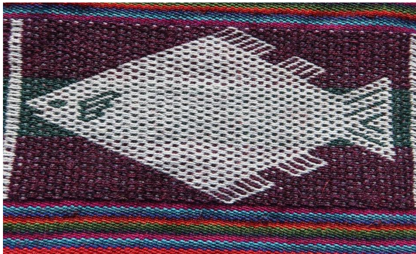
Figura 8: Pez representando a agosto.

La agricultura como actividad importante de subsistencia merece ser cuidada y/o criada de manera adecuada (Alcántara, 2014), la severidad del clima seco, de lluvias copiosas a veces inclemente con fríos fuertes en épocas de lluvia incluso, hace que el objetivo de conseguir una buena cosecha quede frustrada y por tanto, la subsistencia del