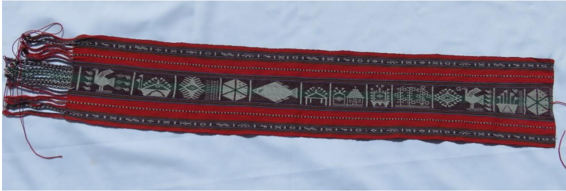
Figura 7: Faja calendario.