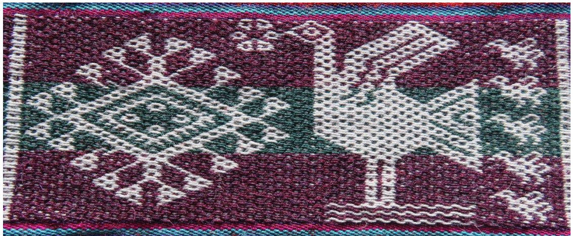
Figura 15: Pisqu y Chaska, marzo.

Traducido literalmente como el “mes de alcanzar a la tierra las súplicas de la población” o “mes de súplica a la tierra”, la chaska (estrella) que está presente en este mes recuerda efectuar los ritos de agradecimiento en el apu Mulisina , la población asciende a este cerro para efectuar la ceremonia en honor a la Pachamama (madre tierra), es también una ceremonia para suplicar bendiciones, protección para los animales, las personas, la isla; se agradece, por el buen crecimiento de los sembríos, el clima: