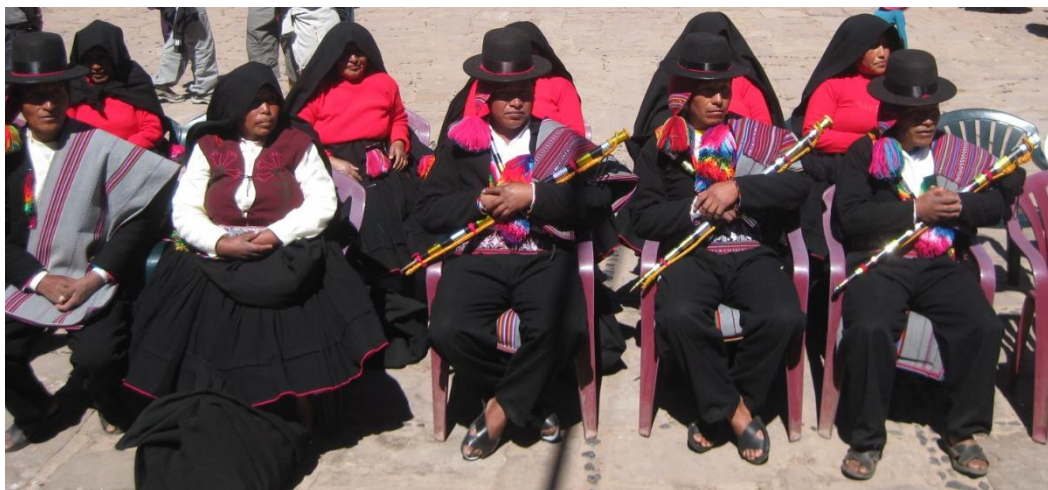
Figura 4: Autoridades de la isla.

En el aspecto político Taquile pertenece al distrito de Amantaní, responde a un gobierno tradicional, aunque pierden poder ante las autoridades impuestas por el Estado peruano, aún cumplen un papel importante en el gobierno local, lo que significa que Taquile presenta una mezcla de gobierno que viene desde la época pre inkaika, incluso el español (Prochaska, 2018). Las autoridades tradicionales son elegidas en asamblea a mano alzada en el mes de noviembre, 1 Teniente Gobernador, 2 Campuq alcaldes , 6 Campuq ; los ganadores ejercen su autoridad durante un año, su autoridad no obliga a recibir pago alguno por parte de la población, es un honor servir a su pueblo.