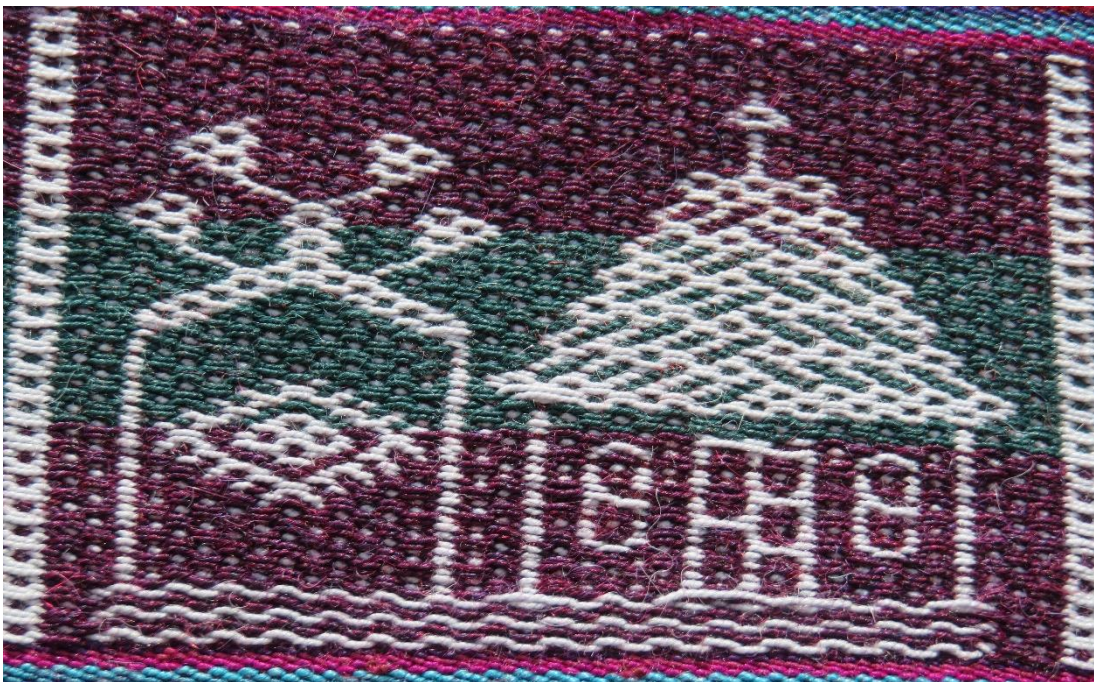
Figura 18: Casa con banderas y cruz, junio.

El ideograma de la derecha representa la casa familiar protegida por una cruz, para algunos pobladores es la casa de los recién casados, quienes piden a Dios protección para su hogar, y no falte nada, las dos ventanas que, para algunos pobladores son tuqus (agujeros), son pequeñas hornacinas circulares ubicados en la pared, solo es posible observarlos desde el interior de la habitación, allí se guardan algunas pertenencias de la familia, en la actualidad muchas de las viviendas presentan estas “ventanas ciegas”; en