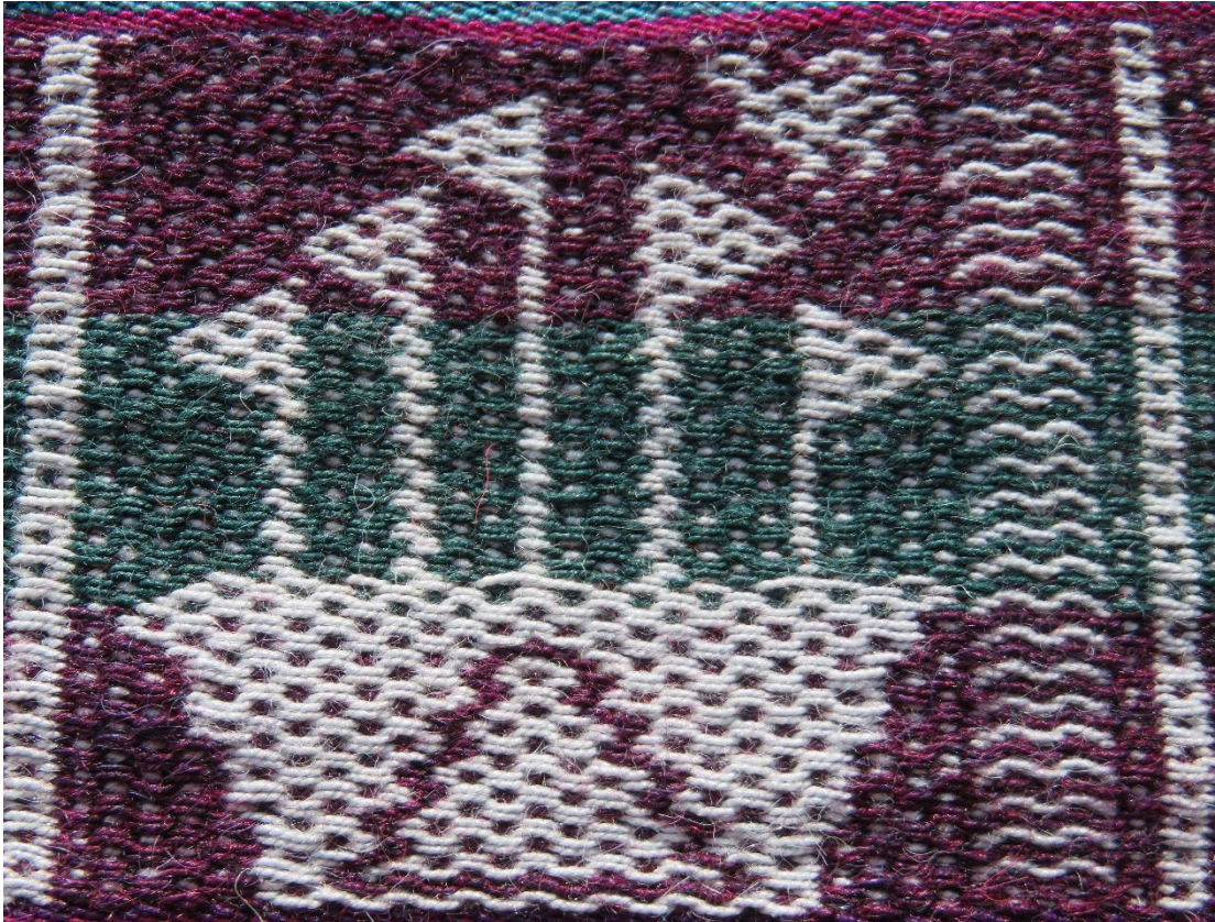
Figura 14: Rosas altar y chajmay, febrero.

Febrero es conocido como el mes de las aguas, mes en el cual se pueden presentar copiosas lluvias que favorecen el crecimiento de los sembríos, este es el tiempo cuando las plantas comienzan florecer, por ello está muy relacionada con la challa , bendición de los primeros frutos: