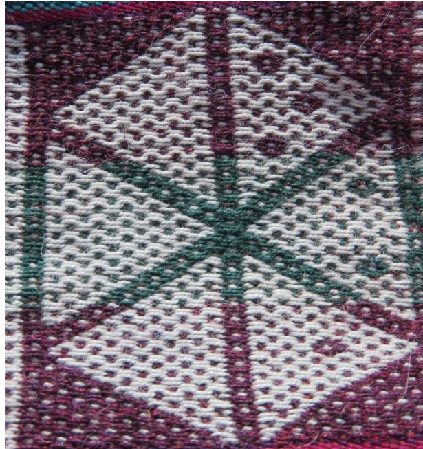
Figura 13: Rosa o sujta suyu, de enero.

Enero es el mes de la reconfirmación de aquello que se observó meses atrás; en este mes todavía se pueden efectuar las últimas siembras denominado por los pobladores como el q'ipa tarpuy (sembrío atrasado), productos como la cebada, el trigo todavía, pueden ser sembrados; también se observa el clima alrededor del día 18, día de San Sebastián, para esta fecha los sembríos efectuados en las orillas del lago, comienzan a dar los primeros frutos que los pobladores lo ven como una buena señal, también es el mes del tumiy (aporque), “volvemos felices a nuestras chacras y le damos más tierra a nuestros sembríos para que crezca bonito y haya buena cosecha” (Poblador de Taquile, 69 años); el poblador de la isla ha identificado la ejecución de dos tareas claramente definidas: