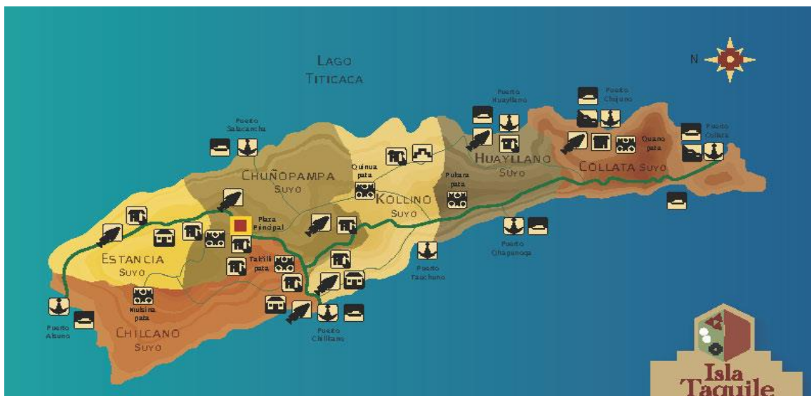
Figura 3: Taquile y sus seis suyos.