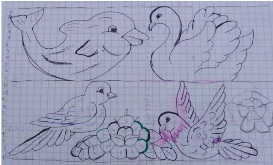
Figura 20: Diseños que se insertarán en un tejido.

La población taquileña suele observar la faja del recién comprometido, todas traen consigo un significado, el observador verá si presentan un buen acabado las figuras, “de eso depende si la nueva pareja será feliz incluso si a la mujer le gusta trabajar” (poblador de Taquile, 65 años), si así es, entonces, se habla de prosperidad, entendimiento, felicidad pero, si la faja presenta algunas deficiencias es señal de problemas, de infelicidad, por ello, tanto el varón como la mujer se deben de esmerar en elaborar una faja que indique prosperidad para su relación.