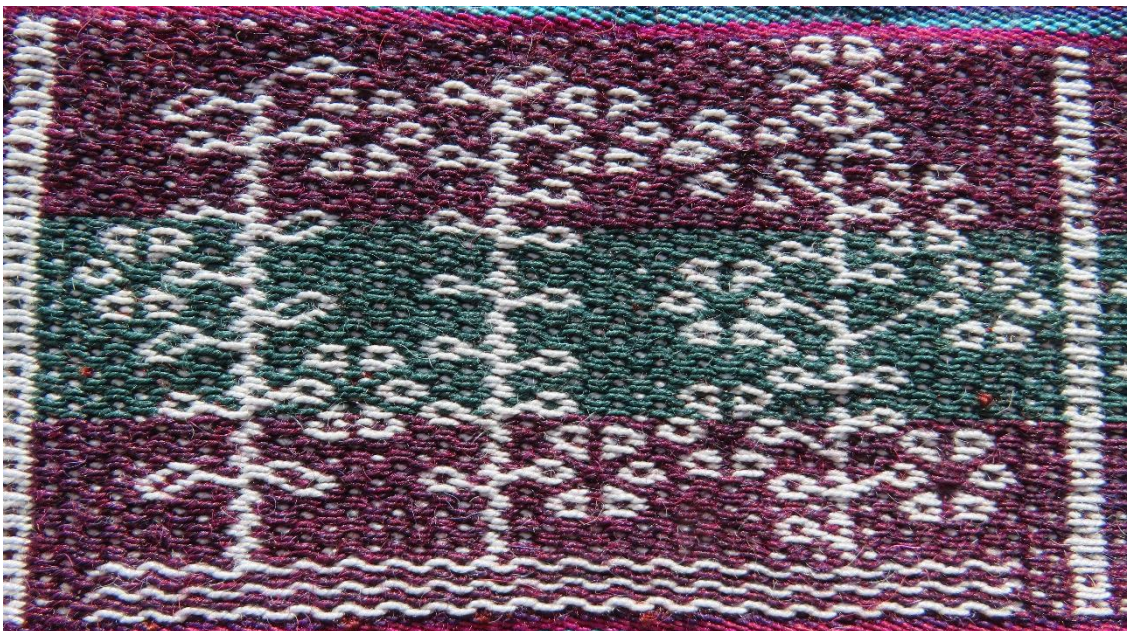
Figura 16: Tres plantas en flor, abril.

Este es el mes del inicio de las cosechas, cada una de las tres plantas representan los productos cultivados en ese año agrícola, la cantidad de precipitación pluvial, los ritos efectuados a lo largo del año, la confianza que pusieron cada uno de los pobladores dan como resultado un crecimiento óptimo de los cultivos.