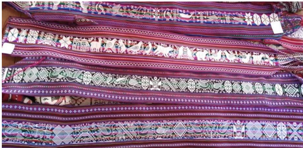
Figura 5: Faja de Taquile.