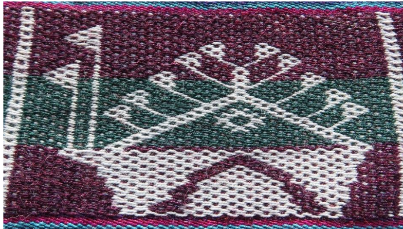
Figura 11: Rosasmayu altar, noviembre.

Para la población de taquile, noviembre es el mes en el que se eligen a las nuevas autoridades, quienes guiaran los destinos de la isla, las banderas grandes representan a las autoridades mayores el Gobernador y el presidente de la comunidad hoy reemplazado por el alcalde, las otras banderas representan a las demás autoridades elegidas recientemente, los pobladores denominan a esta figura como el “ rosasmayu altar ”. El representar a las autoridades con banderas y sobre un altar es señal que estas personas merecen todo el respeto de la población, deben iniciar su gobierno en completa armonía con los entes protectores, el rombo que vemos en medio del triángulo indica la obligación de las nuevas autoridades de realizar ofrendas a la madre tierra pachamama , poniendo todos sus sentimientos positivos para que puedan ser personas que lleven un adecuado gobierno.