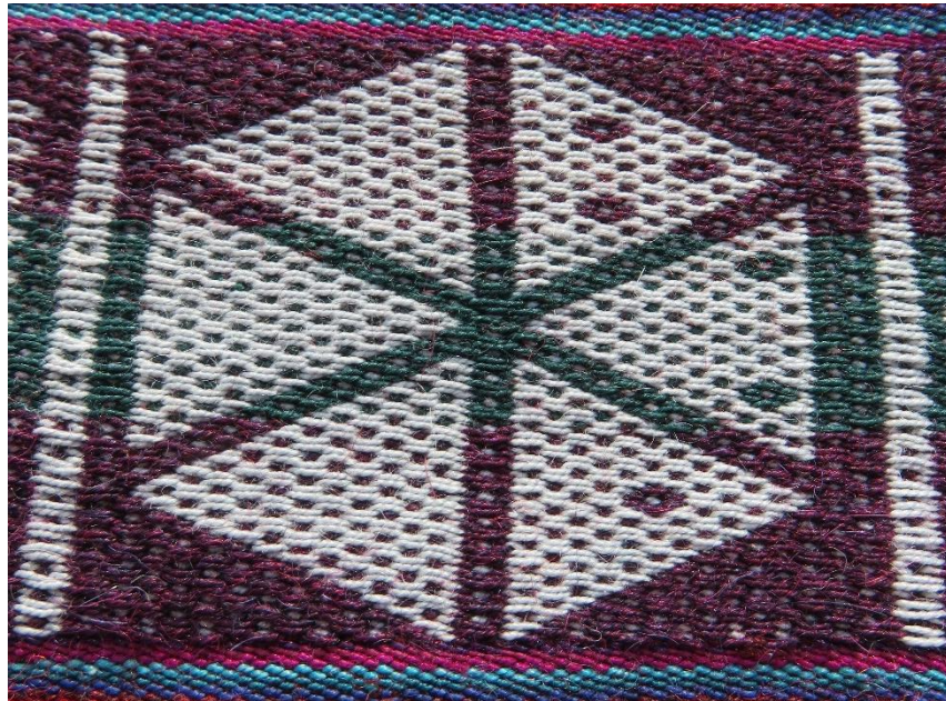
Figura 9: Rosas que representan a setiembre.

Los puntos en cada triángulo, nos indican el número de veces que se cultivó en el muyuy (tierra en rotación) del mismo modo el sembrío que le corresponde: