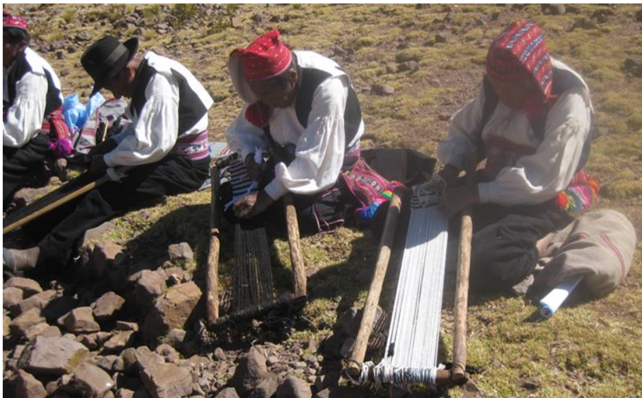
Figura 6: Hombres tejiendo la waqa.

Esta figura es muy importante, puede representar un futuro feliz para su gente o puede ser un futuro de hambre, cómo los observadores interpretan el comportamiento del pez, aquellos resultados son comparados con los del año anterior, entonces, se tendrá un pronóstico más acertado, se esta manera el pez se convierte en un señalizador del tiempo.