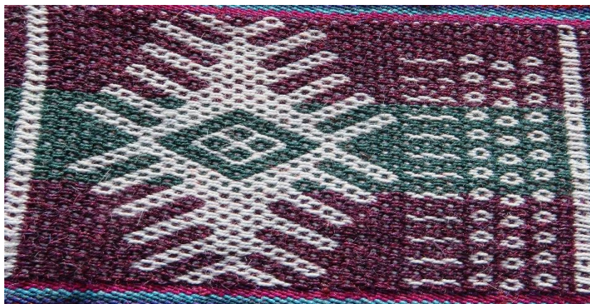
Figura 10: Tres muyus, tierras aradas y chasqa, octubre.

Octubre, muestra en el lado derecho cuatro columnas, tres de ellas con pequeñas figuras romboidales luego se advierte una columna de líneas onduladas, inmediatamente después encontramos una figura grande que representa a una Chaska (estrella), en el centro de esta figura observamos un rombo que contiene otros cuatro rombos pequeños, de la figura principal se proyectan, hacia el exterior, veinticuatro líneas, cada lado con sus seis líneas que representa una semana.