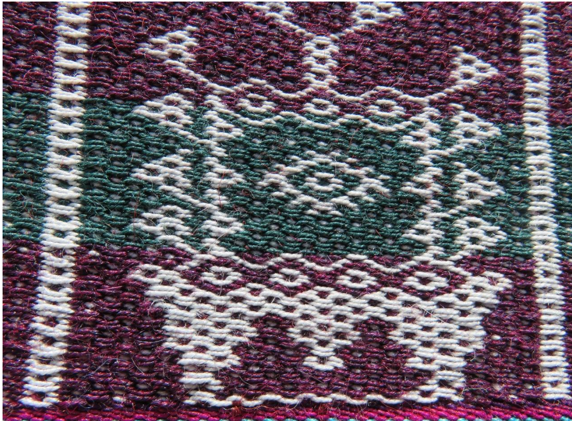
Figura 17: Altar y banderas, mayo.

La presencia, nuevamente de la chaska , nos recuerda inmediatamente a la Pachamama , las figuras con estas características hacen alusión a la obligación de efectuar ofrendas como señal de agradecimiento, el rombo no hace más que confirmar lo mencionado, las banderas aquí representados por triángulos, son las autoridades de la isla, la columna que sostiene las dos banderas indica que, la ceremonia debe hacerse en el lugar denominado “ Cruz Pata ”, y debe estar presidida por todas las autoridades de la isla.