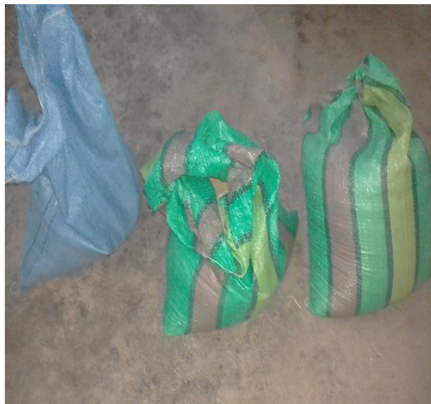
Figura 6: Raciones obtenidas de T0, T1 (2.5%) , T2 (4.5%) de MO