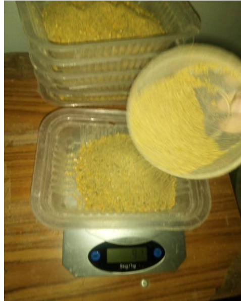
Figura 7: Pesaje de dietas ofrecidas