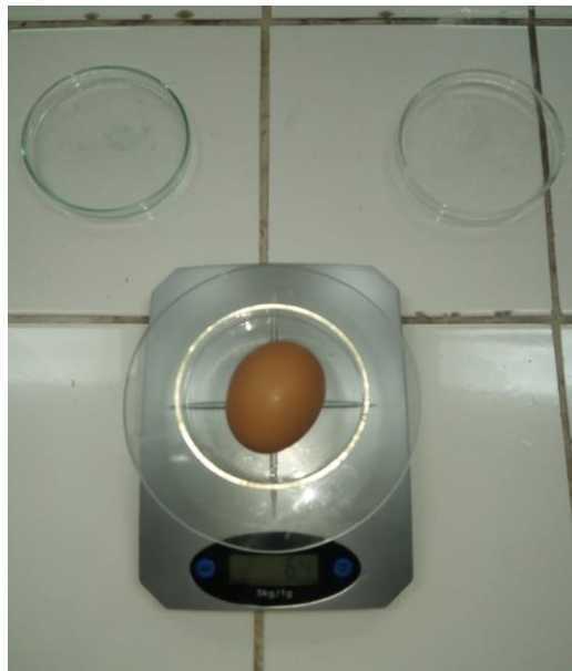
Figura 10: Pesaje de huevos