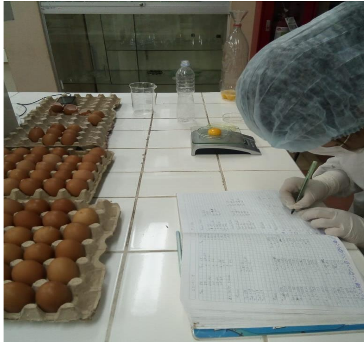
Figura 15 : Registro de datos