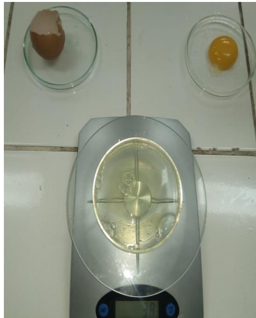
Figura 13: Peso de clara