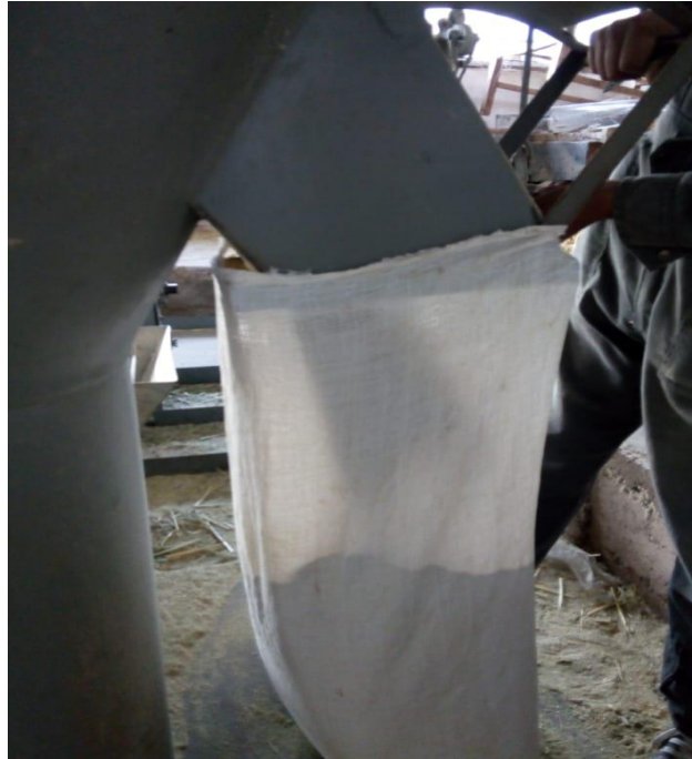
Figura 5: Obtención de raciones