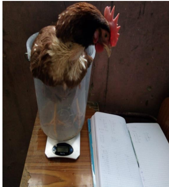
Figura 9: Pesaje de pollas