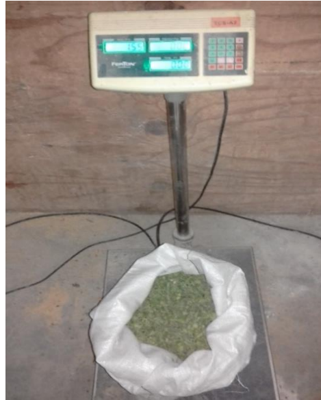
Figura 1: pesaje de hojas deshidratadas de moringa oleifera