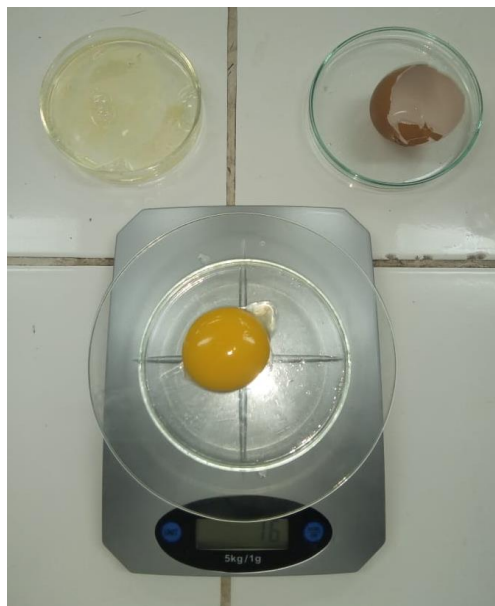
Figura 12: Peso de yema