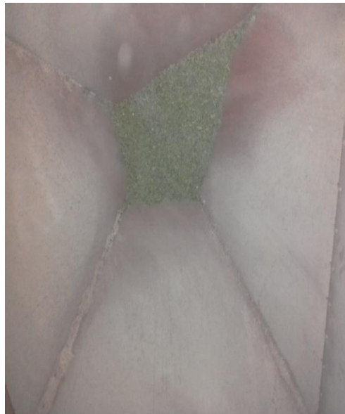
Figura 2: molienda de hojas de moringa