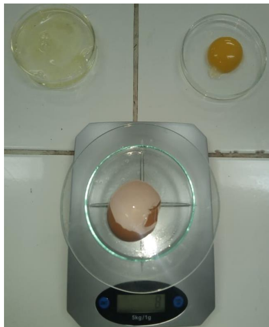
Figura 14: Peso de cascara