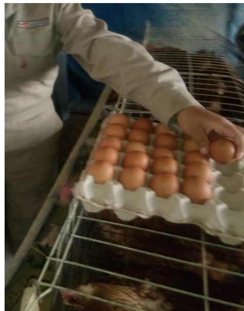
Figura 8: Recojo de huevos