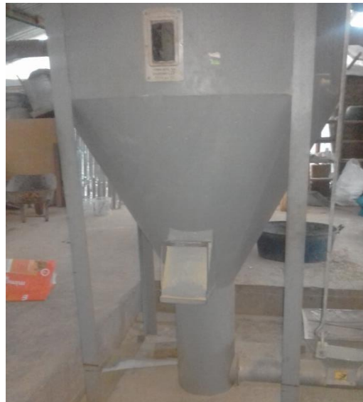
Figura 4: Molienda y mezcle de insumos