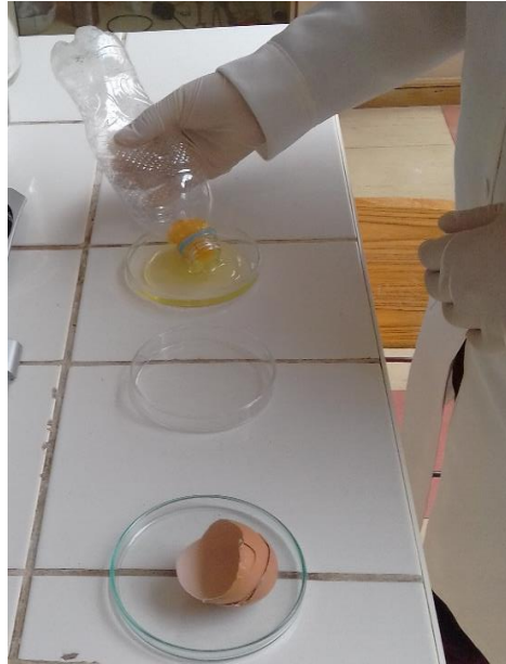
Figura 11: Separación de yema de la clara por absorción