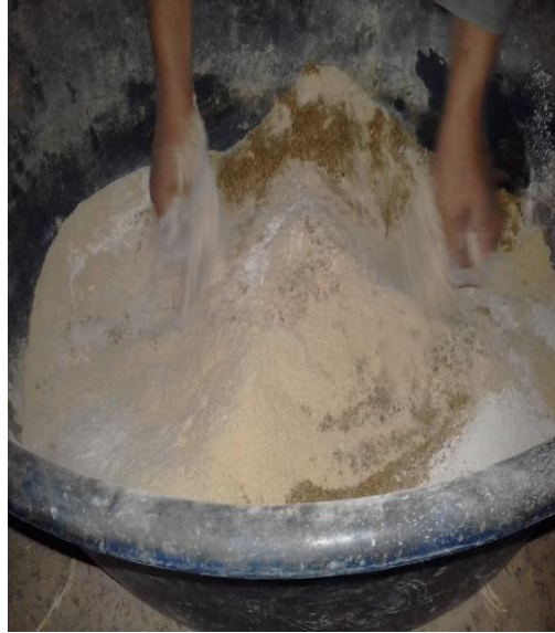
Figura 3: Mezcla manual de insumos