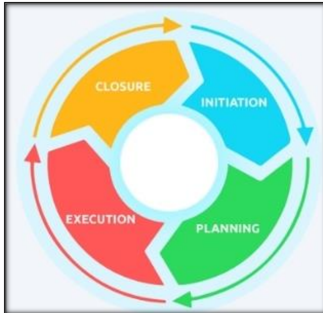
Figura 1. Etapas y fases de la elaboración de un plan de vida, tomado de del Manual de Plan de Vida

La construcción o elaboración de un proyecto de vida forma parte del transcurso de maduración afectiva e intelectual y como tal supone aprender a crecer, y requiere del apoyo constante de los padres de familia al estudiante. La construcción de proyectos de vida serán los cumplimientos de las metas a corto, mediano y largo plazo, ligado al conocimiento del propio sujeto, sus intereses, aptitudes recursos económicos, posibilidades y expectativas del núcleo familiar de pertenencia, sustentada en la realidad en que se vive, pero si el entorno social del estudiante es insuficiente, difuso y el entorno social es crítico e inseguro es probable que se genere en este conflictos de la identidad, lo cual producirá vulnerabilidad frente a las expectativas del logro. La falta de un proyecto de vida causa un sentimiento de tristeza y frustración, y muchas veces puede estar más expuesta a situaciones vulnerables prevenibles.