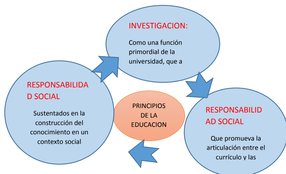
Figura 2. Proyecto Educativo Universitario UNA – PUNO -2013.

La educación universitaria es un proceso democrático, crítico e innovador que parte de la problemática y potencialidades de la realidad regional, para consolidar la formación personal y desarrollar competencias, capacidades y actitudes de profesionales autónomos, autorregulados y reflexivos que contribuyan al desarrollo sostenible (Resolucion Rectoral N° 2329-2013-R-UNA, 2013).