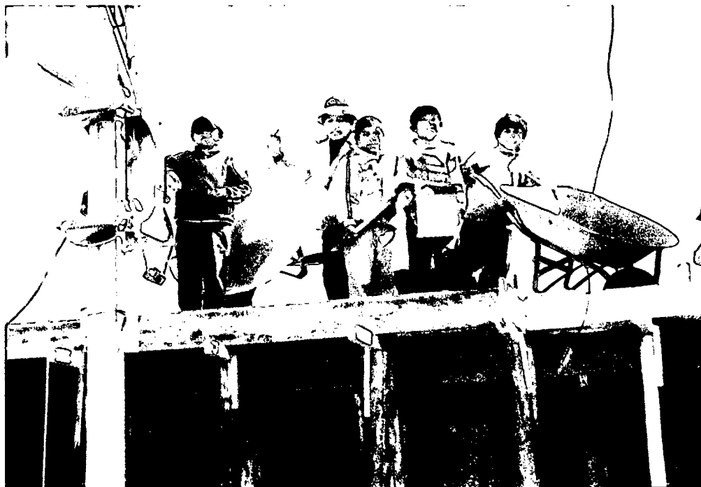
Foto 3. Descansando después de terminar la faena del Wasichacuy.