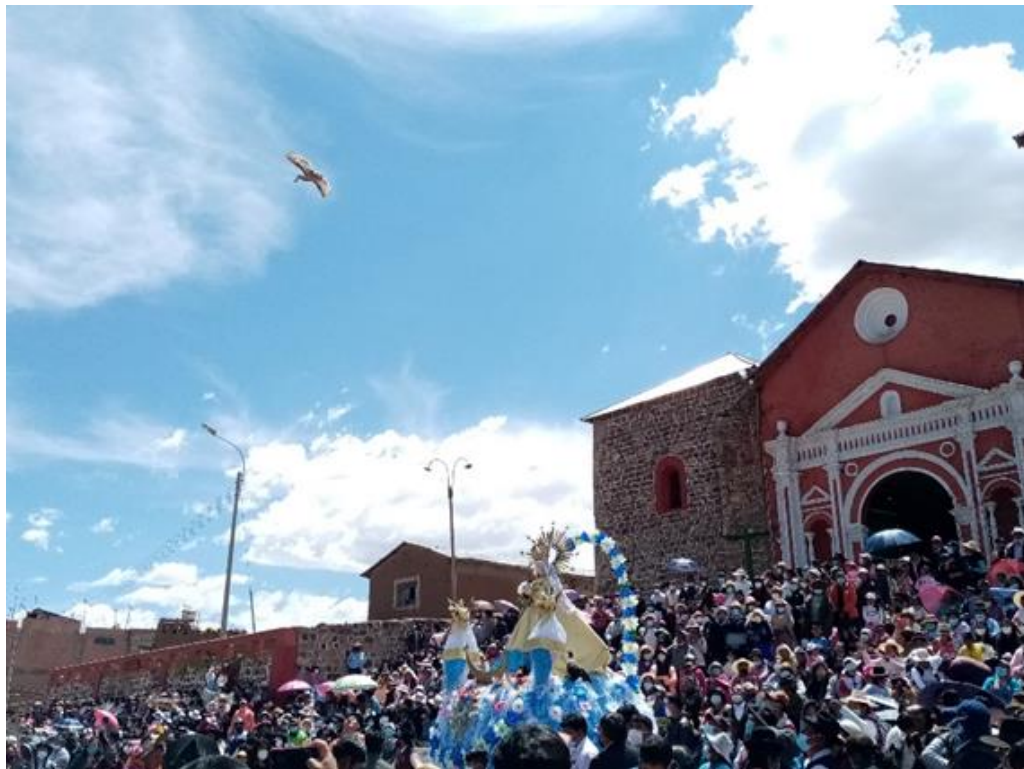
Figura 5. El vuelo de los patos en dirección al lago.