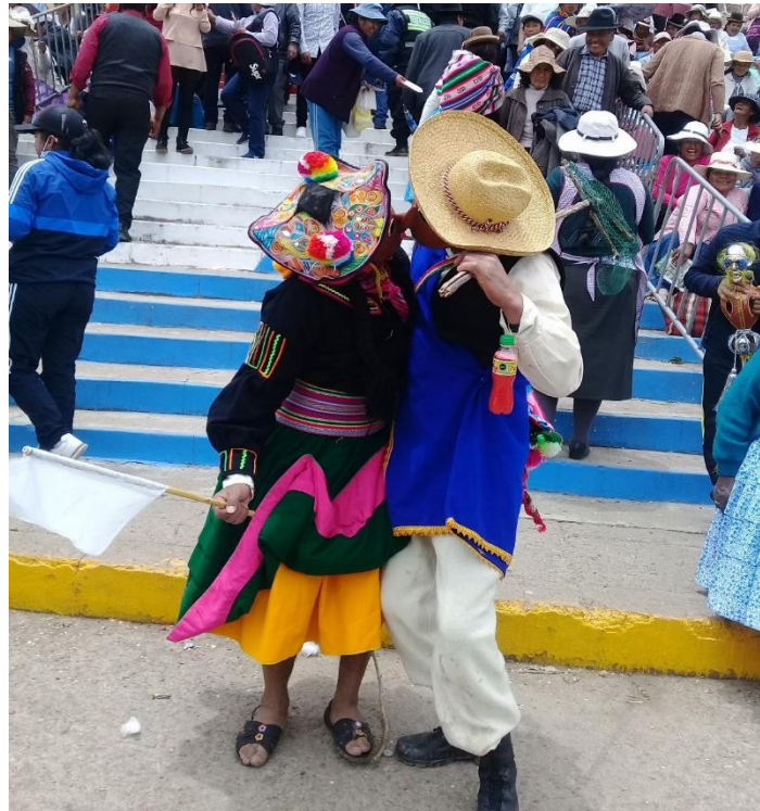
Figura 12. La pareja de Quchamachus