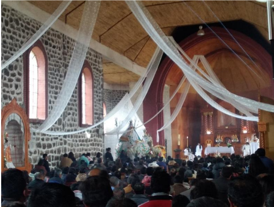
Figura 2. Veneración a la Virgen Inmaculada Concepción