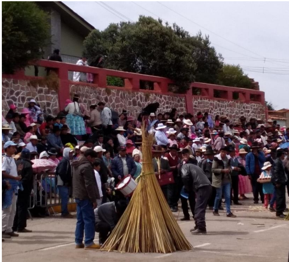
Figura 10. Los cabecillas armando la casa del Quchamachu llamada Icalina.