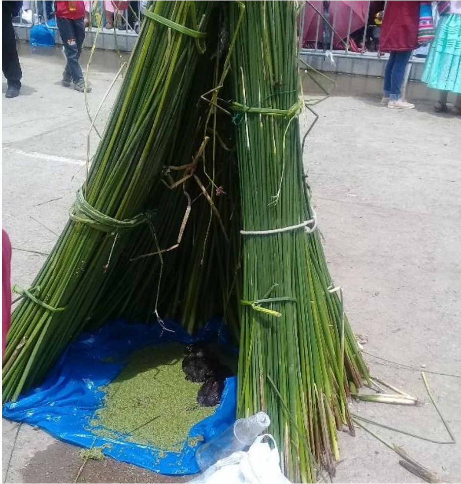
Figura 9. Casa de los patos, dentro se encuentran tiquichos.