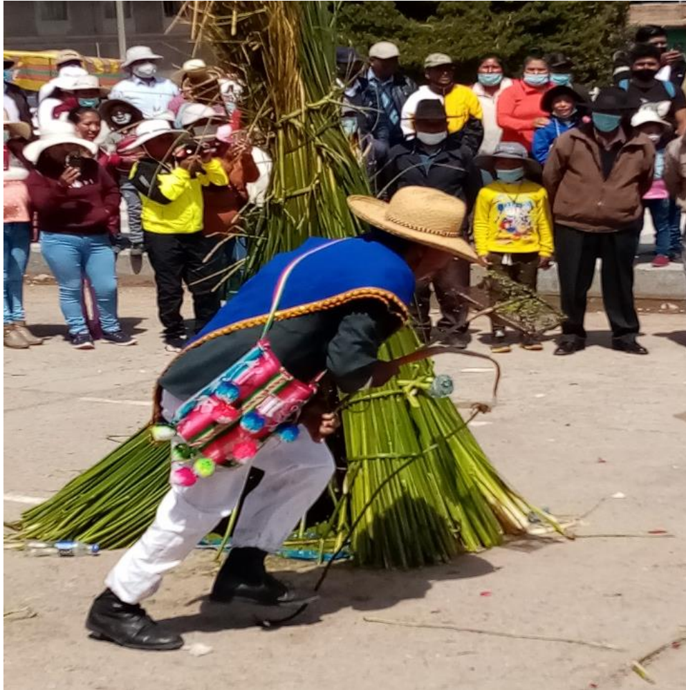
Figura 7. El Quchamachu tratando de apagar el fuego de su casa con la huppa que lleva dentro su q'ahana.