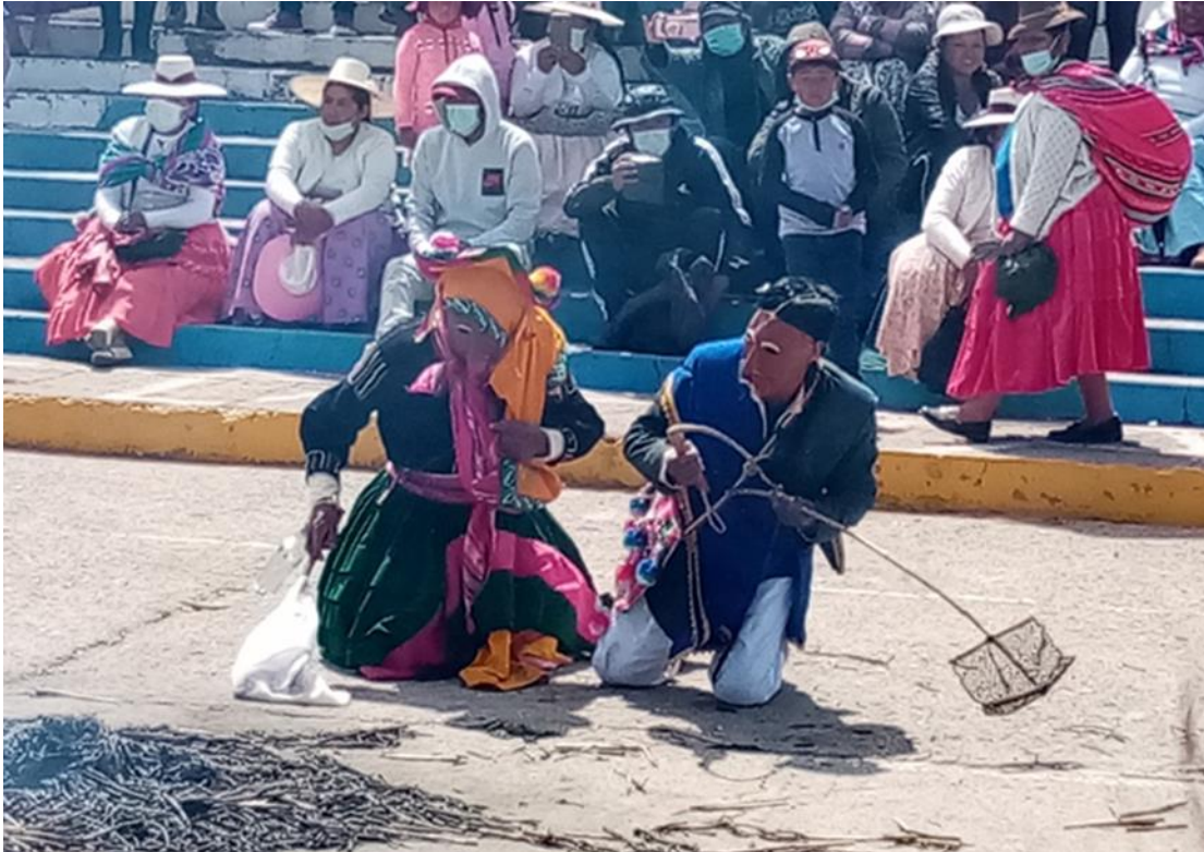
Figura 8. Pareja de Quchamachu lamentándose por haber perdido todo