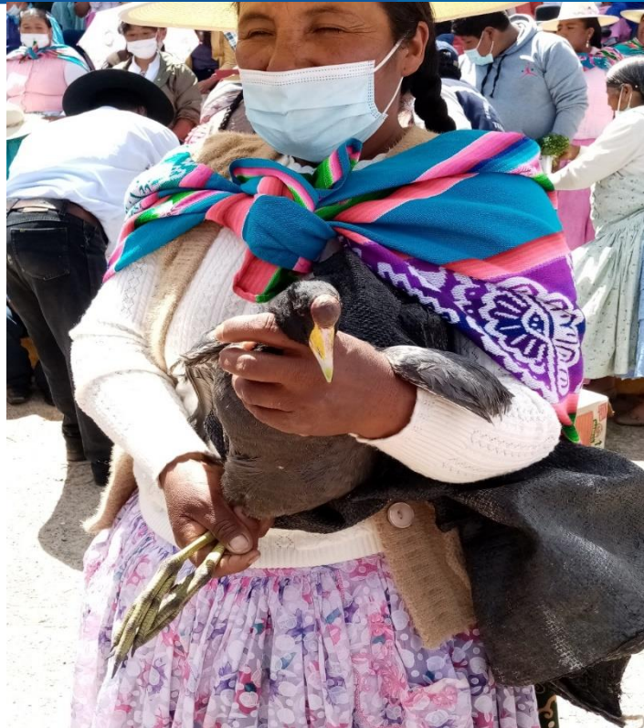
Figura 14. Pobladora agarrando al tiquicho.