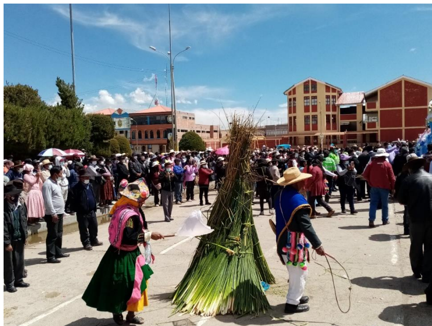
Figura 13. Los Quchamachus defendiendo la casucha de los patos.