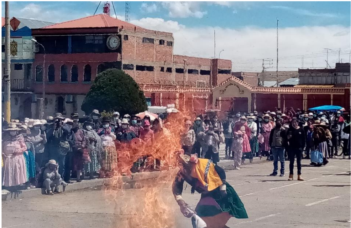
Figura 6. El Quchamachu tratando de apagar el fuego de su casa con la h'uppa.