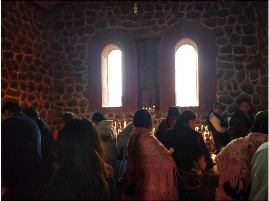
Figura 4. Población prendiendo sus velas en la iglesia.