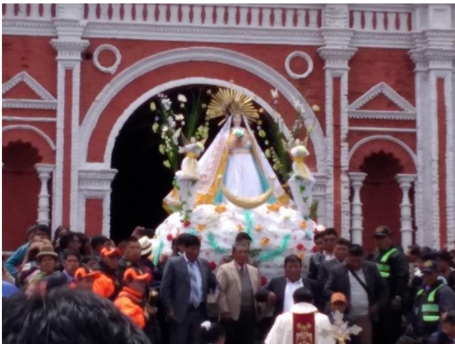
Figura 3. Procesión de la Virgen Inmaculada Concepción