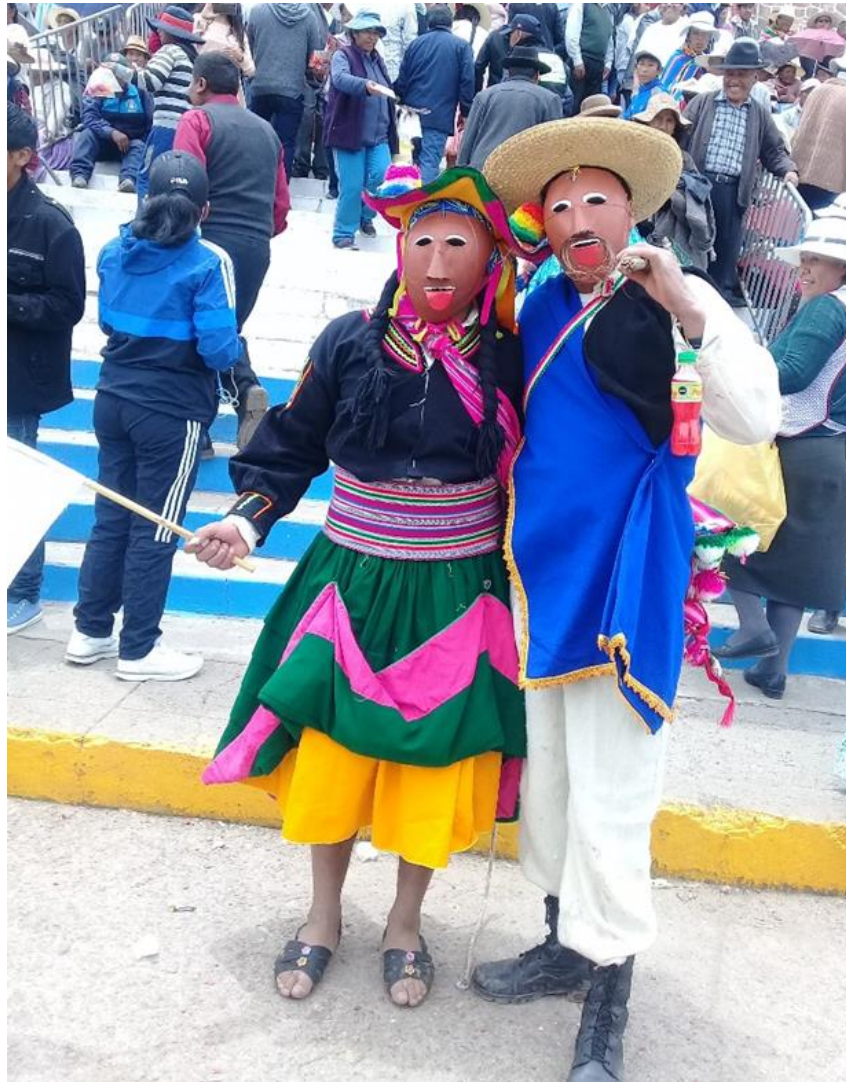
Figura 11. Vestimenta de la pareja del Quchamachu

familia, donde los Quchamachus quieren la paz para todos incluidos los visitantes.