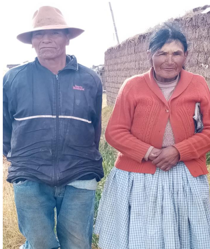
Figura 15. Pobladores zona lago e informantes claves.