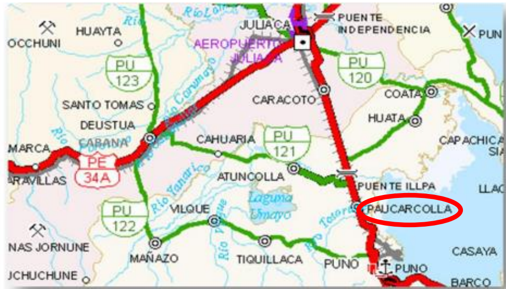
Figura 2. Croquis del distrito de Paucarcolla