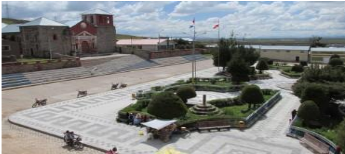
Figura 3. Plaza del distrito de Paucarcolla

de administración y otros. En la misma zona también se prevé la instalación de equipo mecánico, además de un centro de investigación técnico vehicular.