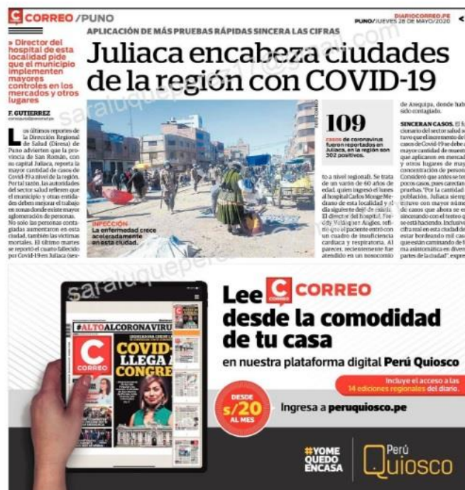
Ilustración 15- Juliaca encabeza ciudades de la región con COVID-19