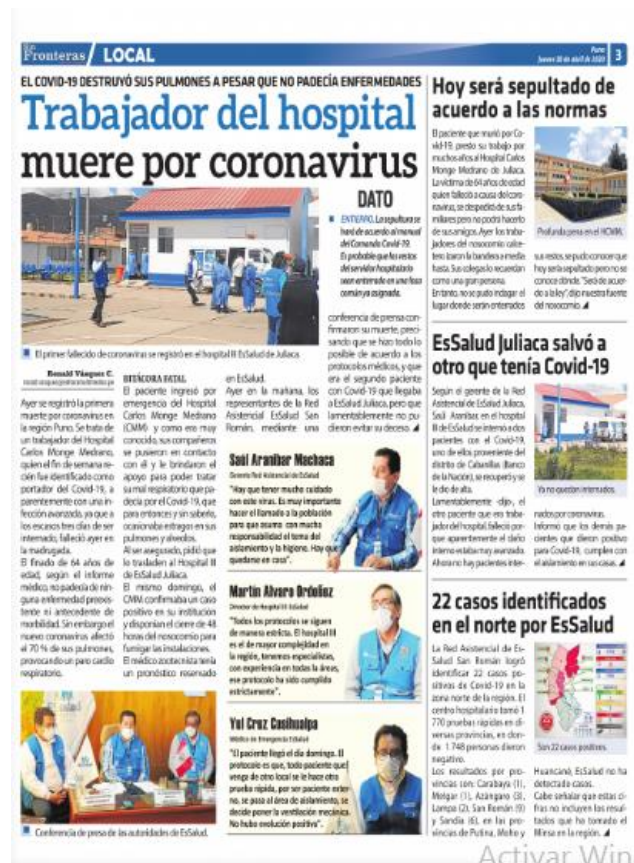
Ilustración 16- Trabajador del hospital muere por coronavirus