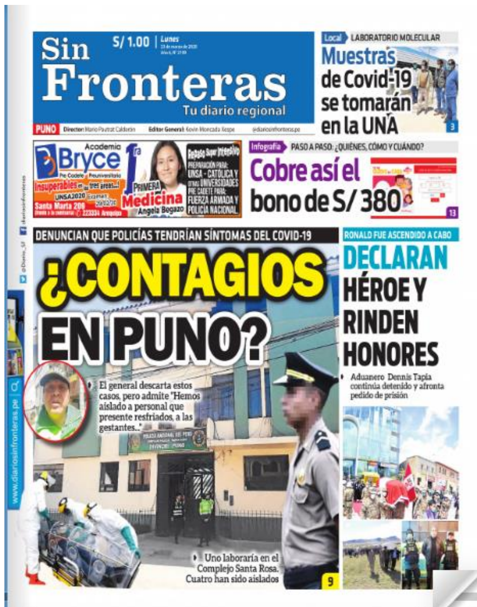
Ilustración 6 - ¿Contagios en Puno?