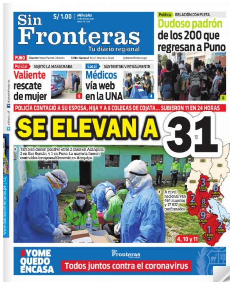
Ilustración 10 - Se elevan a 31