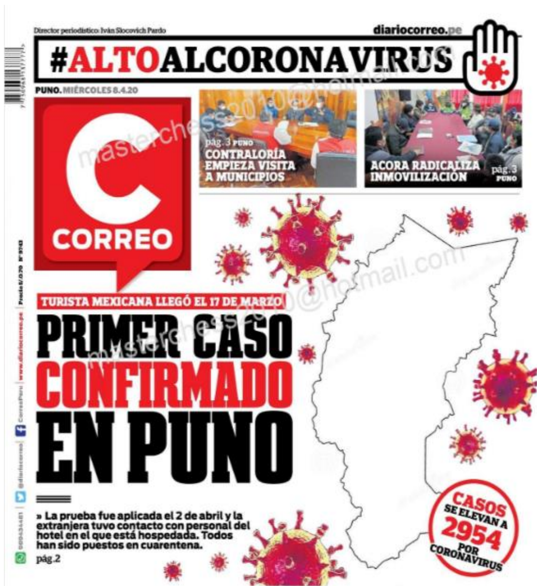
Ilustración 2- Primer caso confirmado en Puno