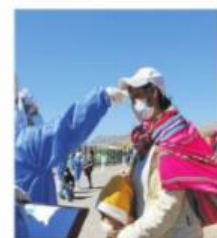
Otros siguen recuperándose.

es encabezada por San Román con 163 casos, seguida de Puno, en donde se registraron 101 personas infectadas. Según las Redess de Huancané, que agrupa a las provincias de San Antonio de Putina y Moho, en su jurisdicción se reportaron otros 24 casos hasta la tarde de ayer. A nivel de las demás provincias, la lista va