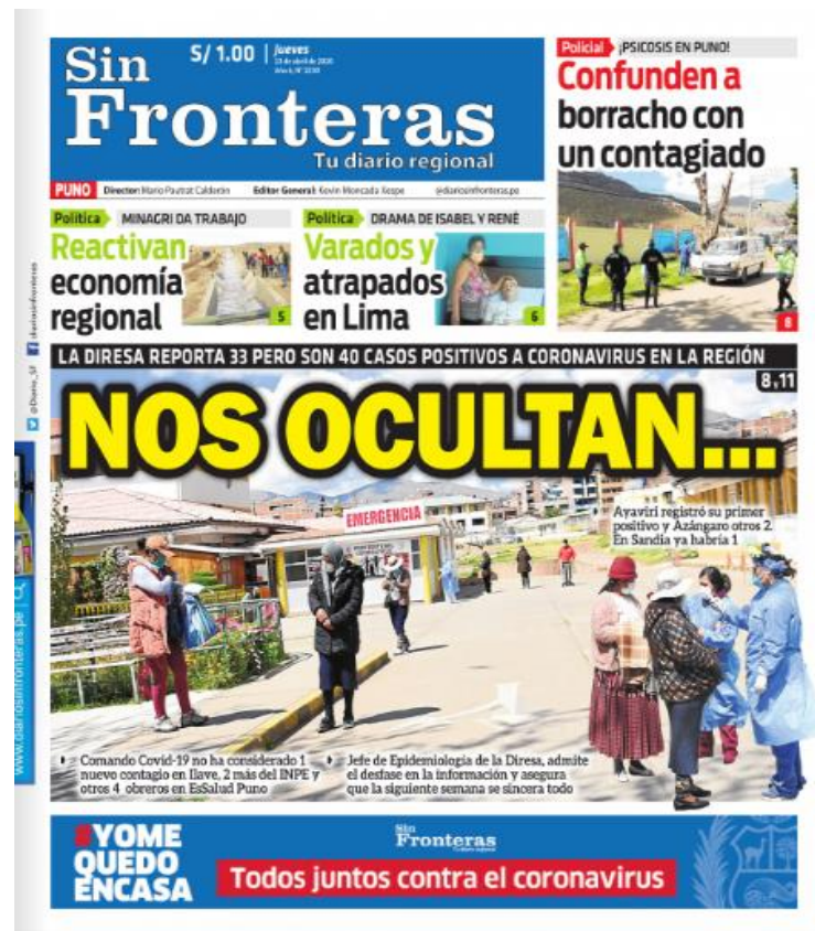
Ilustración 11 - Nos ocultan...