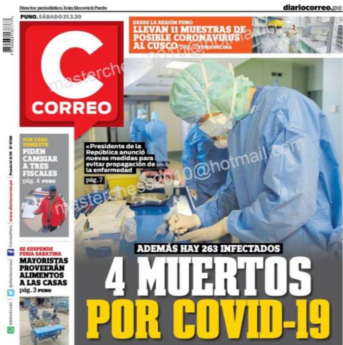
Ilustración 1 - 4 muertos por COVID-19