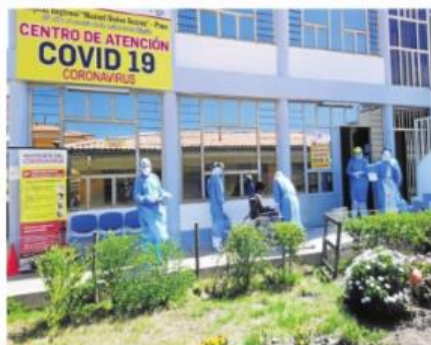
■ La cifra de contagiados se acerca a los 400.

Luego de que las autoridades sanitarias intensificaran las labores preventivas en varios puntos de la región, informaron que la cifra de infectados con el Covid-19, sigue incrementando considerablemente y de nuevo, la provincia más afectada fue San Román, en donde se reportaron 34 casos más en un solo día. La Dirección Regional de Salud (Diresa) de Puno, en su reporte N° 049, señaló que en la región ya existen 379 casos confirmados de Coronavirus, de los cuales 362 se conocieron mediante pruebas rápi-