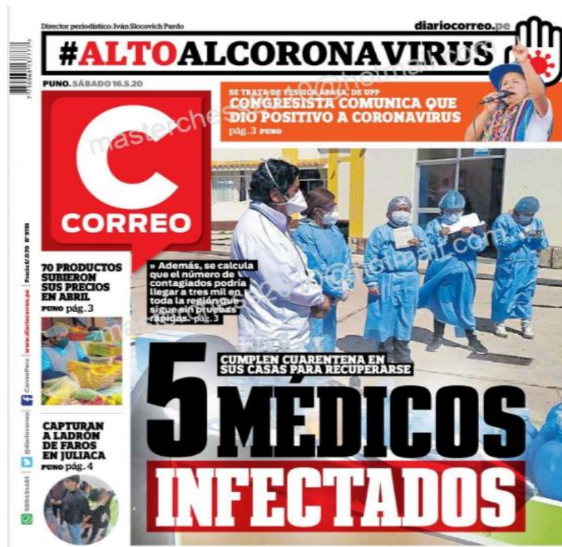
Ilustración 9 - 5 médicos infectados