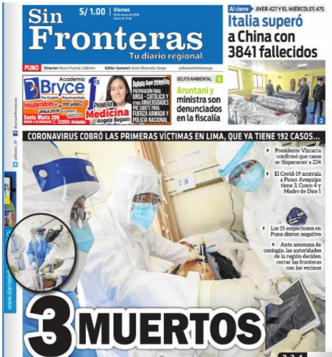
Ilustración 5 - 3 muertos