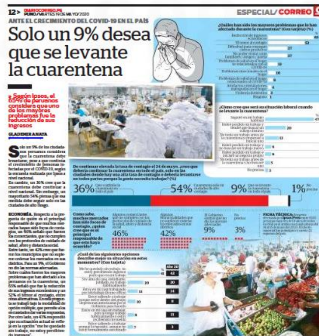
Ilustración 23 - Solo un 9% desea que se levante la cuarentena