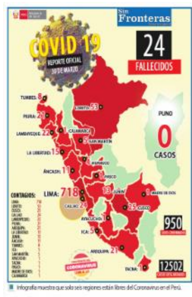
Ilustración 26 - COVID-19 reporte oficial