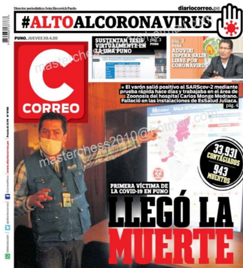
Ilustración 7- Llegó la muerte