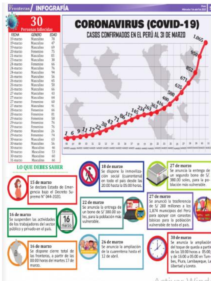
Ilustración 25 - Coronavirus (COVID-19)