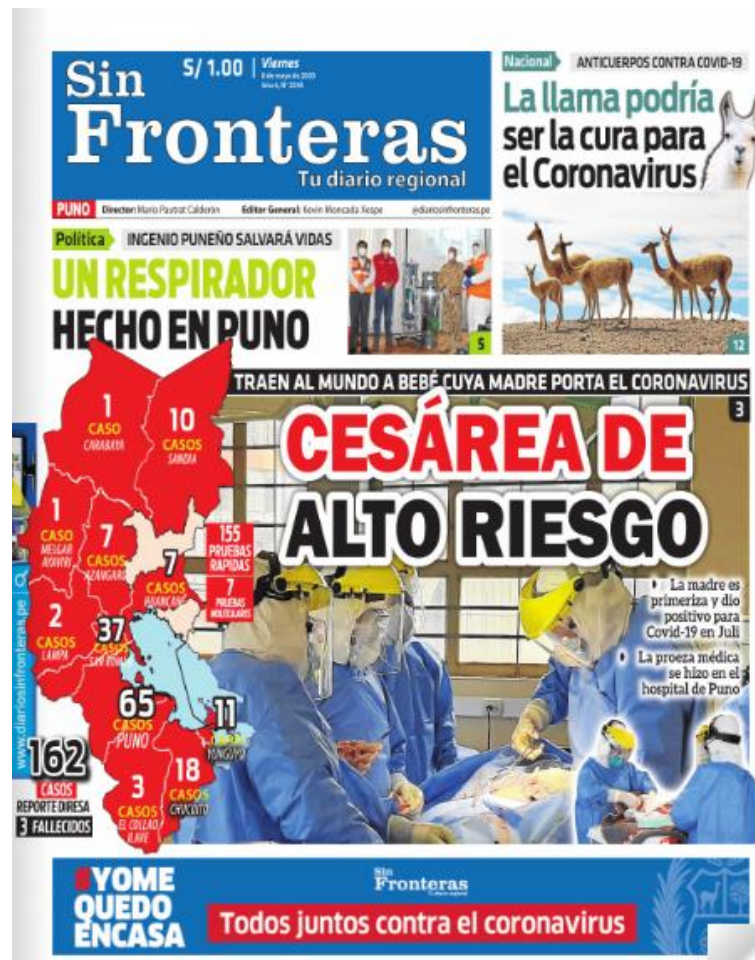
Ilustración 12 - Cesárea de alto riesgo