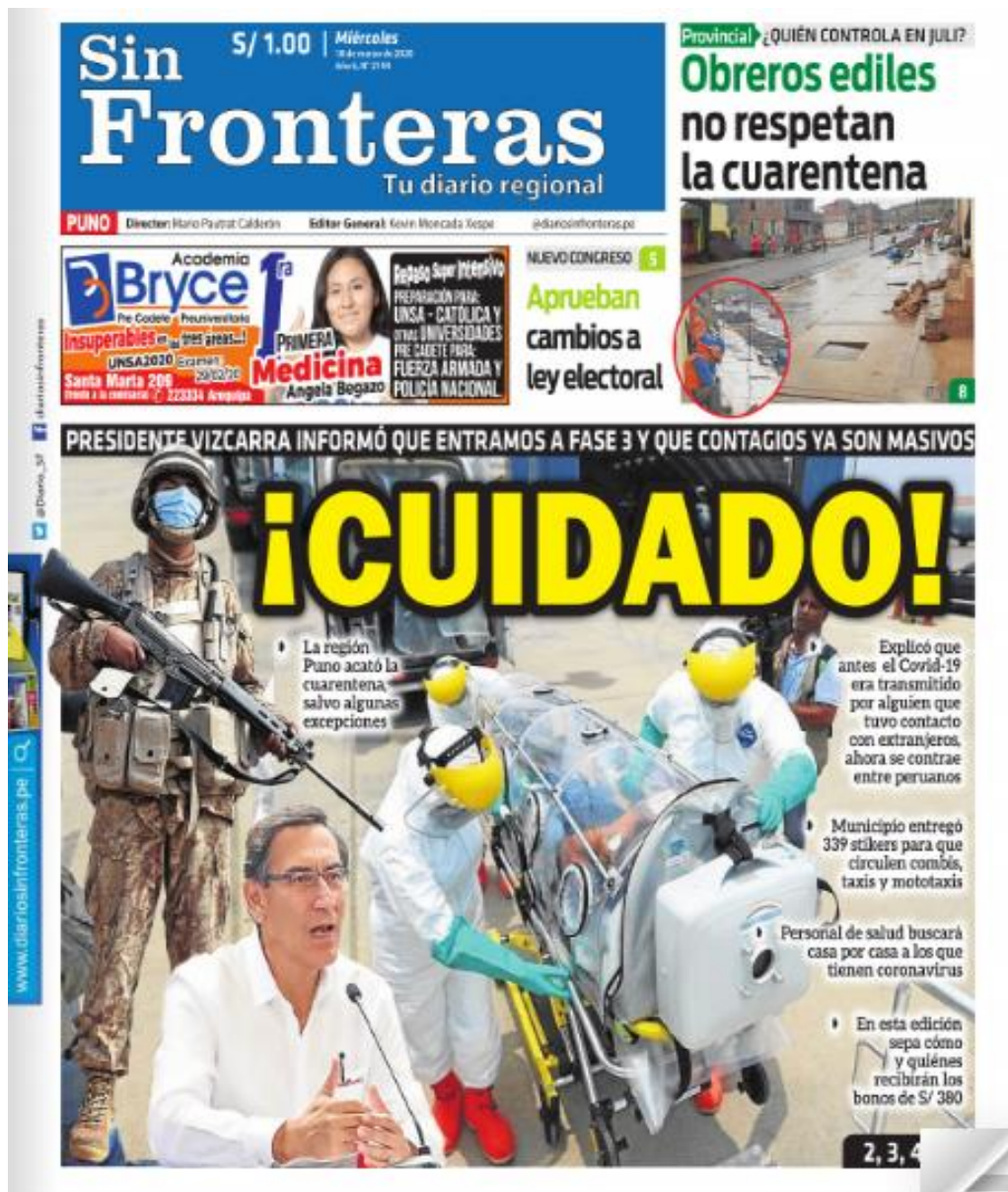
Fuente: Portada diario Sin Fronteras, 18 de marzo 2020.