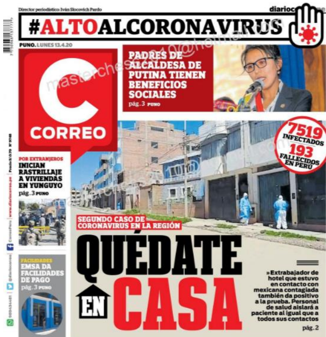
Ilustración 3 - Quédate en casa