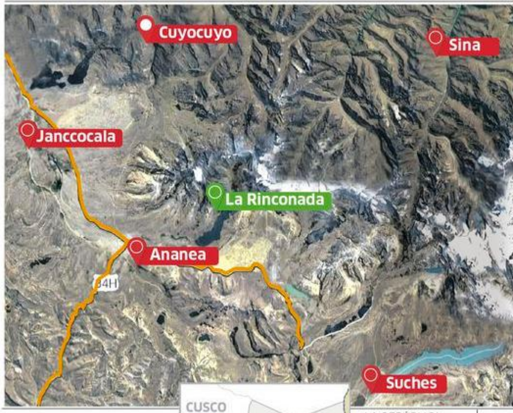
Figura 2: Poblaciones aledañas al Centro Poblado La Rinconada