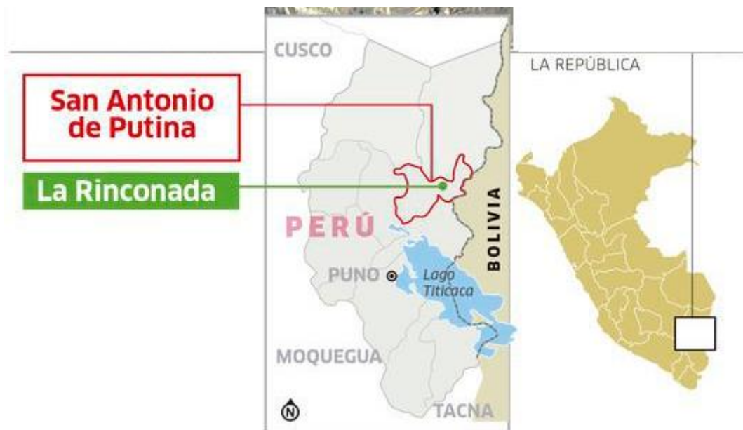
Figura 3: Centro Poblado la Rinconada y ubicación en la región Puno