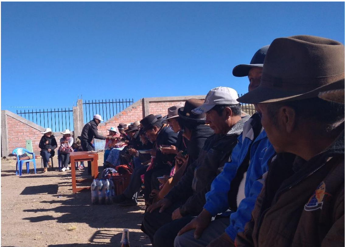
Figura 6. Reunión de autoridades y comuneros