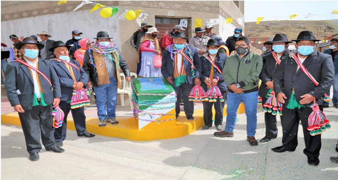
Figura 5. Autoridades del distrito de Kelluyo