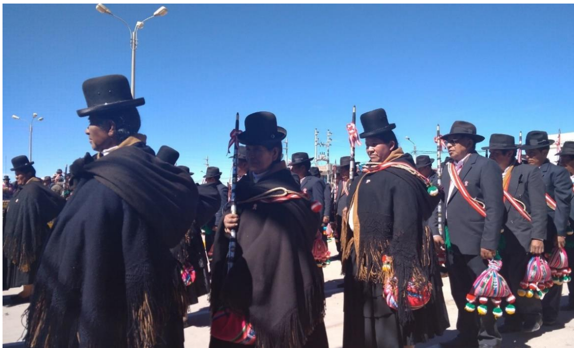
Figura 4. Fotografía de vestimenta del teniente gobernador y la tenienta.

Zurriago y/o chicote. – Soga trenzada de cuero de la parte cuello de la llama, acompañado con una cinta tejida de los colores de la bandera del Perú, con sus respectivas decoraciones. Que simboliza el poder y la autoridad de castigos en caso de faltas cometidas en su periodo y en la resolución de conflictos, lo cual el teniente lleva en la espalda siempre.