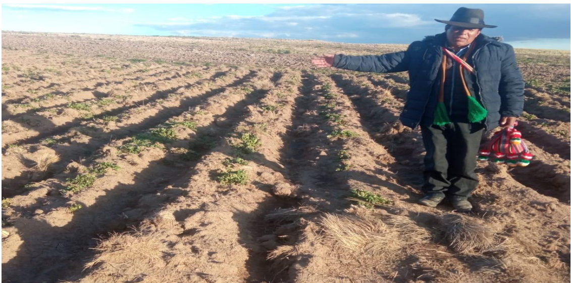
Figura 4. Teniente gobernador constatando los daños causados por la helada en los sembríos

Fuente: Registro fotográfico durante el trabajo de investigación, marzo 2020.