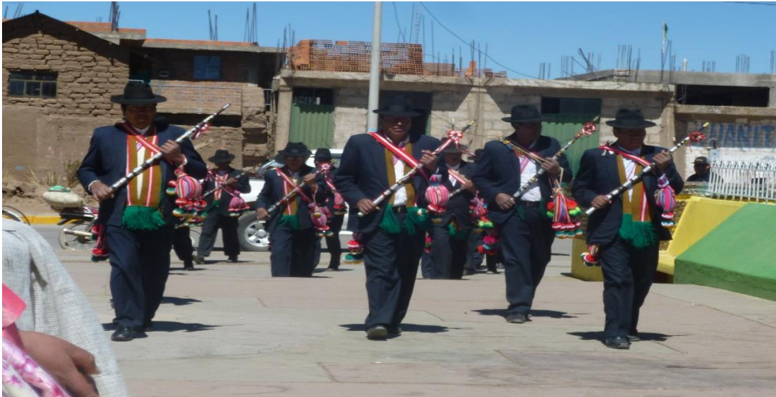
Figura 3. Junta directiva de los tenientes gobernadores