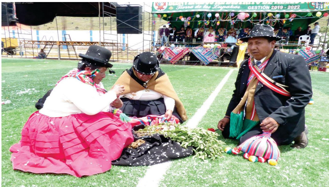
Figura 5. Fotografía de ch'uwa a los productos nuevos realizado por los tenientes y tenientas.

“Como teniente gobernador es mi responsabilidad llevar a concursar a mis comuneros para eso tengo que hacer ensayar, las ch'allas, conseguir bandas de músico, etc. El día del concurso atender con la comida, eso es costumbre de nosotros [...]” (Relato oral del Sr. H. Mamani; 12-02-2020).