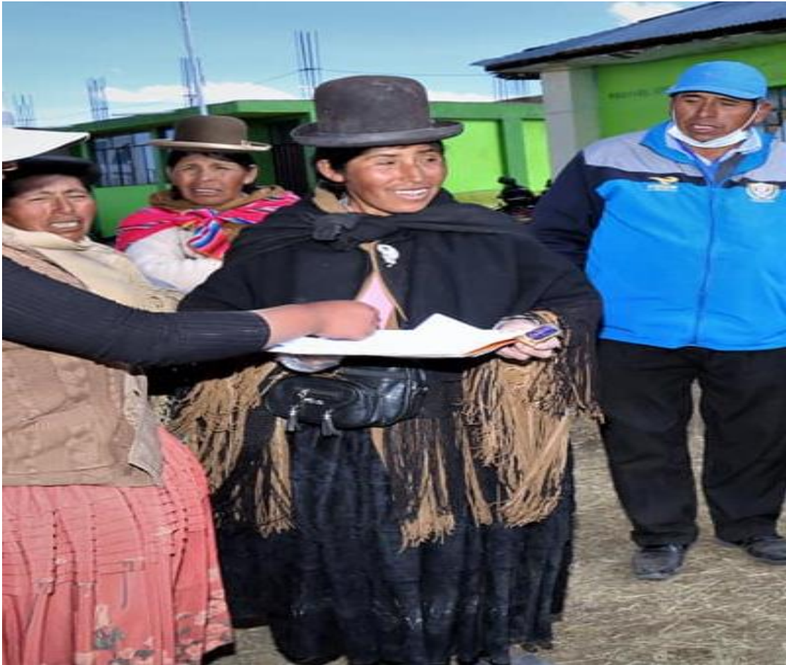
Figura 3. Fotografía de vestimenta de la teniente gobernadora.