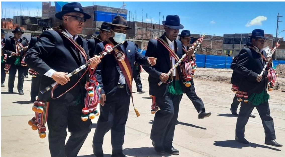
Figura 2. Fotografía de vestimenta del teniente gobernador