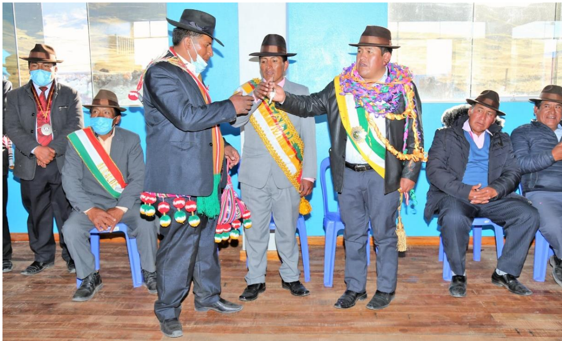
Figura 7. Fotografía de autoridades distritales y tenientes gobernadores por un bien común.

Autoridades que constituyen al distrito del cual son representantes que velan por el bienestar de su centro poblado que está conformado por comunidades y parcialidades. De igual manera son elegidos por liderazgo y experiencia. Dicho cargo es rotativo por parcialidades y comunidades, los mismos tenientes están bajo su liderazgo.