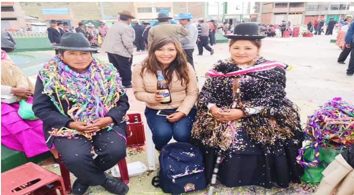
Figura 2. La ch'alla respectiva a la teniente gobernadora después de la Juramentación