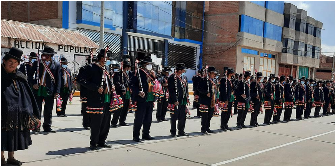
Figura 1. Indumentaria de los tenientes gobernadores