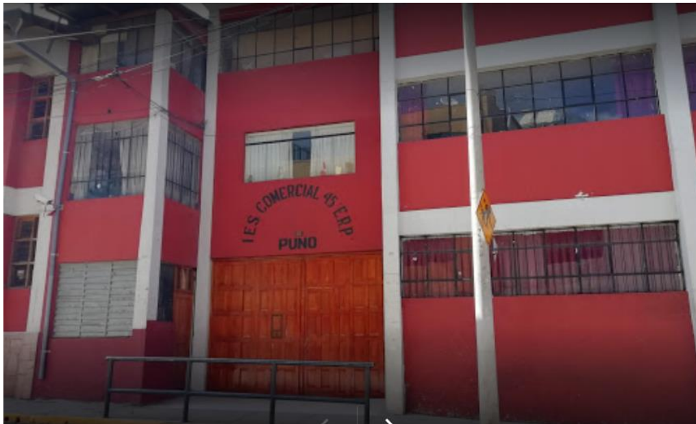
Figura 2. Institución Educativa Secundaria Comercial 45