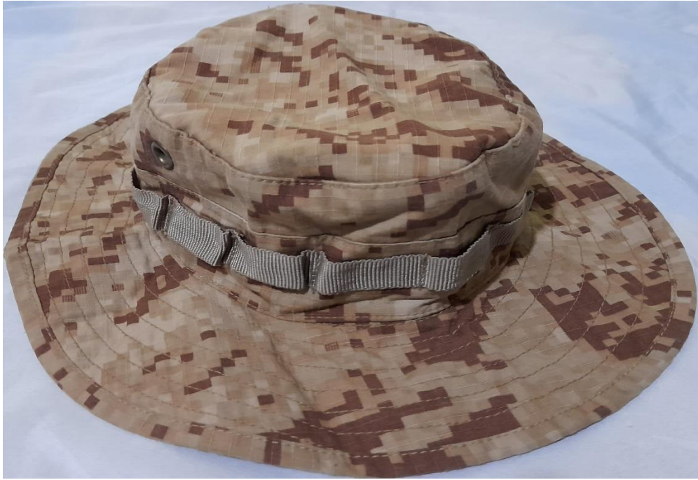
Sombrero digitalizado, prenda de vestir del personal de tropa del cuartel Manco Cápac, (2020).