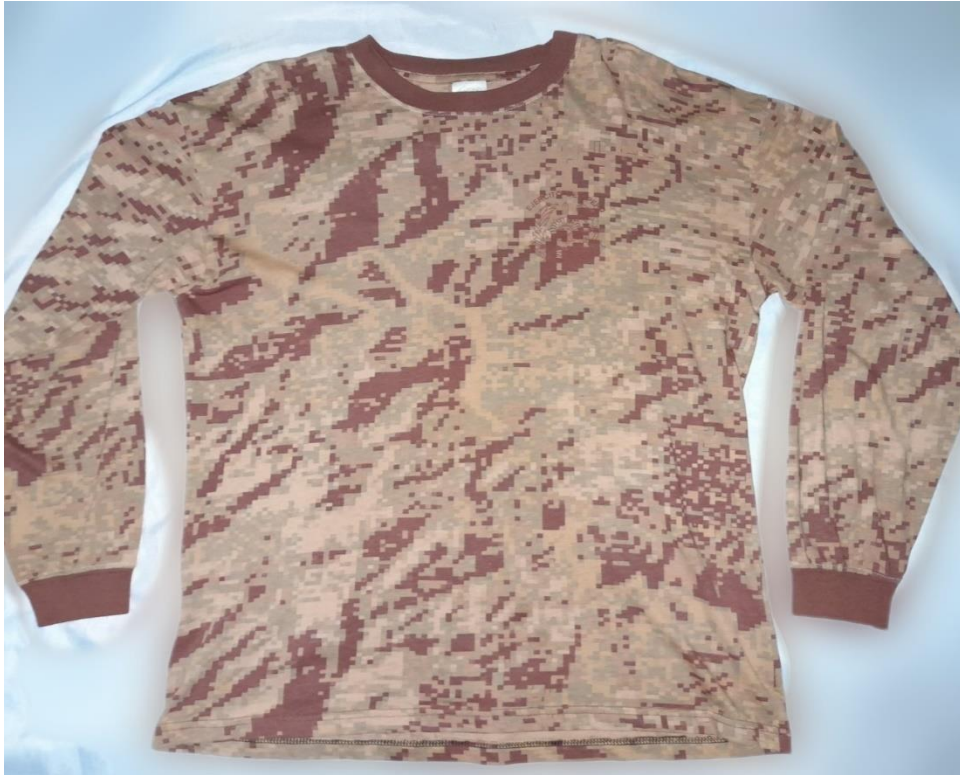
Polo digitalizado, prenda de vestir del personal de tropa, (2020).