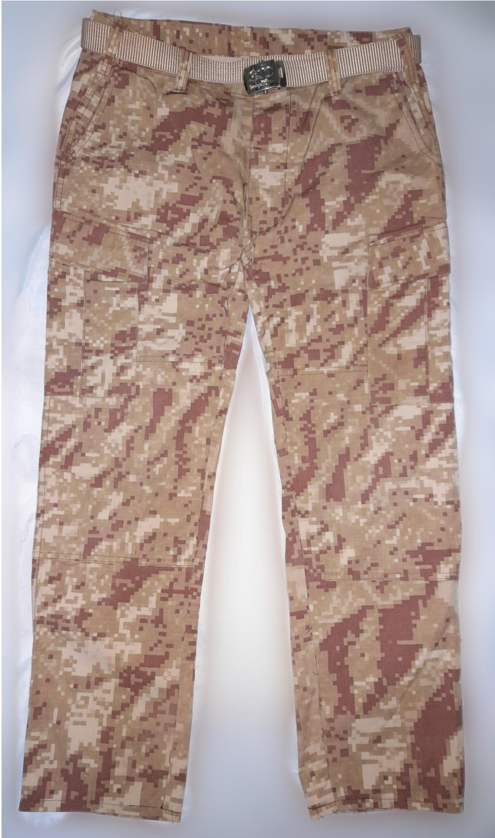
Pantalón digitalizado, prenda de vestir del personal de tropa, (2020).