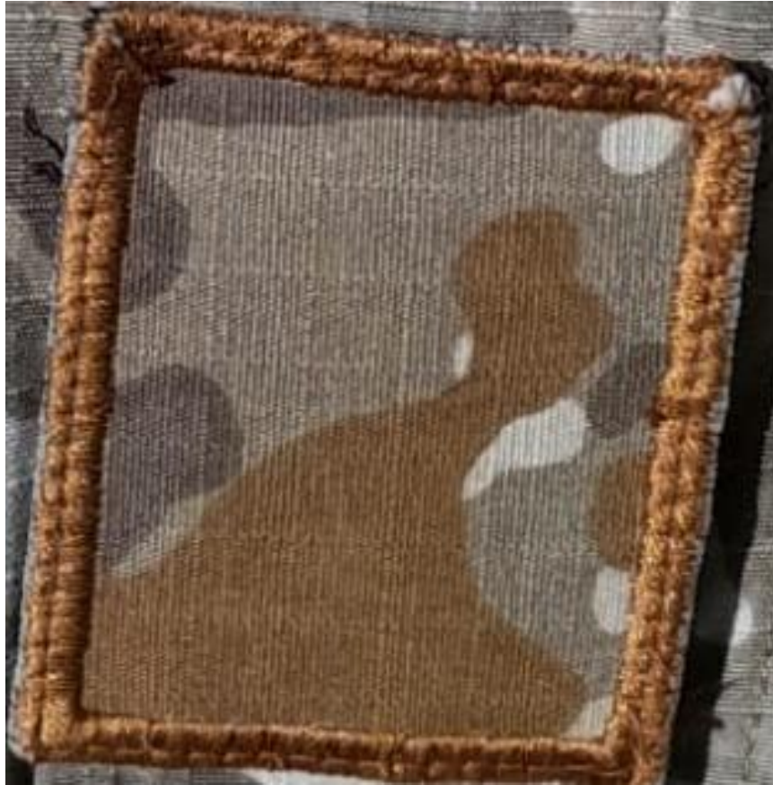
Figura 4 Distintivo de Grado de Soldado, conocido como parche. Pertenece al primer grado del personal de tropa del cuartel. Ambos géneros, varón y mujer hacen uso del grado vestido en el uniforme, (2021).

Cumplido los tres meses de la etapa básica, es reconocido como soldado, el cual es el primer grado que uno alcanza en su estadía en el cuartel, el tiempo de servicio con este grado es de seis a ocho meses, por lo general es seis, depende de uno mismo, demostrar con esfuerzo para que pueda ascender al siguiente grado.