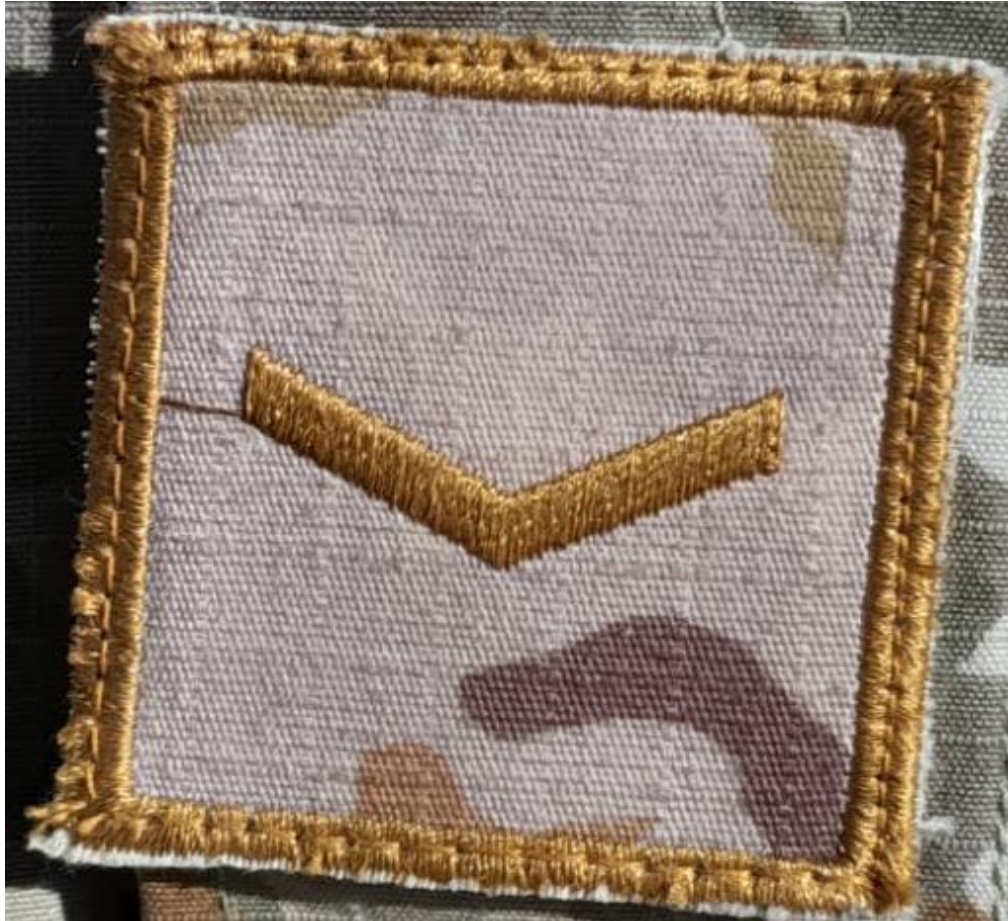
Figura 5 Distintivo de Grado de Cabo, corresponde al segundo grado que obtiene el personal de tropa del cuartel, (2021).

El Comandante de Sub Unidad es el encargado en la designación de los aspirantes a cabo, según las normas establecidas, previa verificación y en conformidad de la Tercera Sección de Estado Mayor de las Unidades del Ejército (G-3), asimismo se toma en cuenta las aptitudes físicas, morales e intelectuales, conducta y carácter. La instrucción es impartida conforme a las preinscripciones pertinentes y directivas del Comandante de Unidad (DIEDOC, 2014).