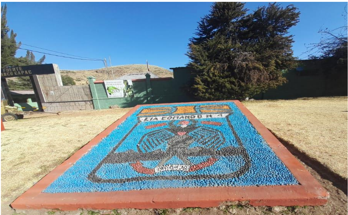
CIA Comando N° 4, insignia de la compañía, pertenecen femeninas y varones. Ubicación frontis del cuartel Fuerte Manco Cápac, (2021).