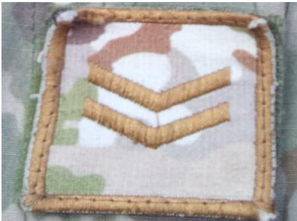
Figura 6 Distintivo de Grado de Sargento Segundo, pertenece al tercer grado de la tropa militar, (2021).

Para sargento segundo tiene que pasar prácticamente un año, como le digo seis meses, seis meses más otros seis meses son un año, eso ya depende como le digo, si asciendes, ósea, una vez que eres soldado para arriba si quieres llegar al máximo grado que es sargento primero uno tiene que esforzarse bastante, lo que es físico y conocimiento lo mismo, uno cuando ingresa. Cosa que un poquito más fuerte son los ejercicios, porque como ya estas acostumbrado al ejercicio es un poco más largo (soldado 1)