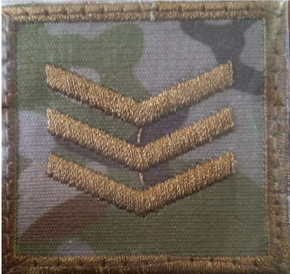
Figura 7 Distintivo de grado de Sargento Primero. Corresponde al último y máximo grado que el personal de tropa militar puede alcanzar, (2021).

La evaluación consta de examen físico, aptitud, actitud y comportamiento. El examen físico es similar al examen que se da al postular al cuartel, la única variación es que aumenta el número de ejercicios, el nivel de potencialidad. Después de pasar ello quien obtiene la calificación más alta, sumado las perspectivas de los superiores es quien asciende de grado.