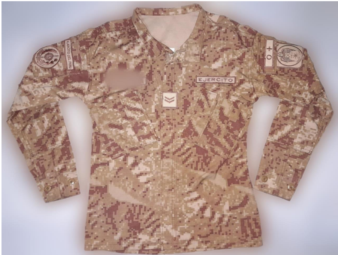
Prenda de vestir conocida en términos militares polaca o también conocido como camisa, (2020).