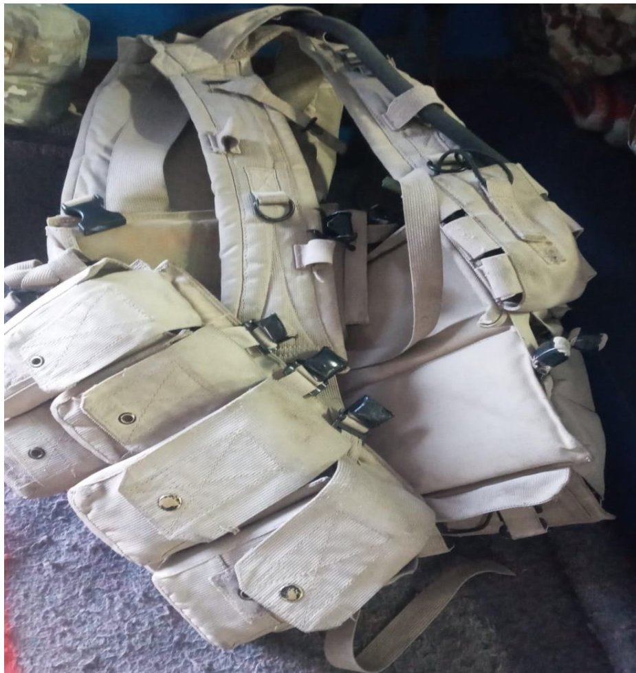
Figura 3 Equipo denominado RH, utilizado por el personal militar en instrucción, se utiliza para llevar municiones (2021).

Si, en si entras como recluta, sin parche sin nada. el día que entregas armamento ese día recién puedes ponerte, ósea tienes que sudar, eso dura tres meses, tu etapa básica, te enseñan media vuelta derecha a la izquierda, descanso atención, posiciones, para desfilas, partes del armamento, todo (Q-S3).