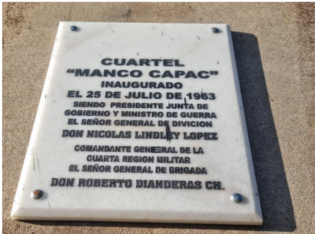
Figura 1 Creación del cuartel Manco Cápac, recordatorio ubicado en las instalaciones del cuartel, en honor a la gestión del presidente del Perú Nicolas Lindley López, (2021).

En el Perú las mujeres se encontraban afiliadas a las Fuerzas Armadas desde 1996 transversalmente del Servicio Activo No Acuartelado Femenino, con el consentimiento de la Ley N° 26628 (1996), pues se admite la aproximación a las instituciones de adiestramiento en oficiales y suboficiales de las Fuerzas Armadas. La incorporación femenina en la región de Puno fue en el año 2002, siendo la primera promoción del Servicio Activo No Acuartelado Femenino (SANAF), un número de 27 señoritas quienes prestaron su servicio en el cuartel, incorporándose el 01 de enero de 2002, y dado de baja por tiempo cumplido en el Servicio Militar el 31 de enero de 2002. El servicio que prestaban las femeninas fue no acuartelado, ingresaban 05:00 de la mañana, y el día finalizaba 05:00 de la tarde, sucesivamente la rutina se dio de lunes a viernes. En ese entonces, no había sección o compañía de mujeres, se dedicaron a las labores administrativas (Cuarta Brigada de Montaña, 2021).