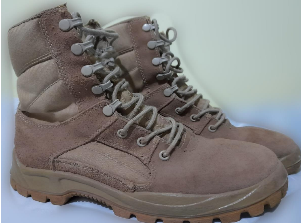
Borceguis color beige, también suelen llamarlo botas militares, es una de los calzados que viste el personal de tropa, (2020).