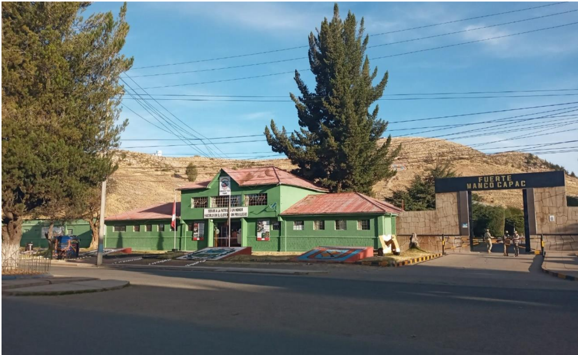
Instalaciones del cuartel Fuerte Manco Cápac de la ciudad de Puno, vista panorámica de la parte exterior, (2021).