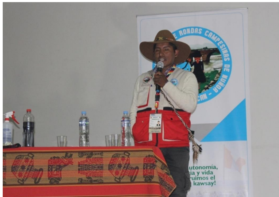
Figura 9. Discurso por el XXIII aniversario por parte del presidente de la CEDROCAN.

Durante el tiempo que yo estoy en las rondas campesinas siempre observe que participan los ronderos y ronderas en todos los casos como robos, abigeato, deudas, colindas, casas, bienes, infidelidades, herencias, entre otros, pero se podría decir que también la mujer interviene más en los problemas de mujeres, a veces como no hay esa confianza con los varones, por eso casi no intervenimos en esos aspectos. Pero igual siempre estamos trabajando en conjunto con todos (José, 28 años).