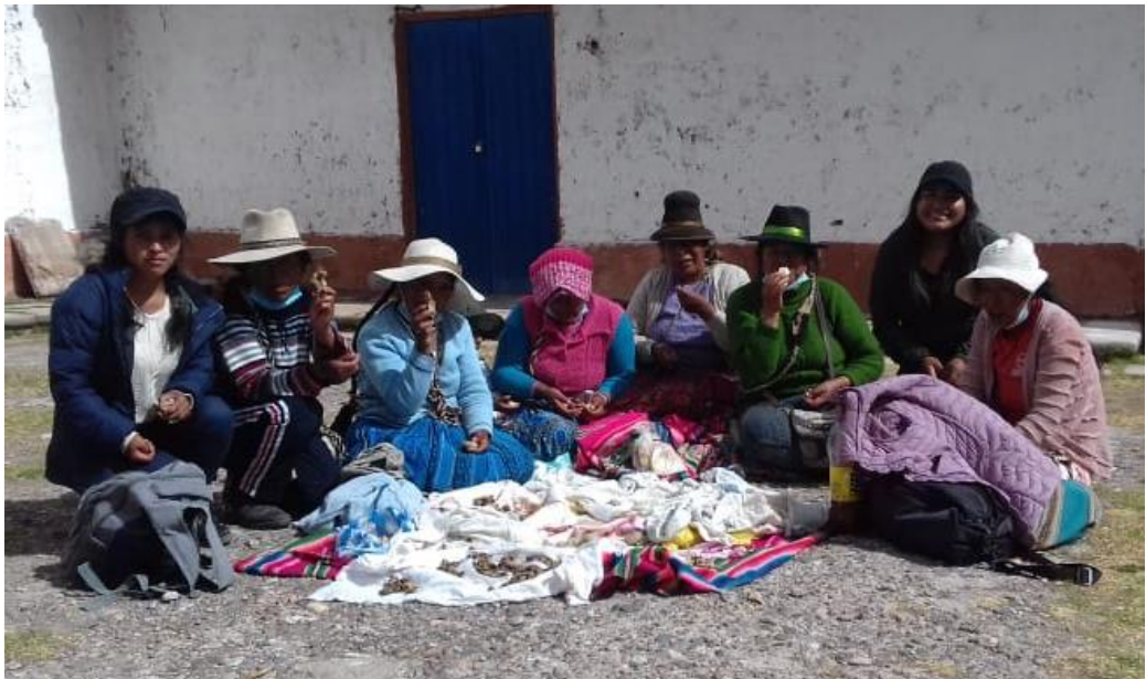
Figura 3. Compartir con las mujeres ronderas de la base de Pasanacollo 15/09/2021.

planchas así castigamos ahora, antes si era muy fuerte los castigos, los saben bañar con agua helada, con ortiga los azotaban (María, 60 años).