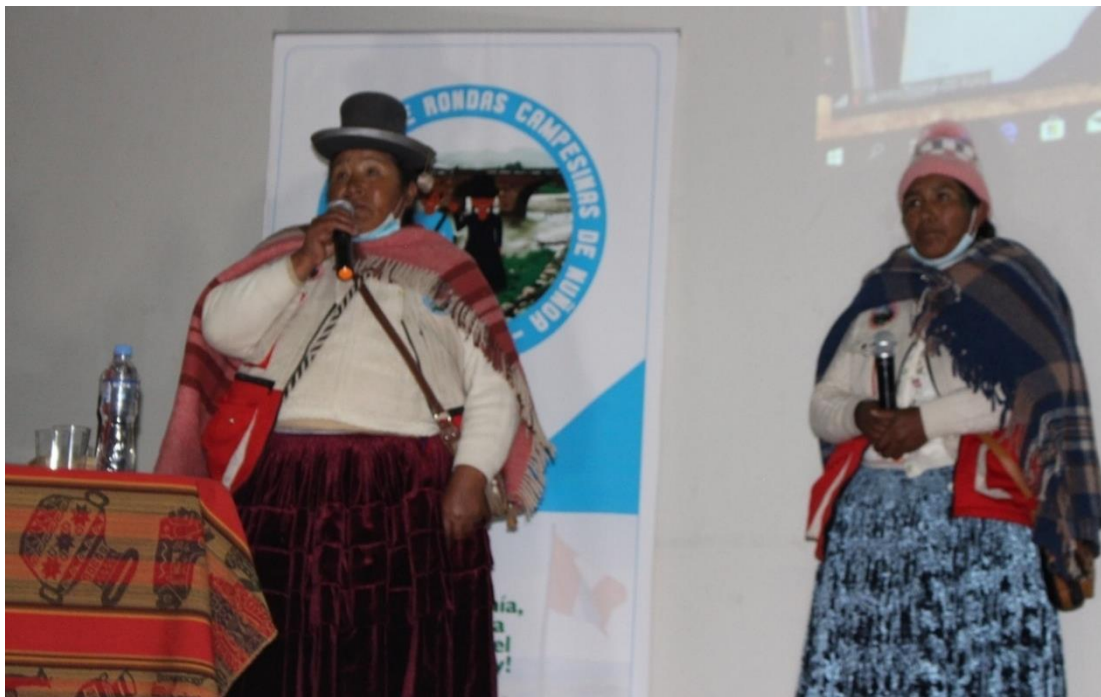
Figura 4. Participación de la vicepresidenta y la secretaria de asuntos femeninos, por el XXIII aniversario de la CEDROCAN, 12/10/2021.

El sistema organizacional de las rondas campesinas está conformado por la CUNARC a nivel nacional quienes se encarga del beneficio sobre el desarrollo de las rondas campesinas a nivel nacional, regional y distrital. Además de buscar la paz y el bienestar de los pueblos indígenas u originarios, administrar justicia de manera gratuita, confiable y rápida.