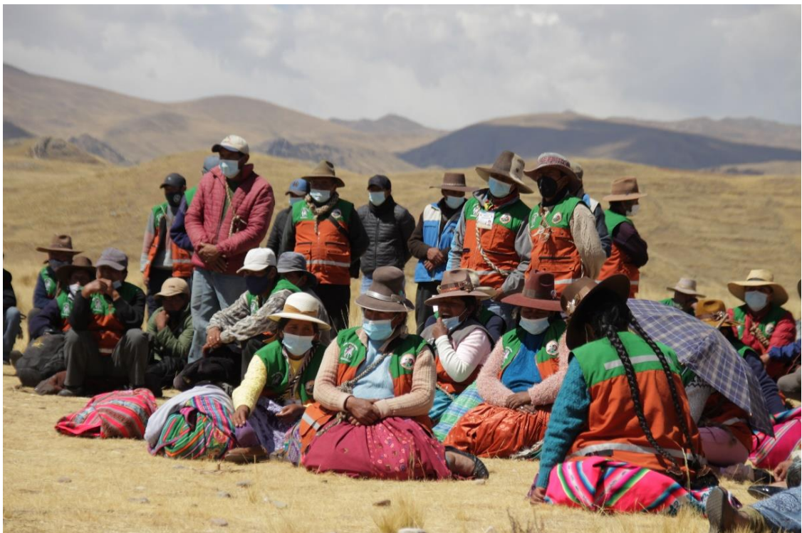
Figura 12. Mujeres rondas de la base de Pasanacollo con su respectiva indumentaria distintiva en el encuentro XLV distrital de CEDROCAN.