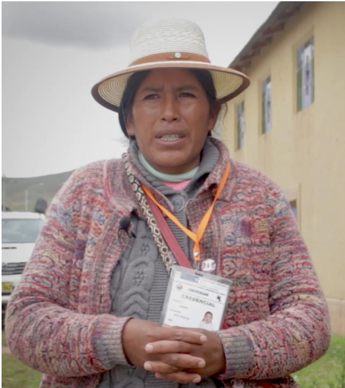
Figura 19. Vicepresidenta de la CEDROCAN expresó la importancia de la participación de la mujer en la administración de justicia consuetudinaria u originaria.