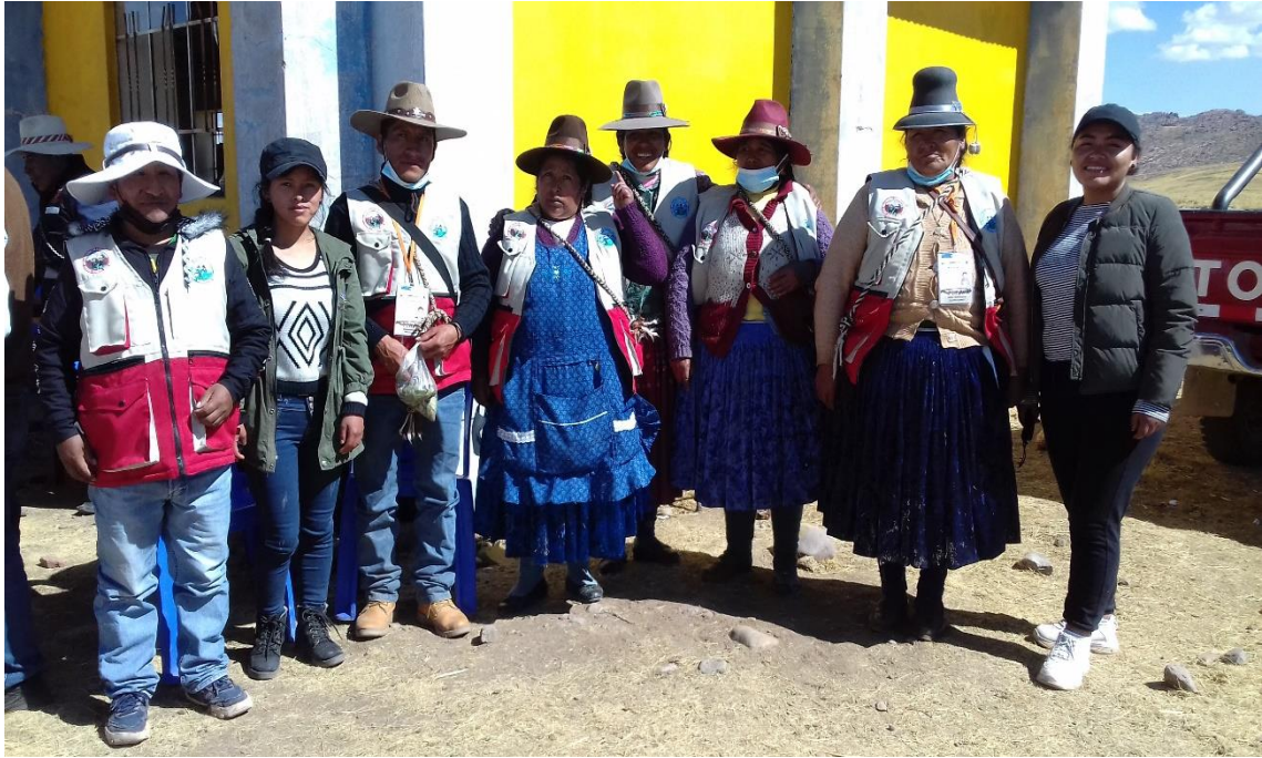
Figura 13. Ronderos de la junta directiva de la CEDROCAN presentes en el XLV encuentro distrital de rondas campesinas de Nuñoa, 2021.