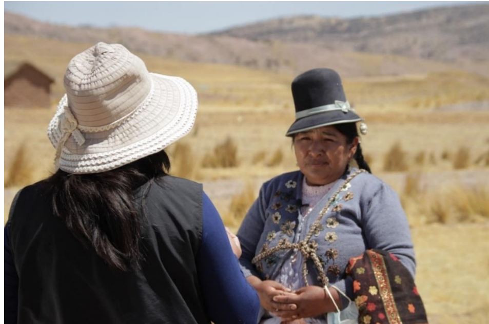
Figura 5. Mujer rondera cumpliendo el cargo de Secretaria de orden y disciplina con la respectiva indumentaria, en la base de Pedro Vilcapaza.