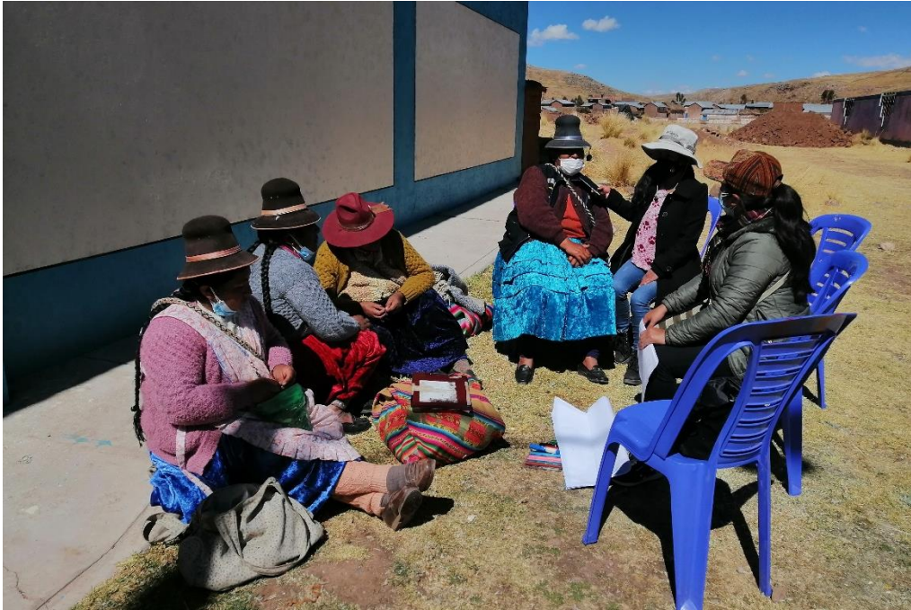
Figura 20. Entrevista a ronderas de la base de Alfonso Ugarte Ticuyo sobre la importancia de la participación de la mujer en la impartición de justicia.