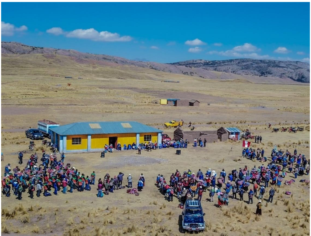
Figura 6. XLV encuentro distrital de rondas campesinas de Nuñoa, en Rumi Pampa, 04/09/2021

nos falta el respeto, dicen que nos van a hacer las mujeres. Las compañeras cuando asumían este cargo se quejaban porque les faltaban el respeto siempre hay machismo en todos lados nos ven a las mujeres como si no supiéramos nada, como si no vamos a aportar en nada y en los encuentros generales mayormente participan más ronderos y pocas ronderas por el motivo de que las mujeres no sabemos manejar moto, carro, porque son en lugares alejados (Nelly, 48 años).