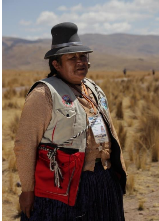
Figura 2. Secretaria de asuntos femeninos, en el XLV encuentro distrital de Rondas Campesinas de Nuñoa.

Es una mujer rondera que porta la indumentaria distintiva de la ronda campesina que consiste en: chaleco, huarak´a, credencial, sombrero, pollera, etc., quien fue partícipe del XLV encuentro distrital de ronderos el 04/09/2021 que se llevó en Rumi Pampa del distrito de Nuñoa.