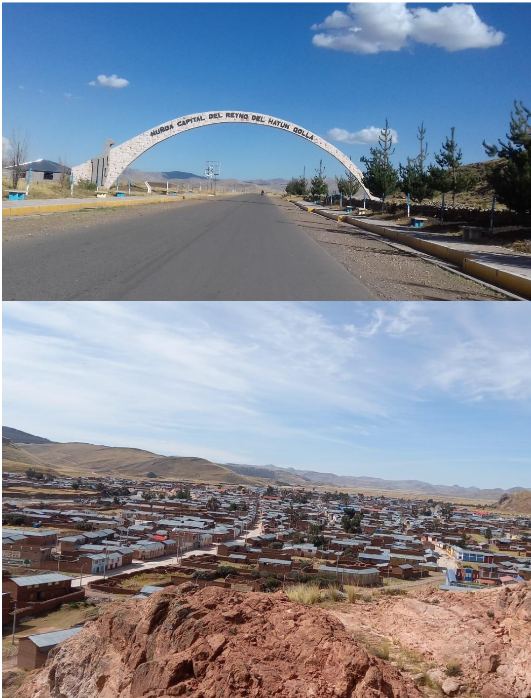
Figura 10. Distrito de Nuñoa: Capital del Reyno del Hatun Qolla.