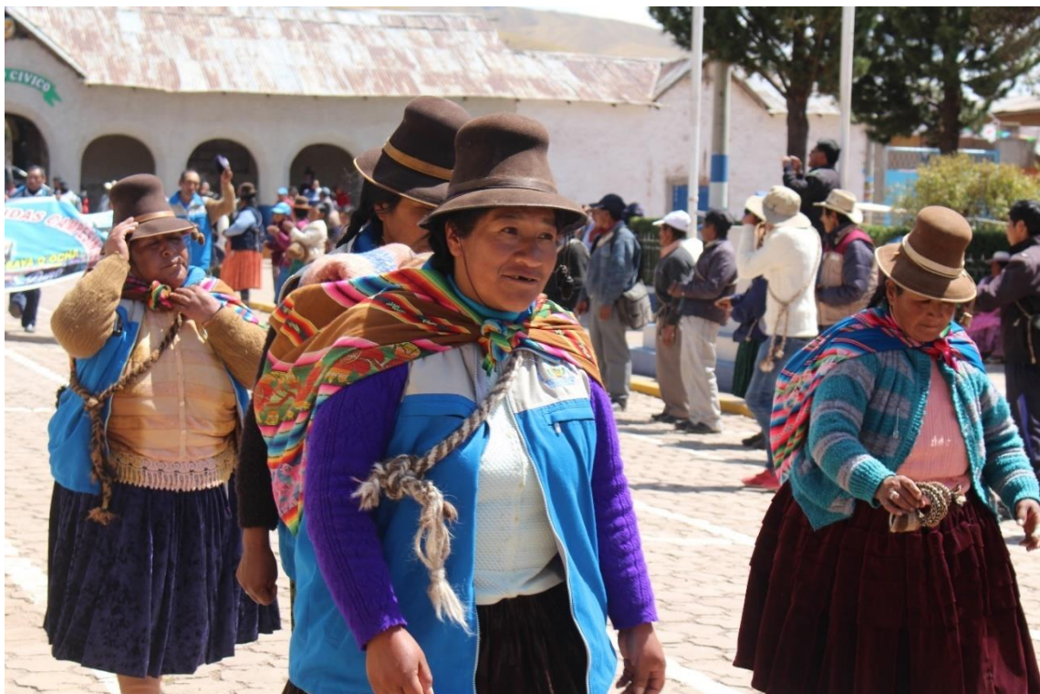
Figura 18. Mujeres ronderas participando por el XXIII aniversario de la CEDROCAN con su indumentaria representativa como: chaleco, huarak´a, pollera, sombrero, lliclla, etc.