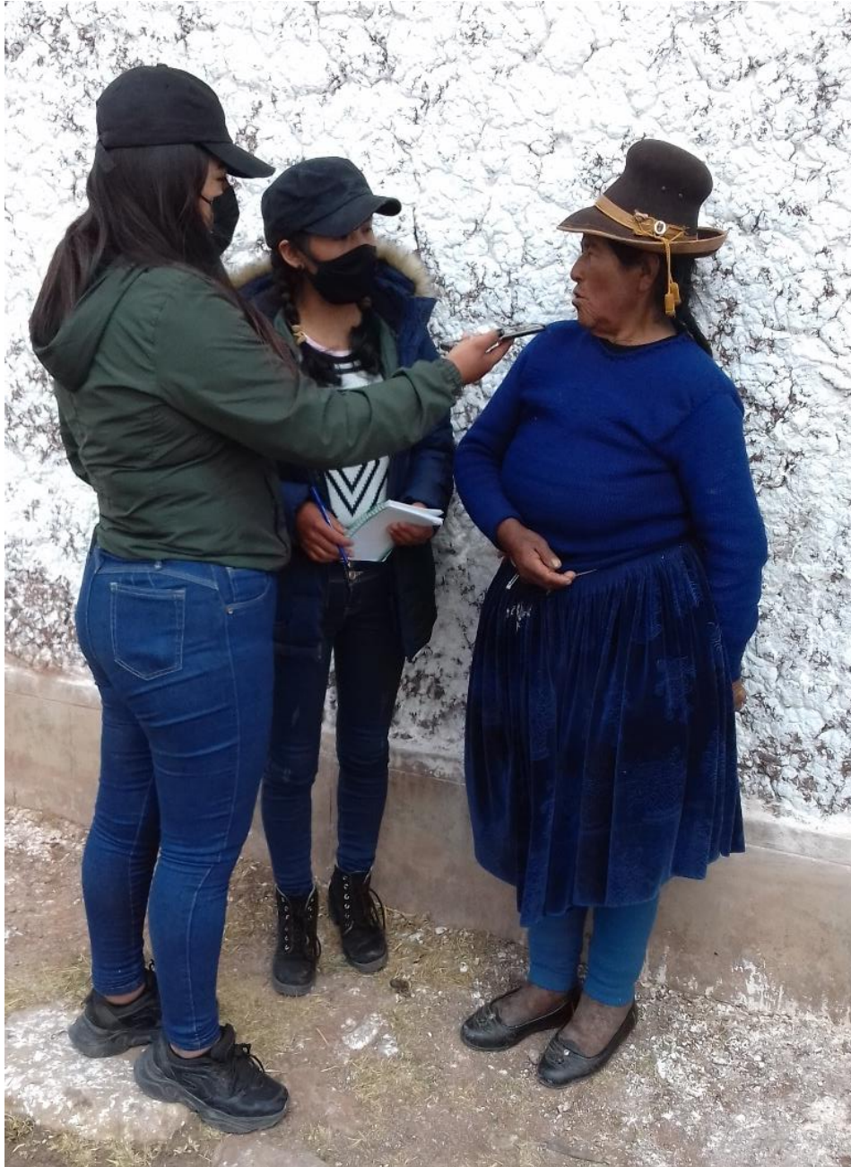
Figura 16. Entrevista a la rondera de la sub – base de Pucacunca, dio a conocer su experiencia en las rondas campesinas.