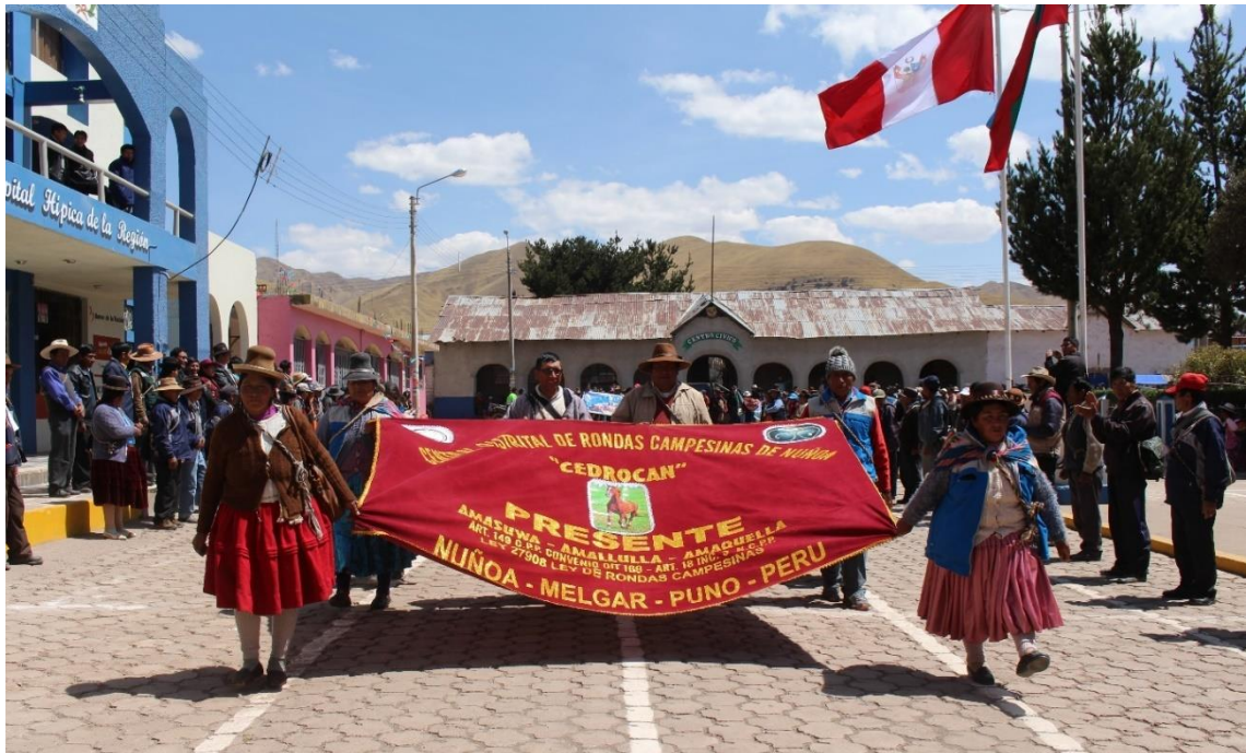
Figura 17. Desfile de ronderos de las 28 bases y 23 sub – bases de las rondas por el XXIII aniversario de la CEDROCAN, con sus respectivas indumentarias representativas.