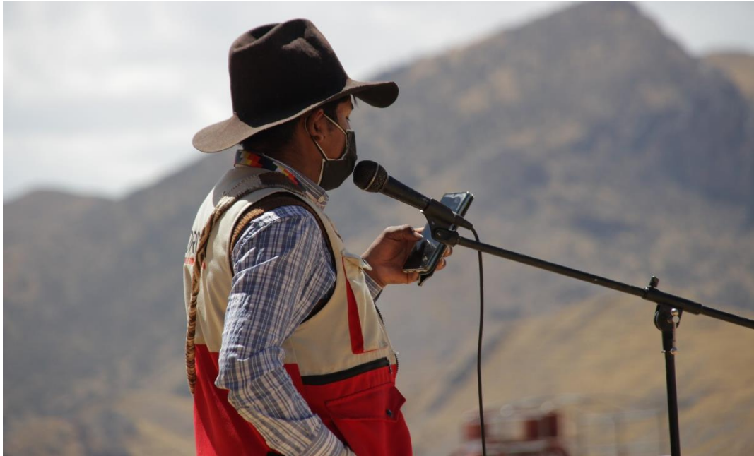
Figura 11. Presidente de la CEDROCAN en Rumi Pampa presentando la agenda sobre los proyectos ejecutados por la municipalidad de Nuñoa y otros puntos a tratar en el XLV encuentro distrital de rondas campesinas de Nuñoa, 2021.