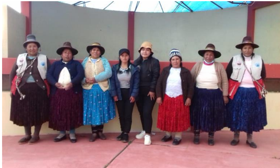
Figura 8. Reunión de mujeres ronderas para acuerdos sobre la impartición de justicia.

para las personas que no tienen economía y nos miran mal a nosotros, la justicia ordinaria en la actualidad es demasiado injusta, creen más en los mentirosos, asesinos, violadores, agresores y ellos se libran fácilmente cuando mienten y sobornan a esas autoridades que son corruptos, que no trabajan por el bienestar de la población (Nelly, 48 años).