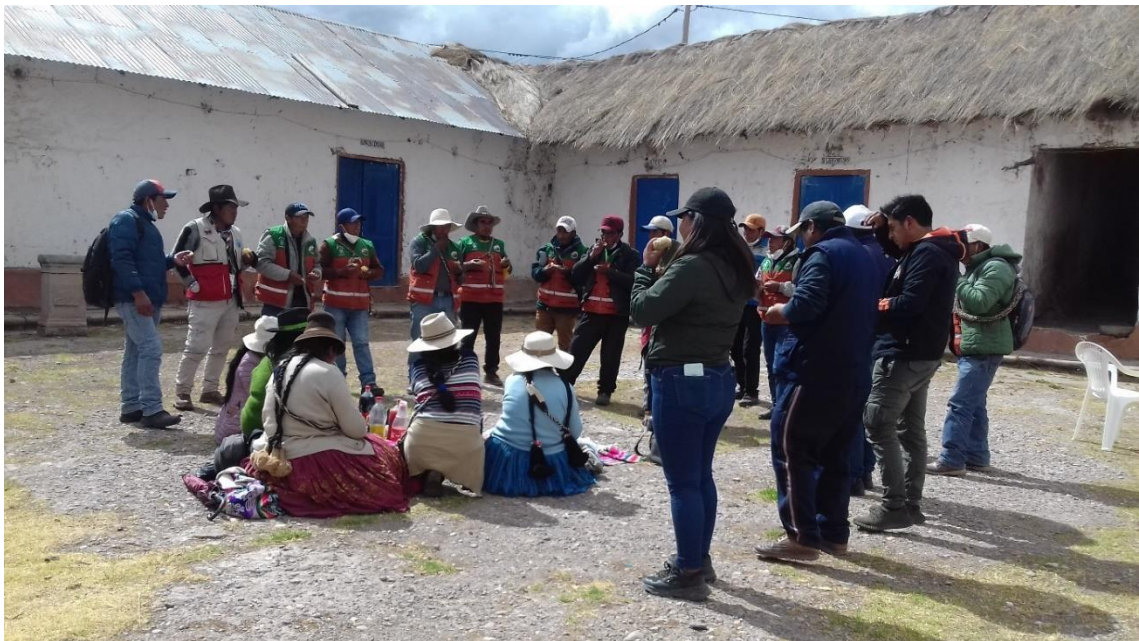
Figura 14. Ronderos en la hora del fiambre aprovechando en compartir noticias, tristezas y también alegrías en la base de Pasanacollo.