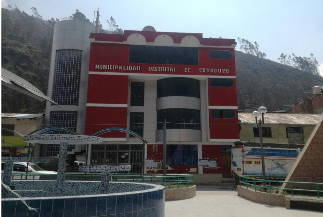
Foto de la municipalidad de Cuyocuyo

Nota. Fotografía de la municipalidad distrital de Cuyocuyo 2022.