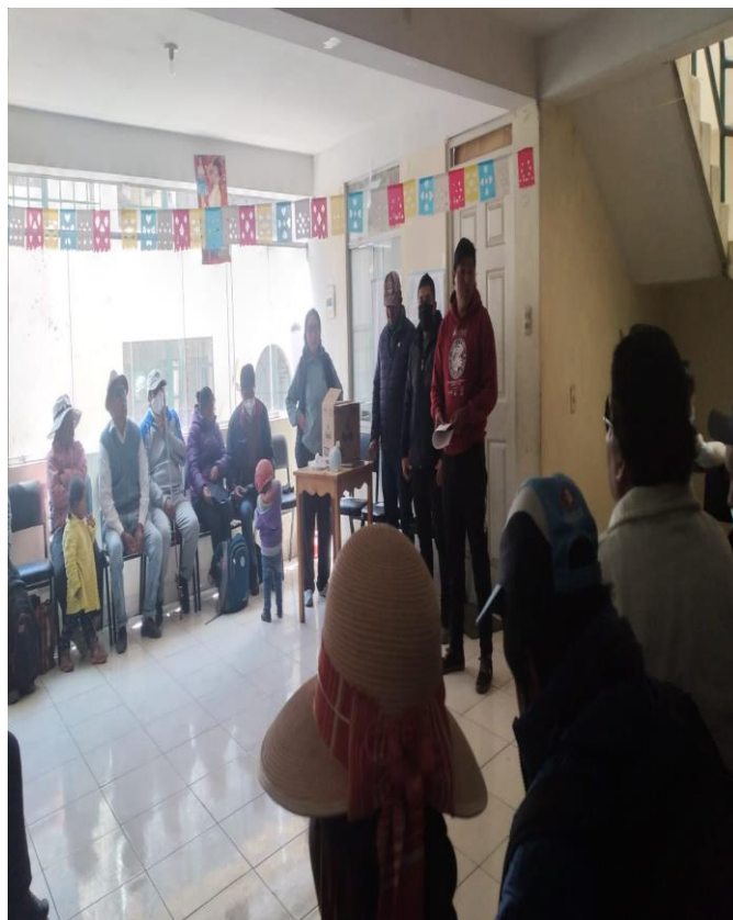
Figura 5. Reunión de la Asociación de ciegos Virgen de la Candelaria Puno.