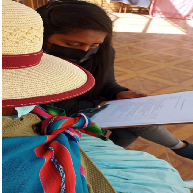
Figura 8. Madre de familia facilitando información de su hija con discapacidad.