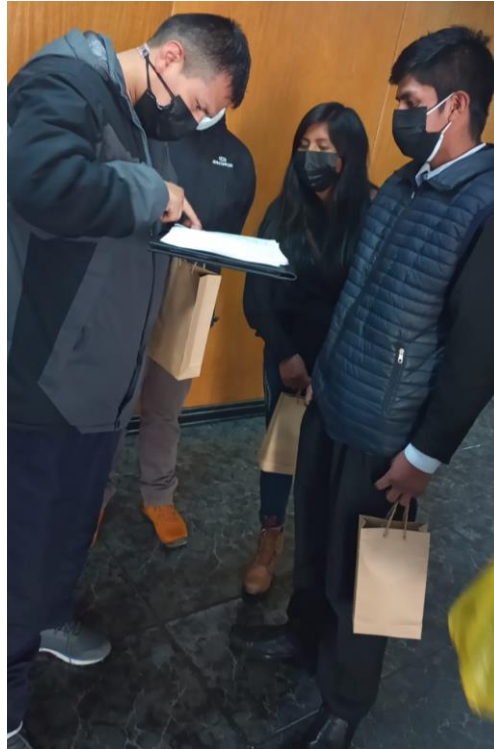
Figura 10. Persona en situación de discapacidad de origen auditivo y de habla, siendo encuestado por su propio compañero con la misma discapacidad, por la falta de preparación en el lenguaje de señas.