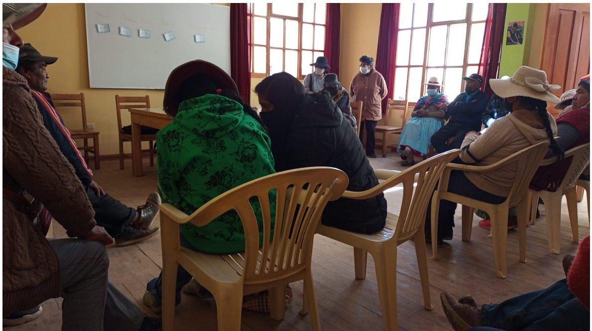
Figura 7. Recojo de información en la Asociación de Limitados Físicos Puno. ALFIP