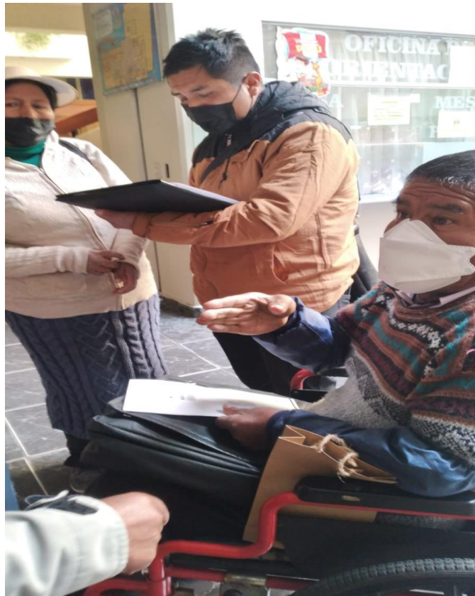
Figura 6. Obteniendo información con uno de los dirigentes de las personas con discapacidad.