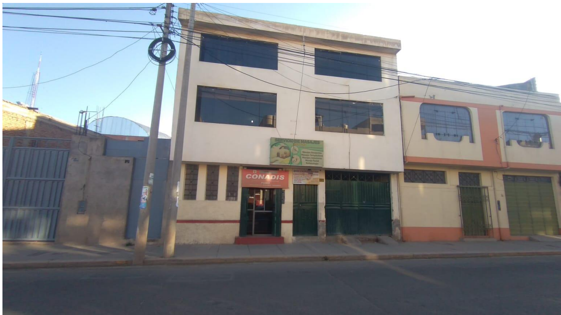
Figura 1. Consejo Nacional para la Integración de la Persona con discapacidad.

La investigación se desarrolló en la ciudad de Puno, específicamente en el CONADIS, ubicado en Av. Ejercito 432 barrio Santa Rosa.