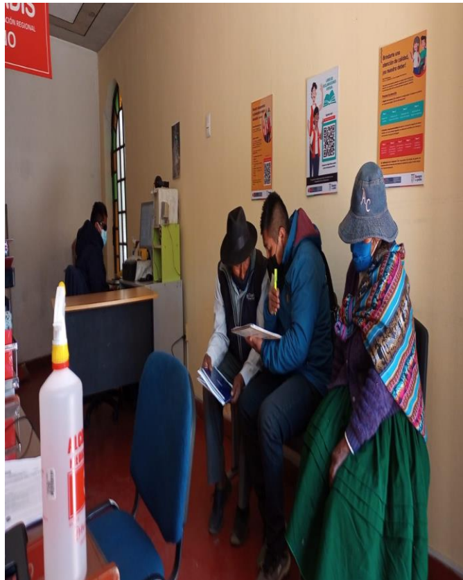
Figura 4. Personas con discapacidad brindando información.