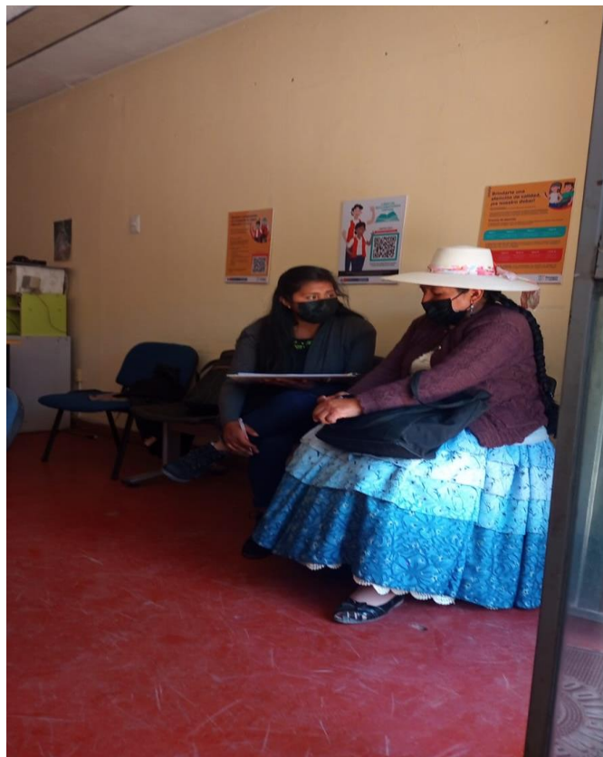
Figura 3. Recopilación de información de la persona con discapacidad.