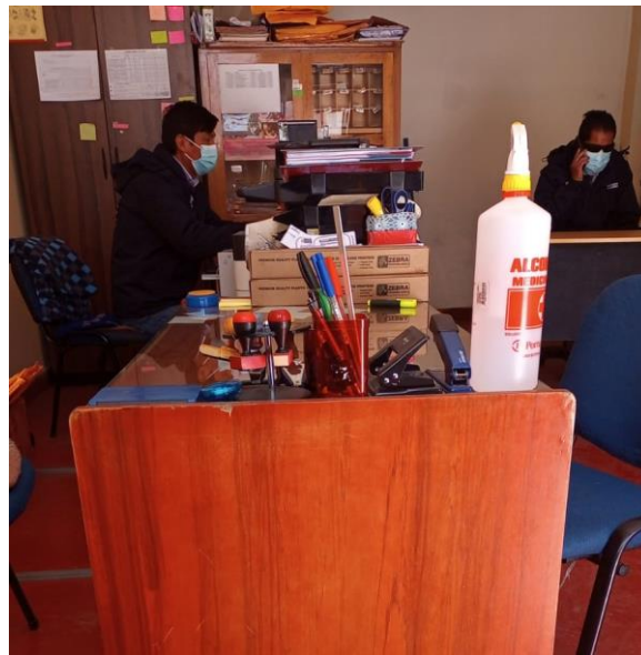
Figura 2. Personal del CONADIS Puno

distritales de toda la región Puno, el coordinador regional de Conadis está en permanente supervisión, constatación y asistencia para que los municipios implementen su Oficina Municipal de Atención a la Persona con Discapacidad (OMAPED), viendo que tengan profesionales capacitados e idóneos en temas de discapacidad, por otro lado dichas oficinas tengan la infraestructura adecuada y el equipamiento respectivo.