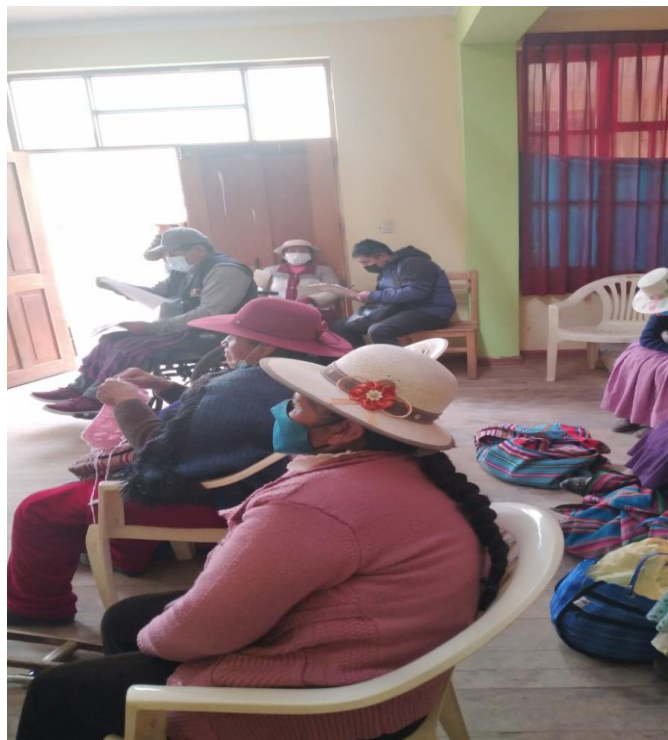
Figura 9. Realizando encuestas a personas con discapacidad.