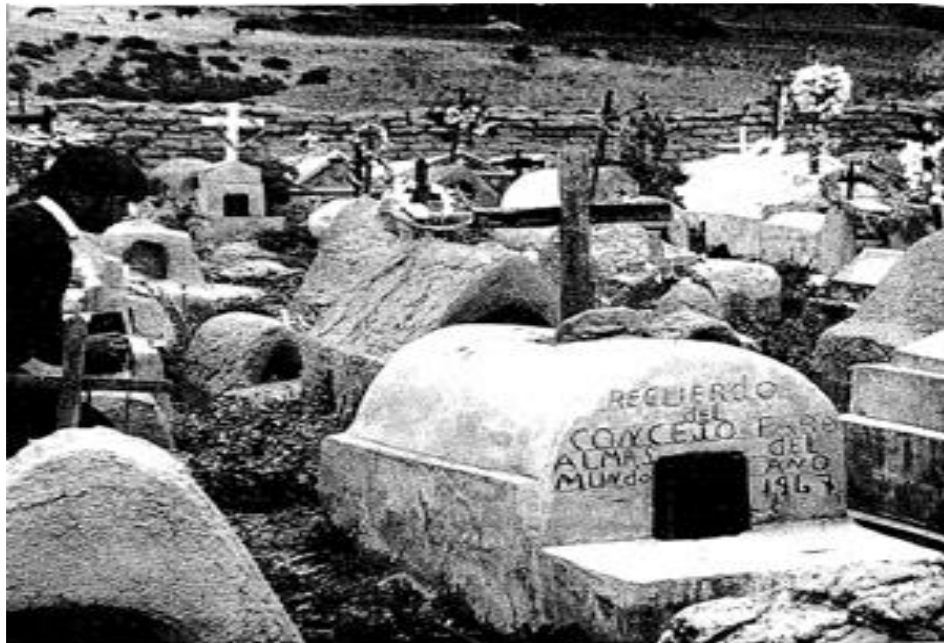
Figura 2. el cementerio de Pusi

una al lado de la otra en este típico cementerio campesino de las tierras altas. En la fachada de la cúpula, tallada en cemento con manos temblorosas, el visitante encontrará la inscripción: “Consejo Commemorativo de las Almas del Mundo”.