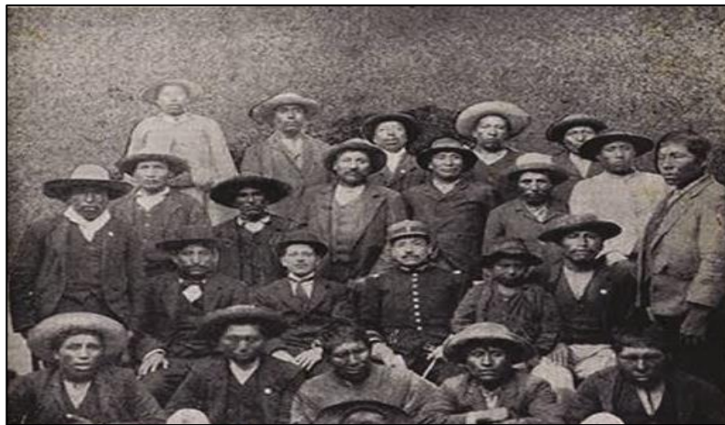
Figura 4. Rumi Maqui

hubiera un levantamiento nativo. Según la coartada, la rebelión y el personaje Rumi Maki fueron creados por la misma gama para justificar sus masacres. Según el historiador Augusto Ramos Zambrano, “la posición de Rumi Maki sería demasiado ingenua para aceptar acusaciones de traición a la patria y perjudicaría a decenas o incluso cientos de indígenas que se sumaron al levantamiento, algunos de ellos fueron encarcelados en varios Puno. celda ”.