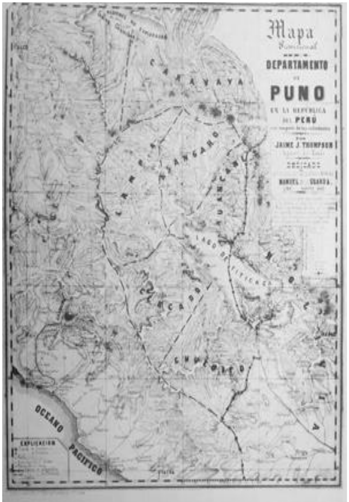
Departamento de Puno (1863)