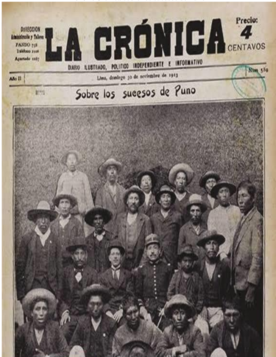
Crónica sobre los sucesos de Puno de Teodomiro Gutiérrez Cuevas