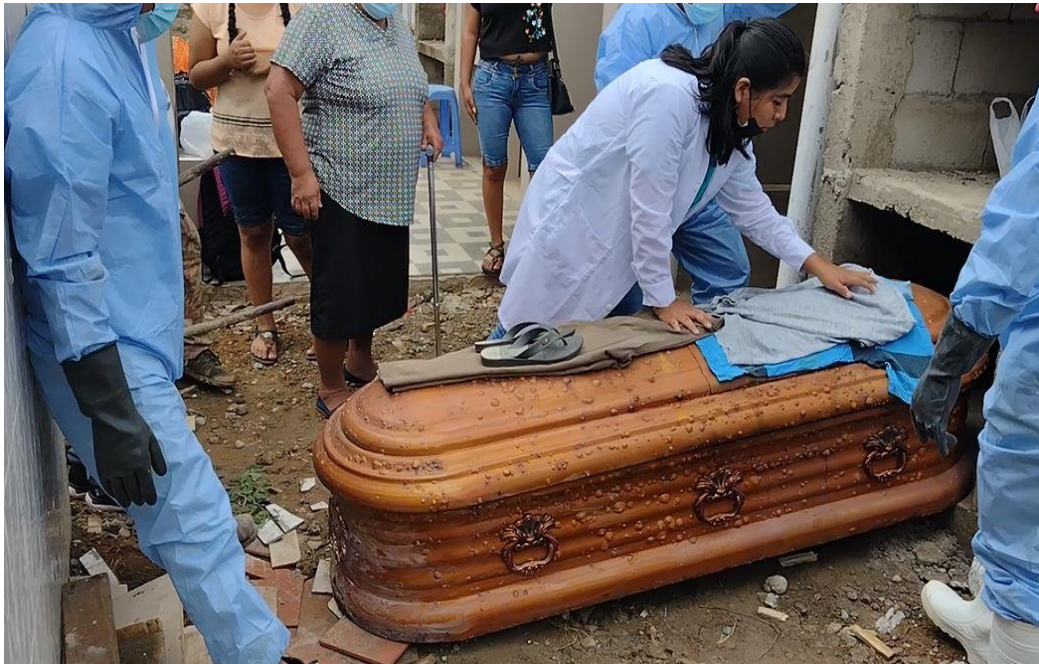
Figura 17 Familiares colocan prendas sobre el féretro de sabino

En la figura se aprecia un juego de ropas limpias encima del féretro se cree que al ser guardado en un nuevo lugar de descanso debe ir con un nuevo cambio de ropas que usaba en vida el difunto. Según el siguiente testimonio nos manifiesta lo siguiente: