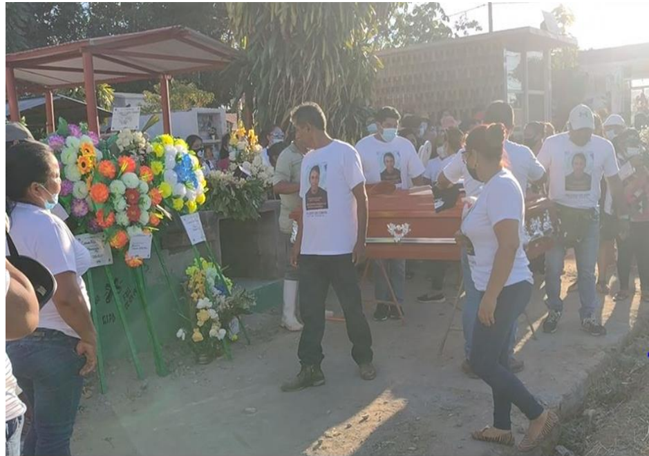
Figura 8 Familiares cercanos al difunto con polo distintivo

Al visualizar la figura se evidencia a los acompañantes visten pantalones negros o azules, un polo blanco estampado con el rostro del difunto, un mensaje, su nombre, el año en que nació y falleció.