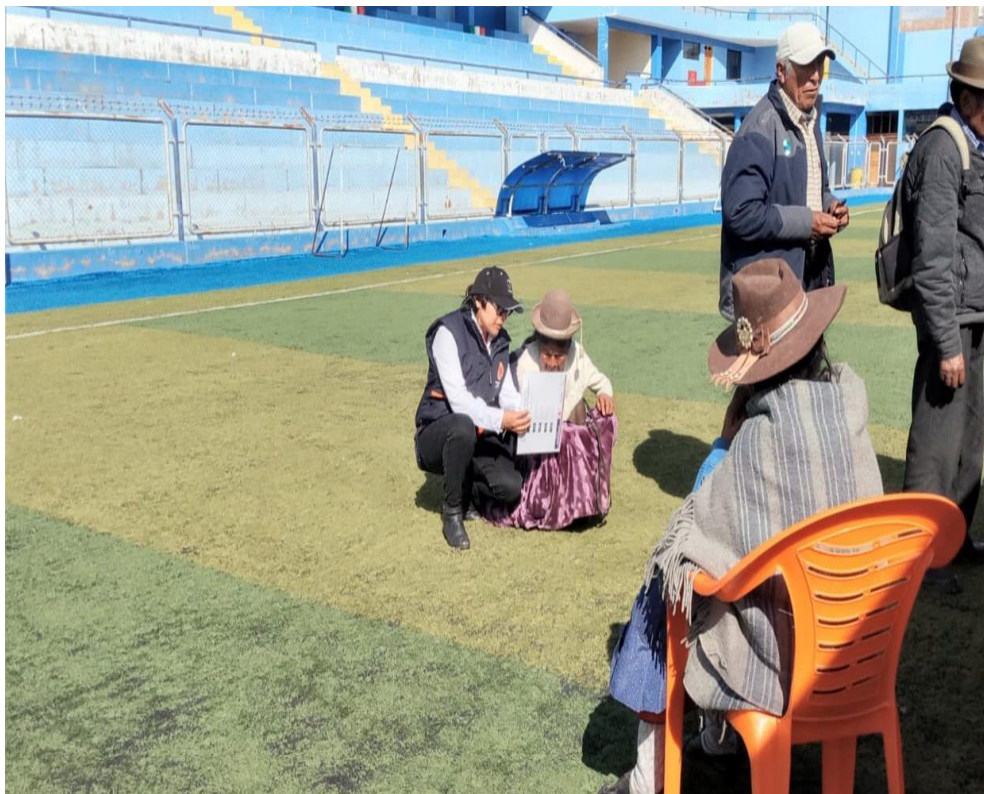
Foto 2. Encuesta en el distrito de Azángaro.