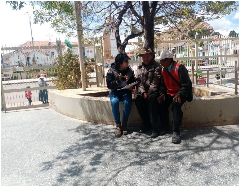
Foto 1. Encuesta en el distrito de Azángaro.