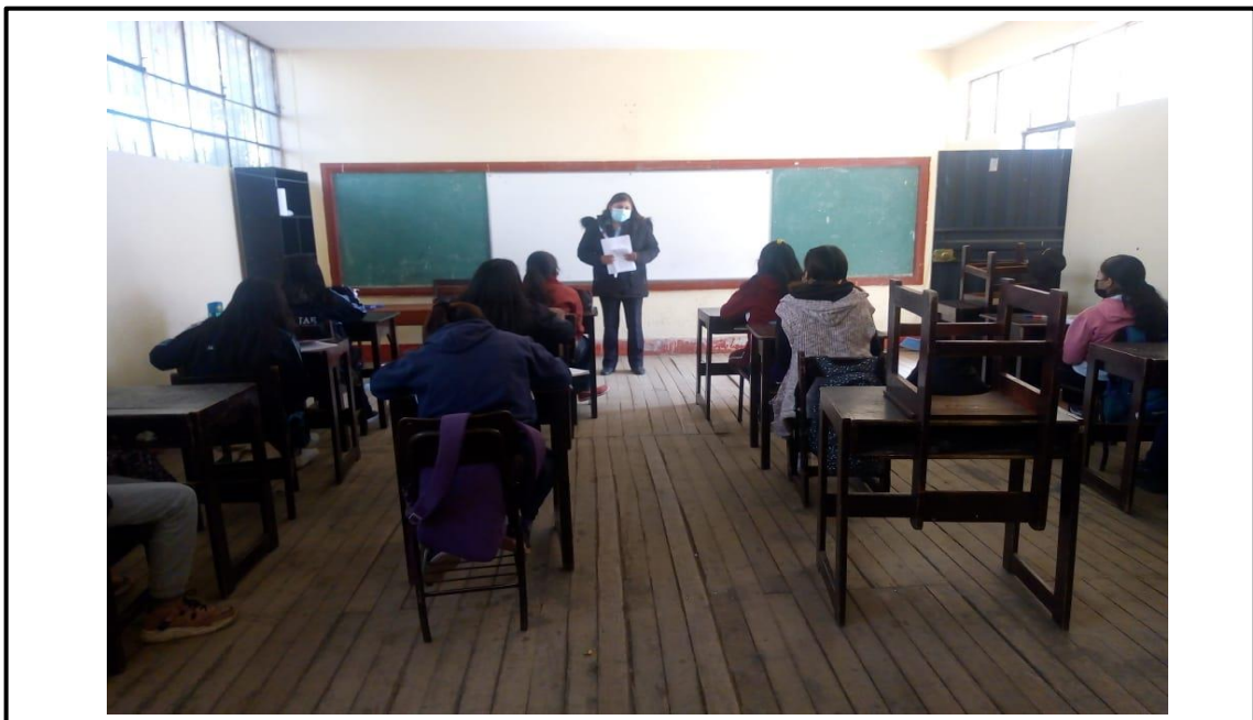
FOTOGRAFIA 04: ENCUESTA APLICADA A LOS ALUMNOS DE LA INSTITUCIÓN EDUCATIVA SECUNDARIA JOSÉ ANTONO ENCINAS DE LA CIUDAD DE PUNO.