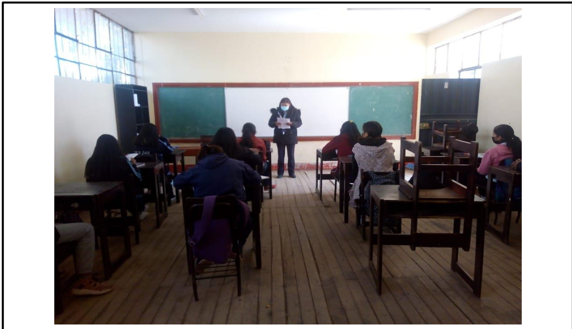
FOTOGRAFIA 03: EXPLICACIÓN DE LA ENCUESTA A LOS ALUMNOS DE LA INSTITUCIÓN EDUCATIVA SECUNDARIA JOSÉ ANTONO ENCINAS DE LA CIUDAD DE PUNO.