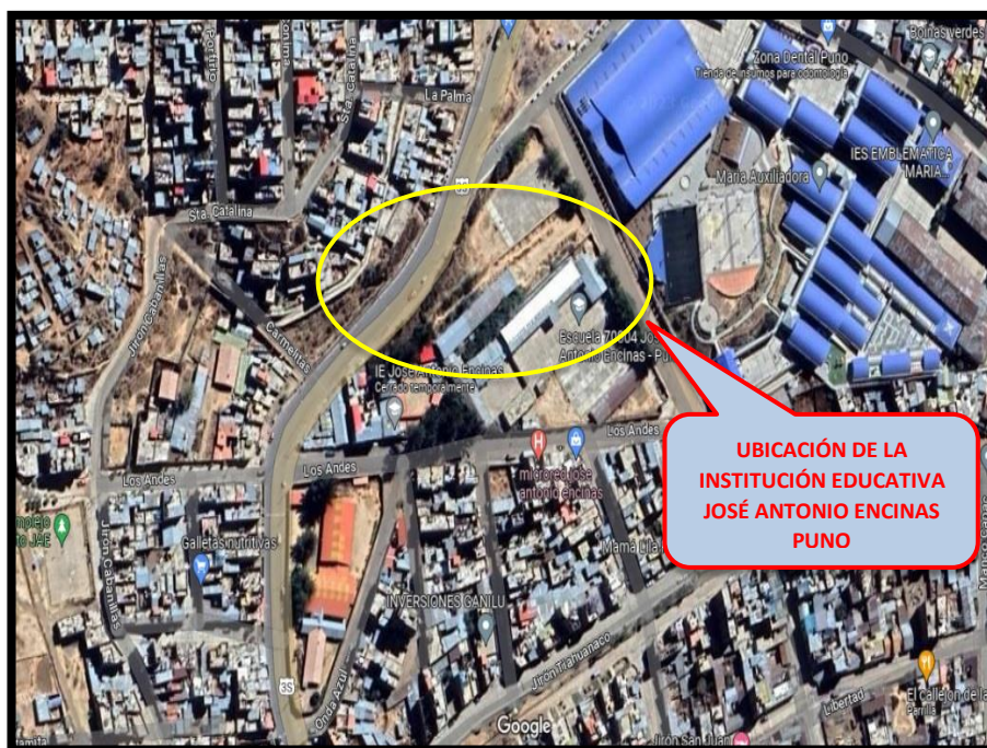
FIGURA N° 01: UBICACIÓN DE LA INSTITUCIÓN EDUCATIVA JOSÉ ANTONIO ENCINAS PUNO

La IES José Antonio Encinas se encuentra ubicado en el departamento de Puno , con dirección actual de Jirón los Andes 246 que pertenece a la población Urbana, una “institución educativa perteneciente a la DRE Puno con código 210001 y que está supervisada por la UGEL Puno”.