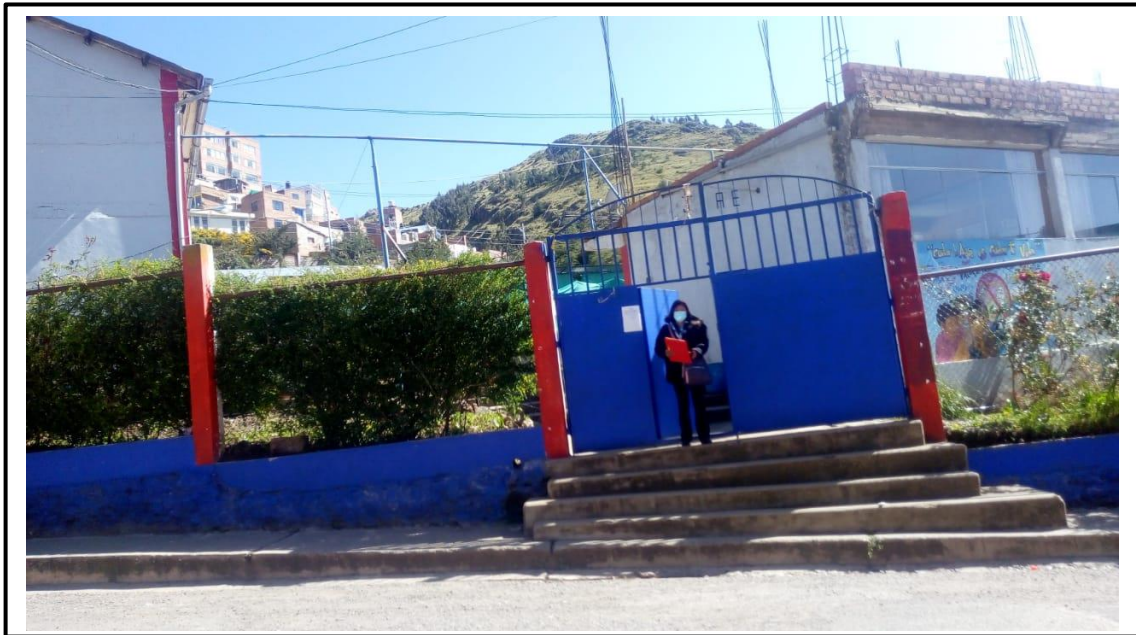
FOTOGRAFIA 01: INGRESO A LA INSTITUCIÓN EDUCATIVA SECUNDARIA JOSÉ ANTONO ENCINAS DE LA CIUDAD DE PUNO