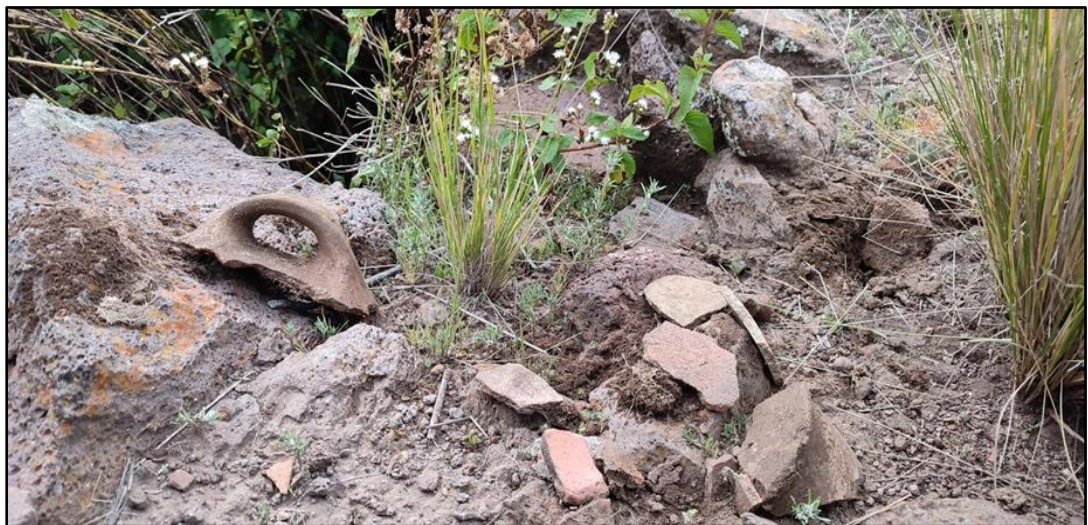
Restos de cerámica regados en Puruntanipata

Nota. La figura representa los restos de cerámica de Puruntanipata dispersos y en estado desintegrado, 2022