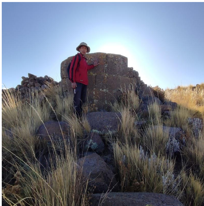
Nota. Observación arquitectónica del resto funerario 3 de Puruntanipata, 2022