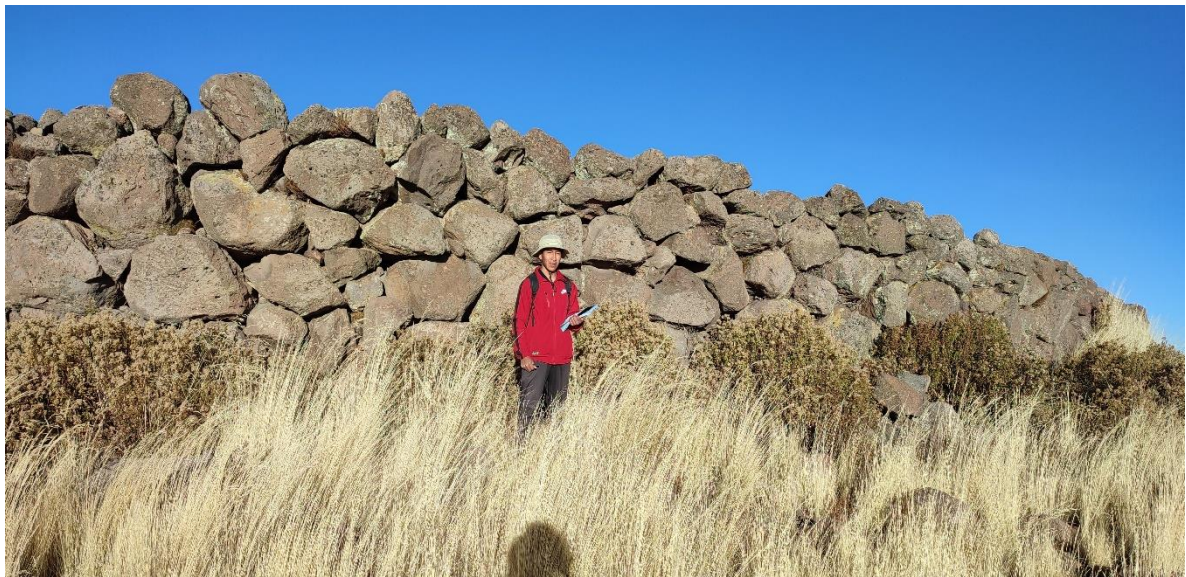
Nota. Observación arquitectónica a las murallas de Puruntanipata, 2022.