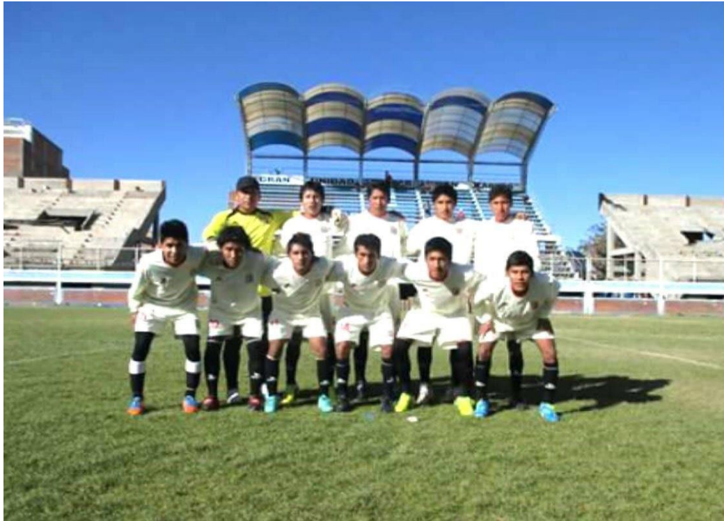
FUTBOLISTAS DEL CLUB DEPORTIVO UNIVERSITARIO DE LA LIGA DEPORTIVA DISTRITAL DE PUNO-2019.