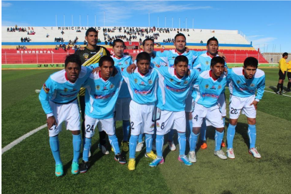
FUTBOLISTAS DEI CLUB DEPORTIVO BINACIONAL - LIGA DEPORTIVA PROVINCIAL DE CHUCUITO