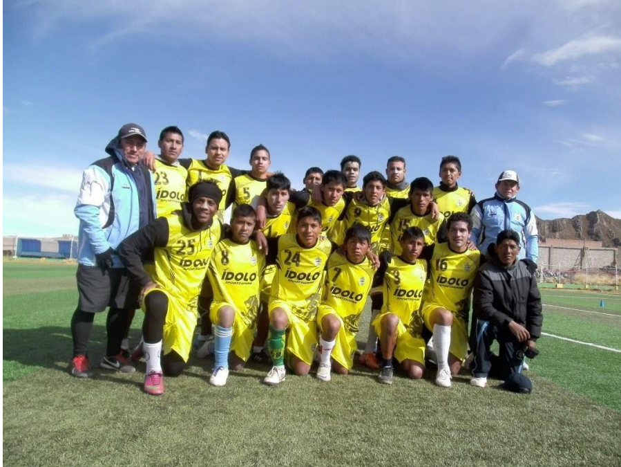
LOS FUTBOLISTAS DE UN CLUB DEPORTIVO DE LA LIGA DEPORTIVA DISTRITAL DE DESAGUADERO- 2017