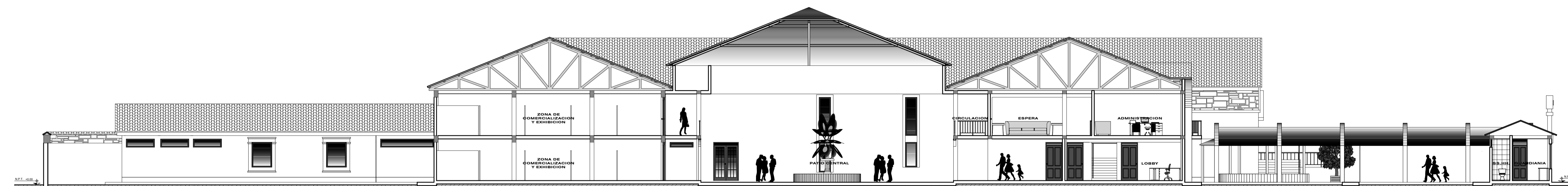
SECCION X-X DEL CONJUNTO ESCALA 1:125