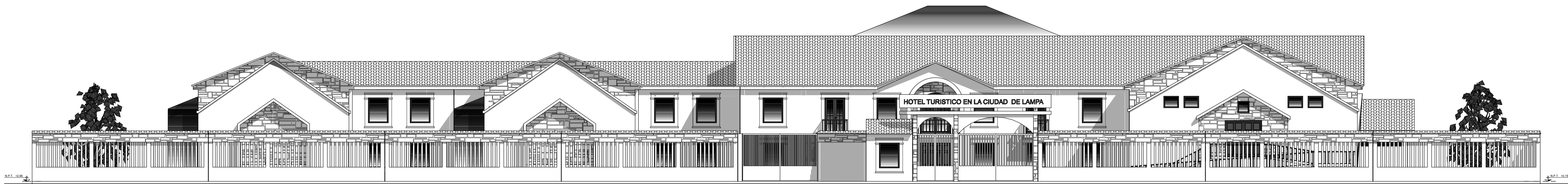
ELEVACION PRINCIPAL DEL CONJUNTO ESCALA 1:125