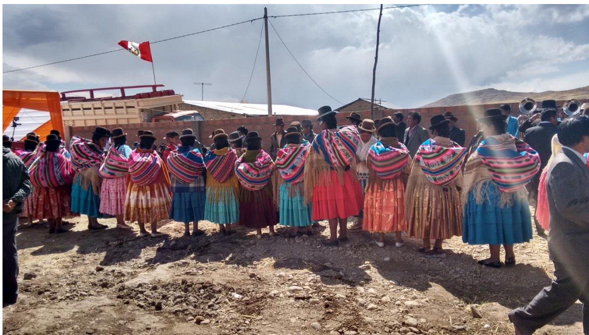
FIGURA N° 19. Entrega de regalos a los novios de parte de sus familiares y todos los invitados

(Día 2) (matrimonio entre W.A.C. y M.T.M)