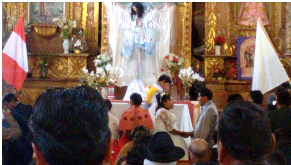
FIGURA N° 04. El novio recibe a la novia de la mano de su padre.

Fuente: propia (matrimonio entre W.A.C. y M.T.M)