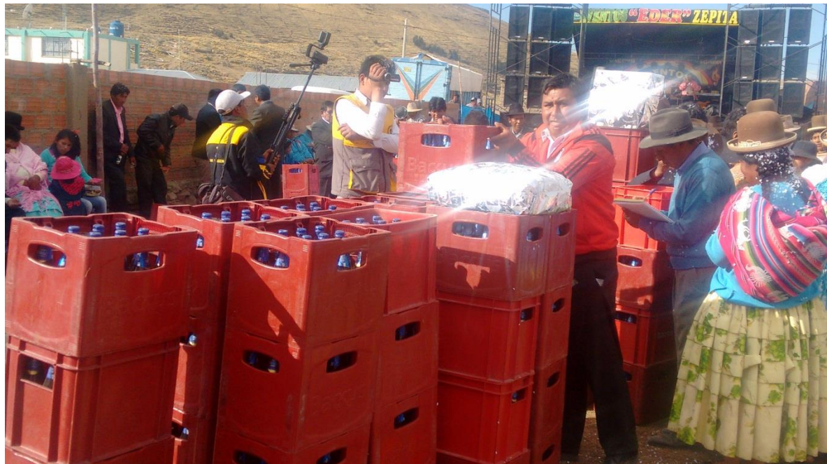
FIGURA N° 21. Momento en el que los familiares e invitados entregan cervezas a los novios.