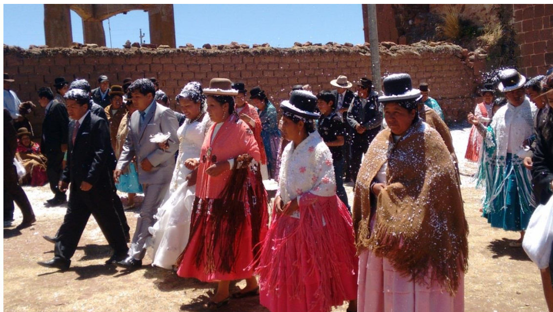
FIGURA N° 08. Partida de los novios hacia la municipalidad Distrital de Zepita.