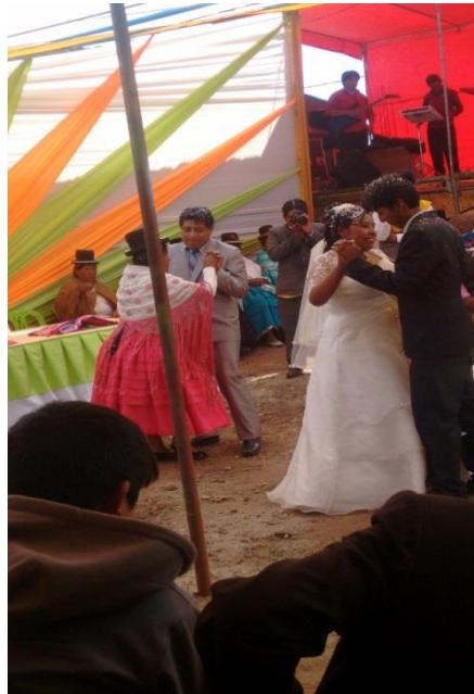
FIGURA N° 13. Bailan los novios con el primer padrino.

Fuente: propia (matrimonio entre W.A.C. y M.T.M)