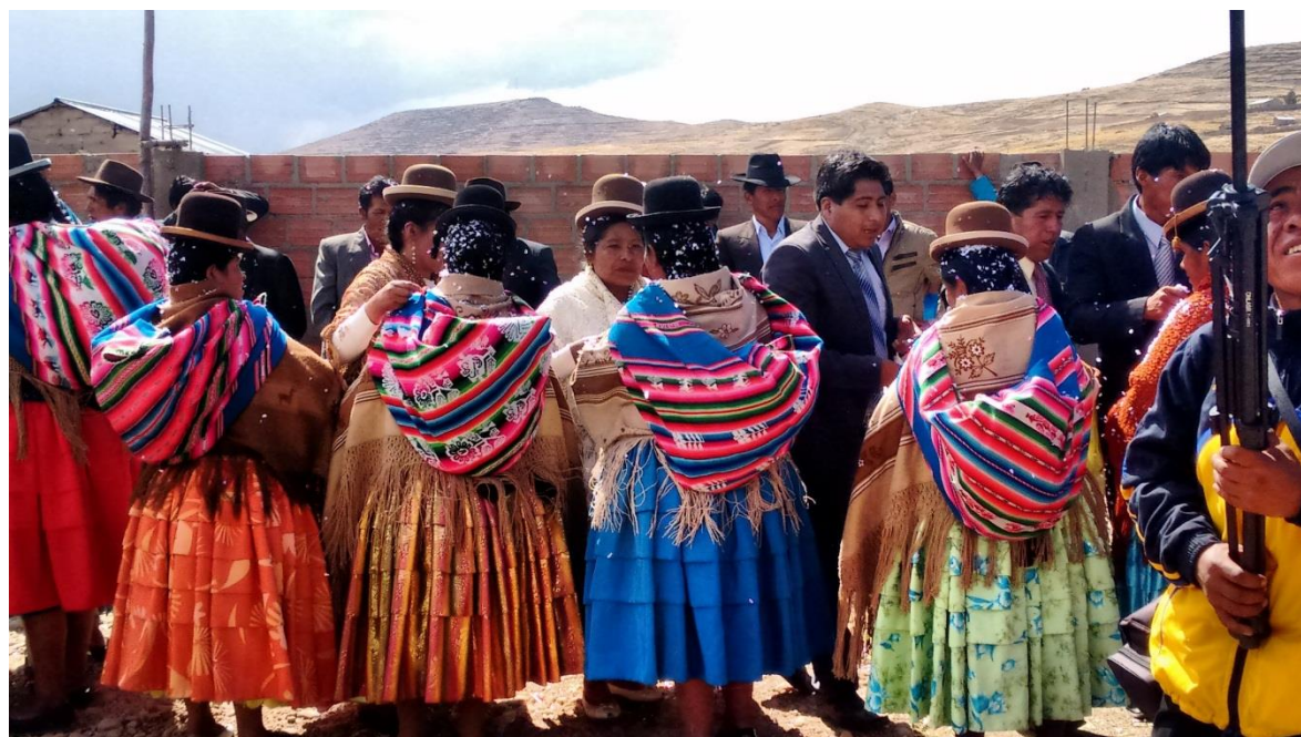
FIGURA N° 20. Los novios y familiares reciben a los familiares e invitados echando misturas.