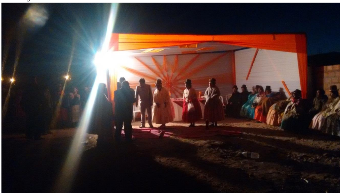
FIGURA N° 17. Los padrinos y los padres de los recién casados se preparan para dar consejos.