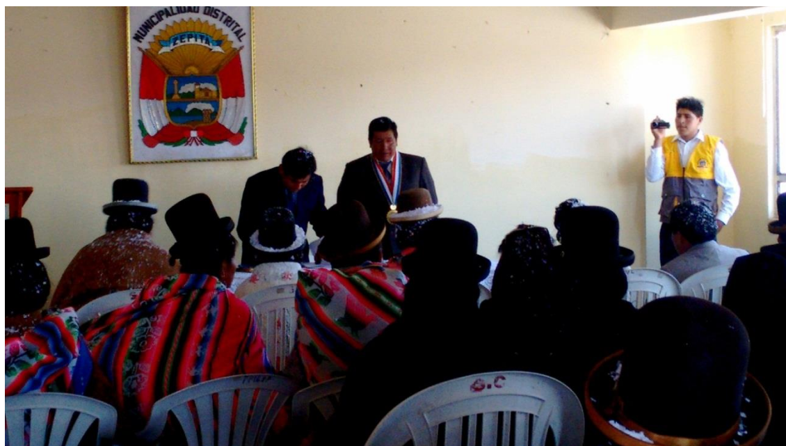
FIGURA N° 09. Matrimonio civil con la presencia del Alcalde del distrito de Zepita y registrador civil.