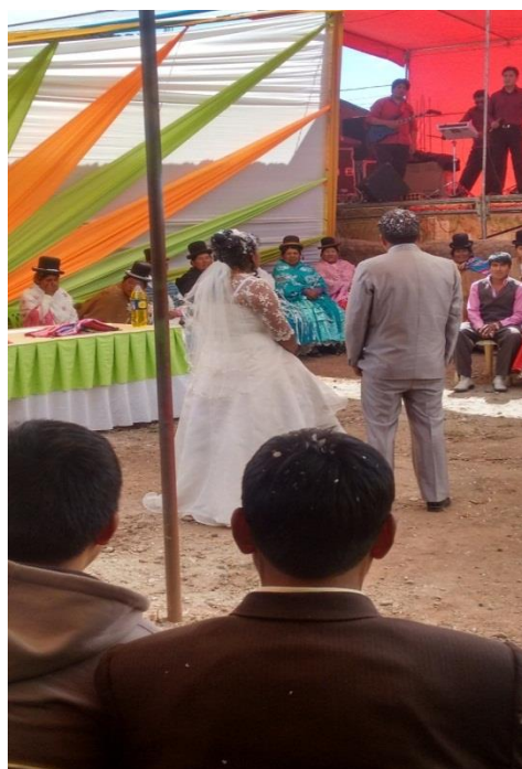
FIGURA N° 12. Llegada de los recién casados a la vivienda del primer padrino.

Fuente: propia (matrimonio entre W.A.C. y M.T.M)