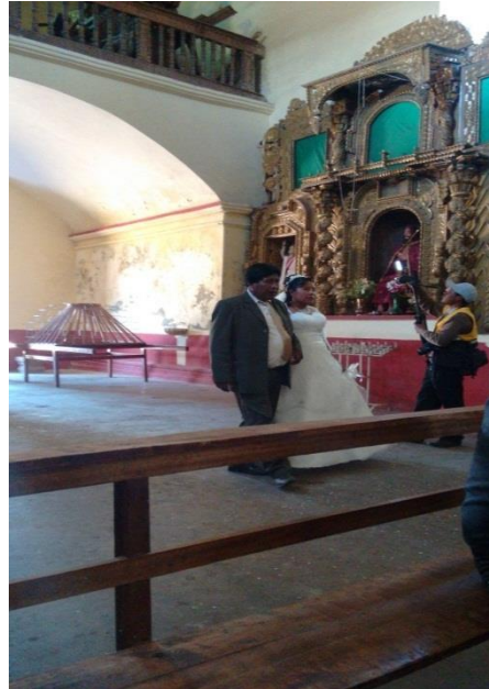
FIGURA N°03. Llegada de la novia a la iglesia.

Fuente: propia (matrimonio entre W.A.C. y M.T.M)