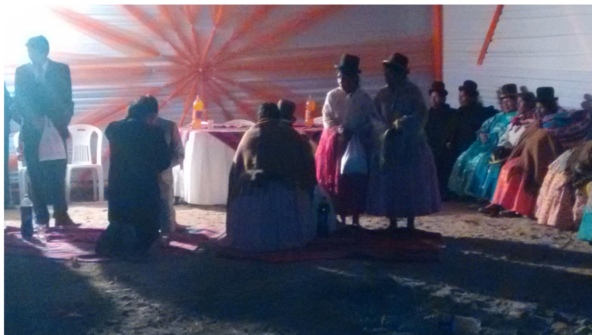
FIGURA N° 18. Padres y los padrinos hacen la respectiva (ewxa) consejos a los recién casados

Fuente: propia (matrimonio entre W.A.C. y M.T.M)