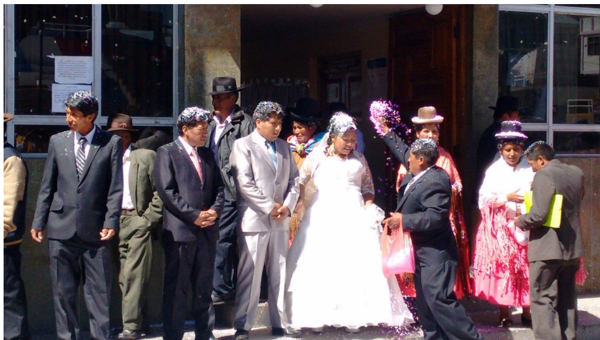
FIGURA N° 11. Felicitación de los padres y familiares echando misturas a los novios.

Fuente: propia (matrimonio entre W.A.C. y M.T.M)