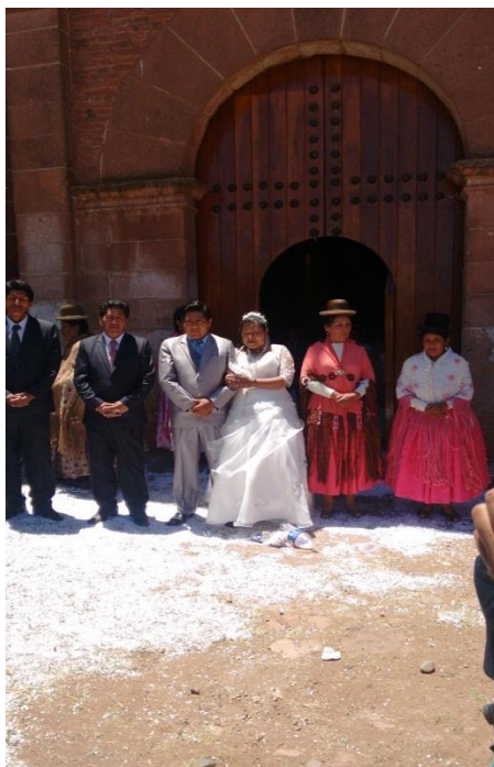
FIGURA N° 07. Salida de los novios del Templo después del matrimonio religioso.

Fuente: propia (matrimonio entre W.A.C. y M.T.M)