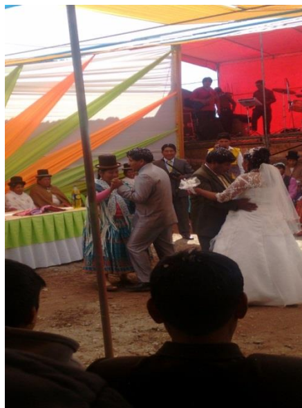
FIGURA N° 14. Baile de los recién casados con el segundo padrino.