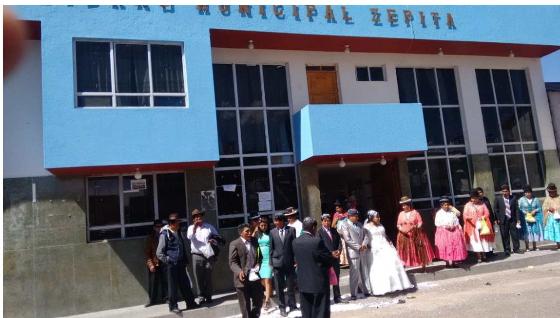
FIGURA N° 10. Momento en que salen después de la ceremonia civil en la MDZ.