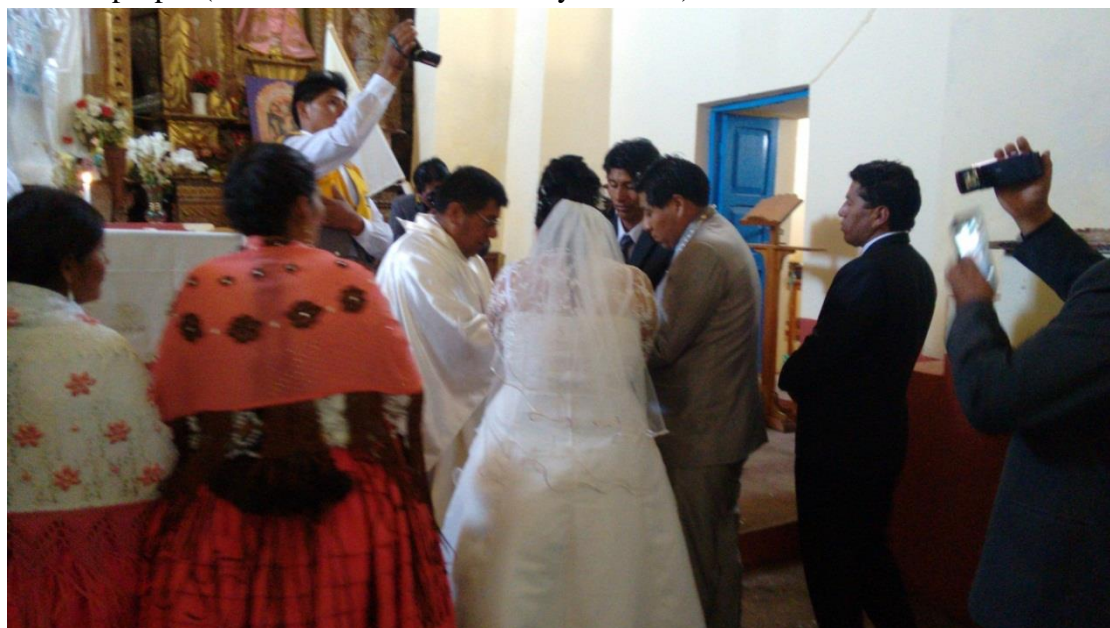
FIGURA N° 06. Finalización de la ceremonia religiosa.

Fuente: propia (matrimonio entre W.A.C. y M.T.M)