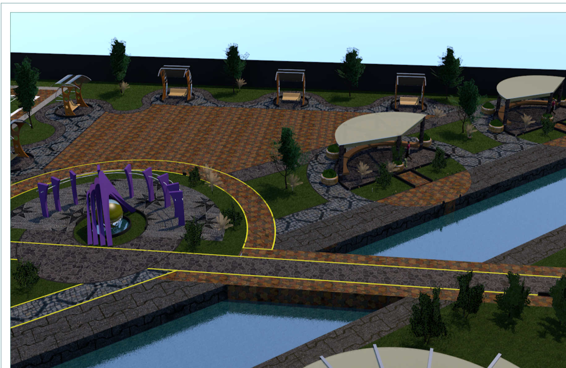
VOLUMETRIA PLAZA ALEGORICA ESC: S/E