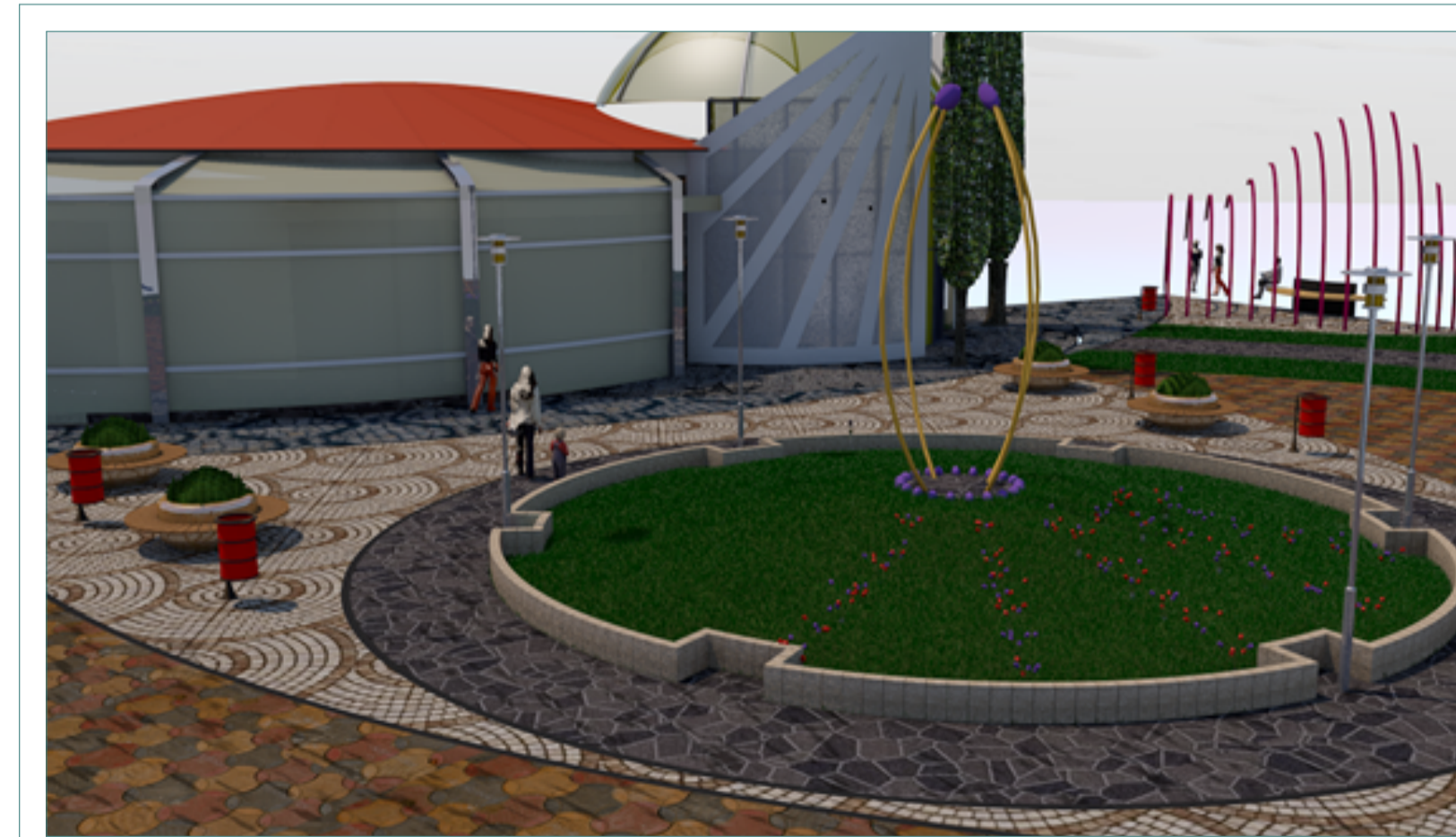
VOLUMETRIA PLAZA DE LA FLOR ESC: S/E