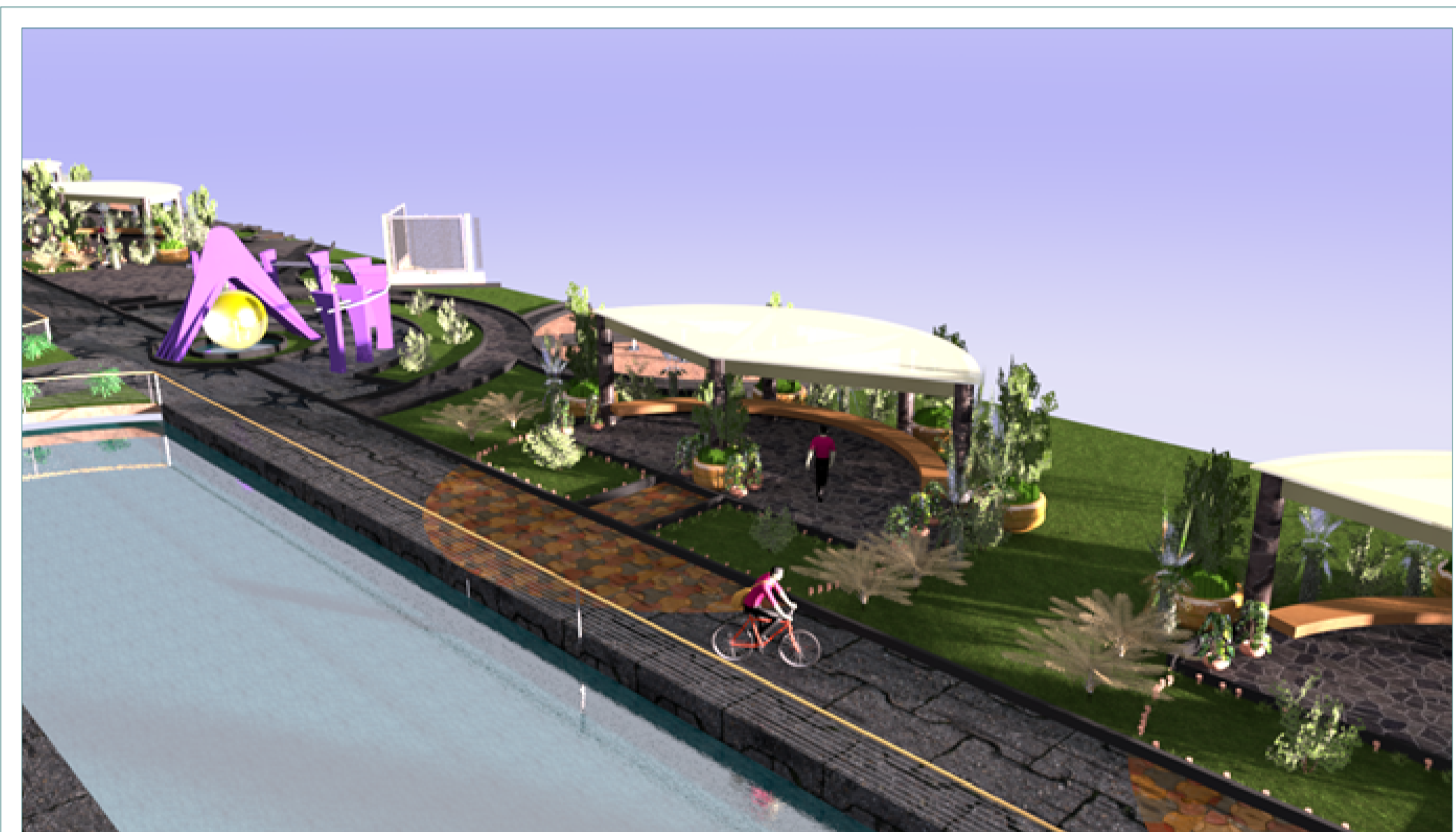
VOLUMETRIA ALAMEDA Y ESTARES ESC: S/E