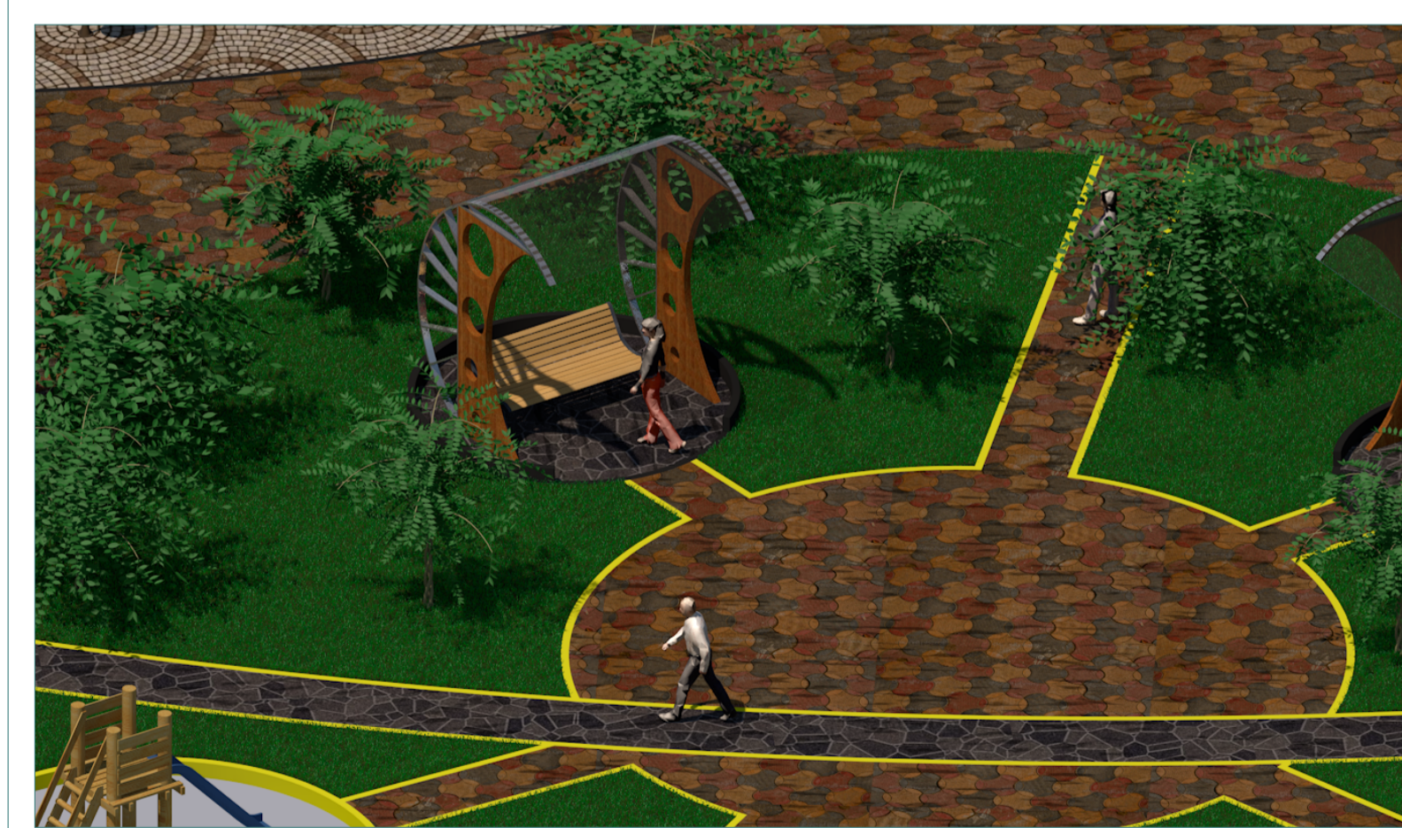
VOLUMETRIA ESTAR Y CAMINERIAS ESC: S/E