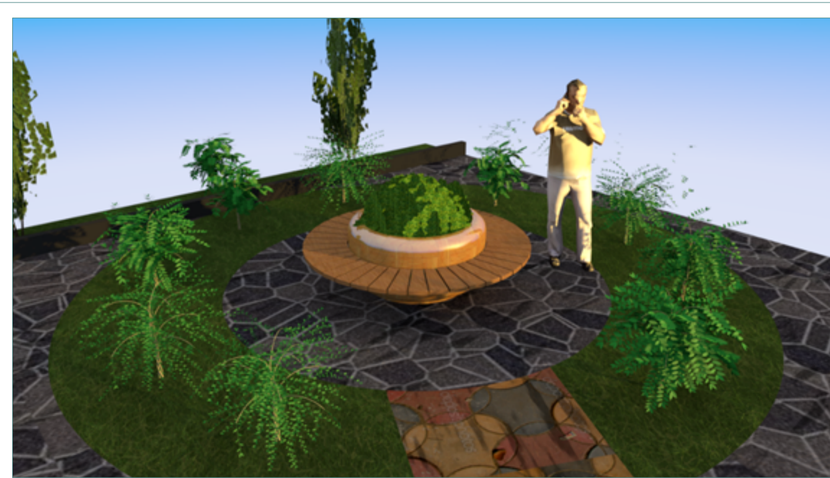
VOLUMETRIA ESTAR DESCANZO ESC: S/E