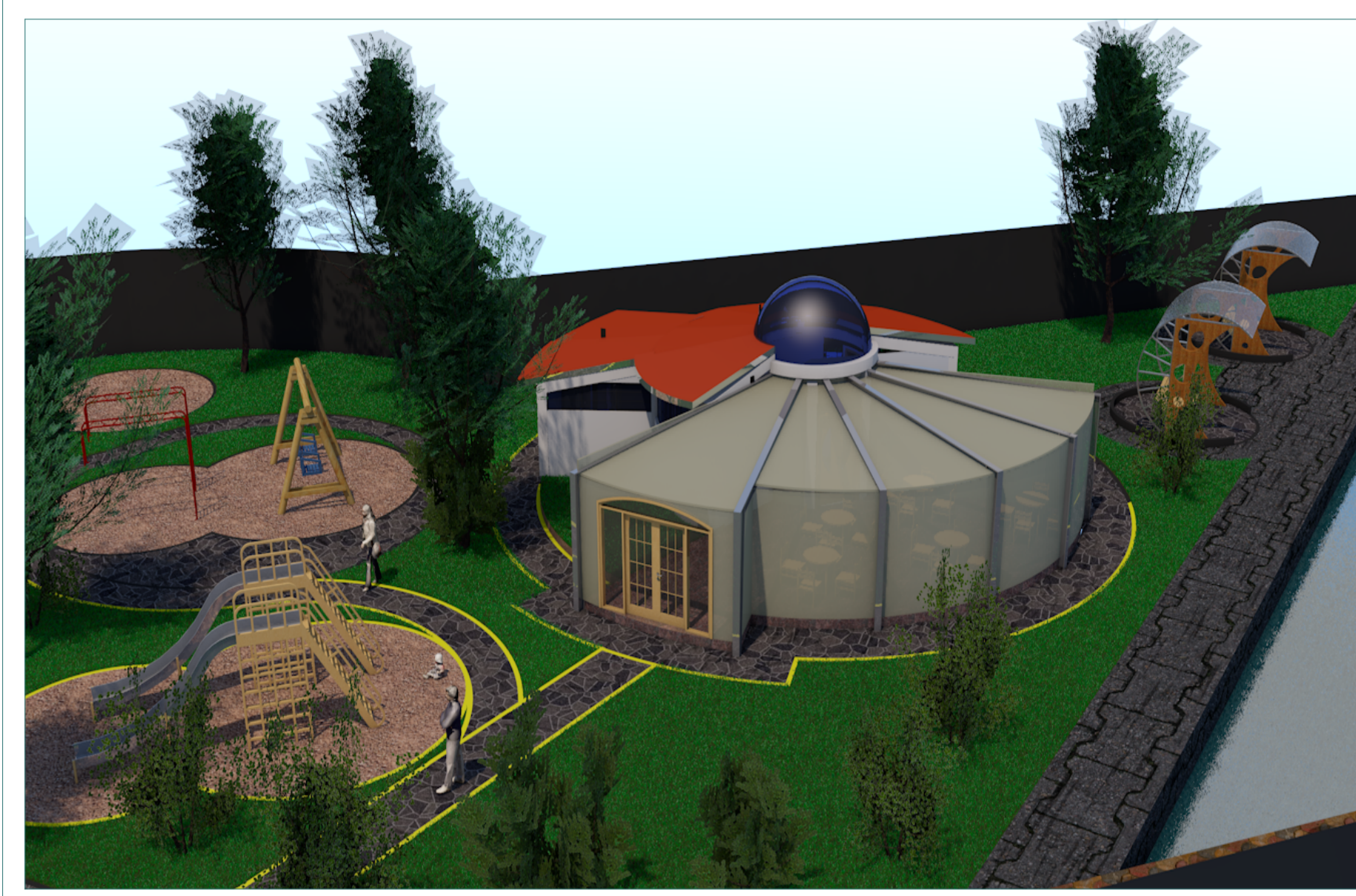
VOLUMETRIA CAFETERIA ESC: S/E