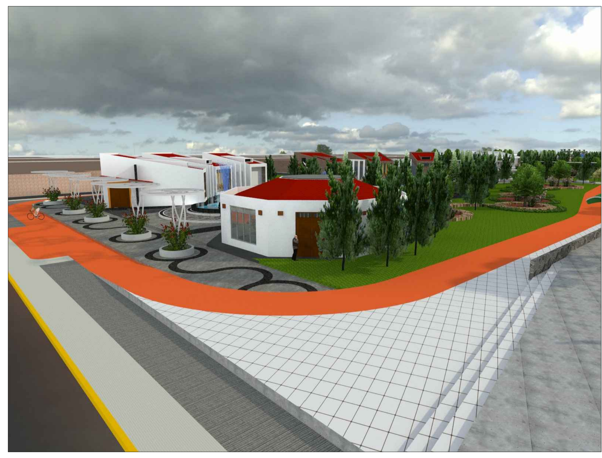
IMAGEN 3D - INFORMACION TURISTICA ESCALA 1/50