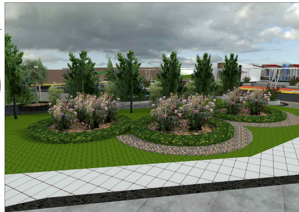
VISTA 3D - Jardin botanico