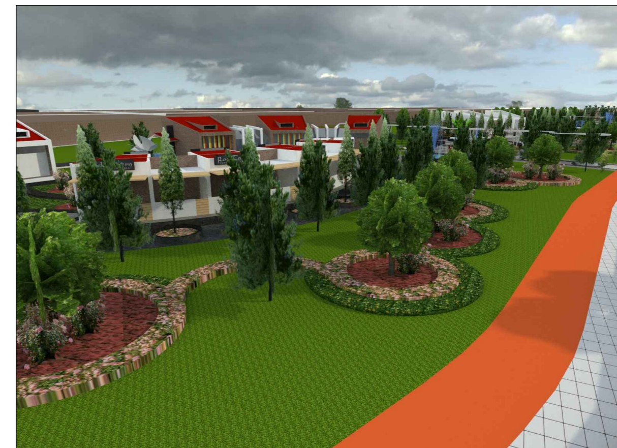
VISTA 3D - Jardin botanico