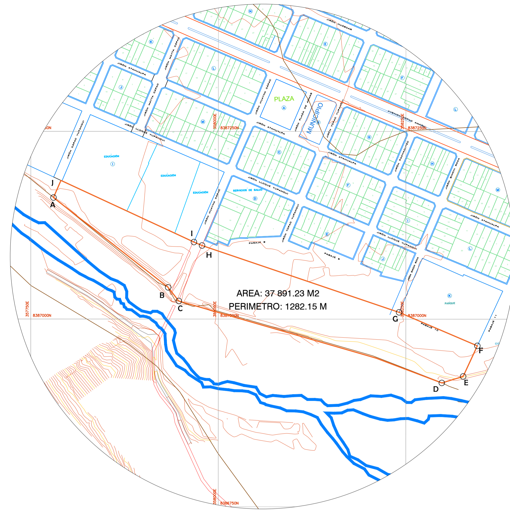
PLANO DE UBICACION