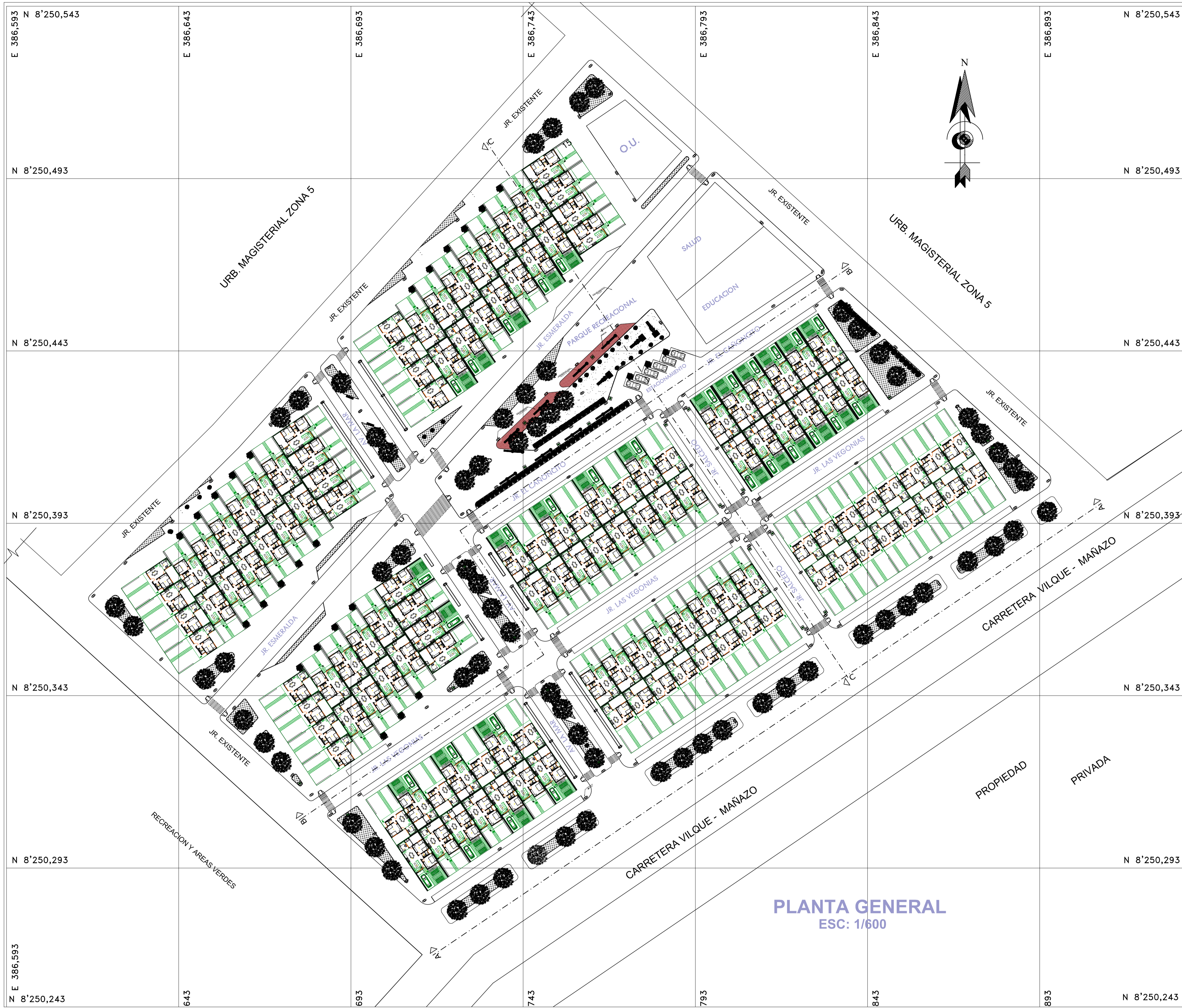
PLANTA GENERAL ESC: 1/600