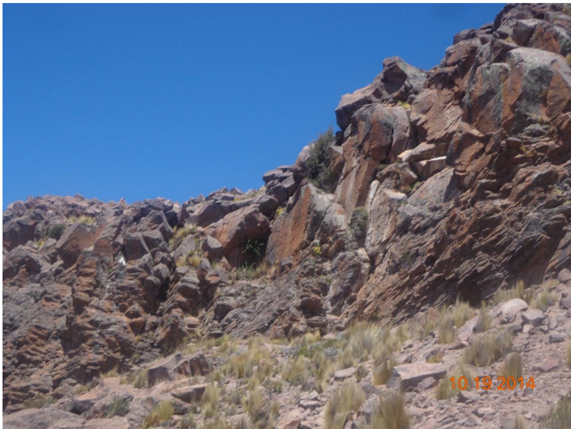
FOTOGRAFÍA DE TANA PACA ARCHIVOS DE CUADERNO DE CAMPO MURALLAS ACOPLADAS AL GEOGRAFIA DEL CERRO TERCER AMURALLA PUNTOS MUERTOS