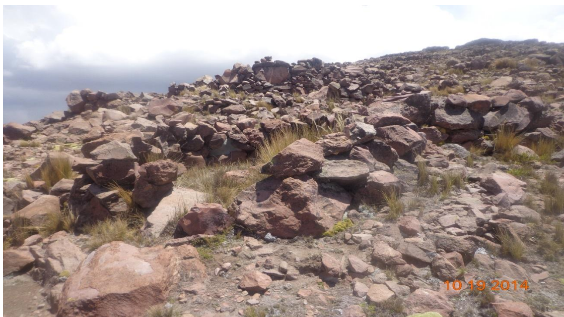
DESTRUCCIONES DE LAS VIVIENDAS DE LOS ANTIGUOS POBLADORES JUGAR CUARTA MURALLA.