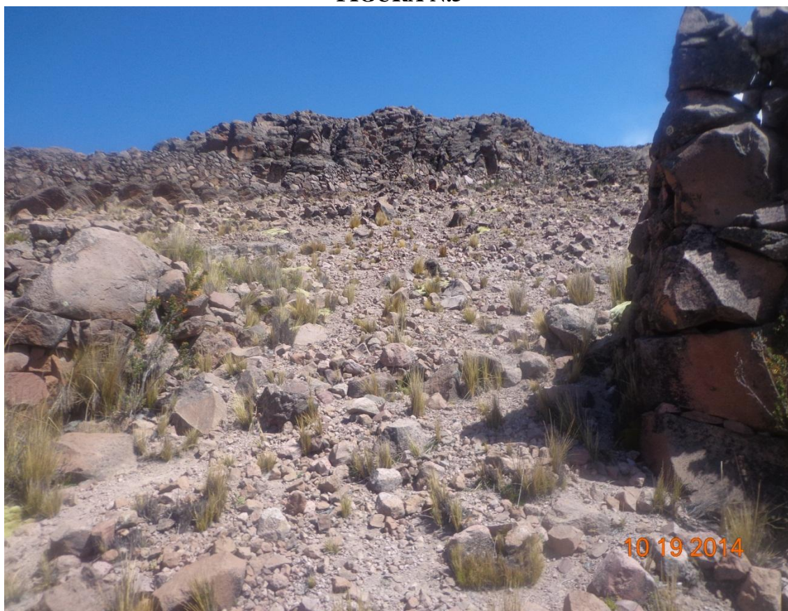
FOTOGRAFÍA DE TANA PACA ARCHIVOS DE CUADERNO DE CAMPO PUERTA DE INGRESO