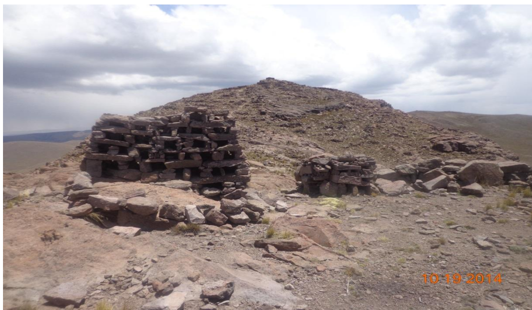
FOTOGRAFÍA TANA PACA ARCHIVOS DE CUADERNO DE CAMPO MODIFICACIÓN DE EDIFICACIONES ORIGINALE A CASA EN MINIATURA PARA LA CELEBRACIÓN DE SUS FIESTA DEL 6 DE AGOSTO