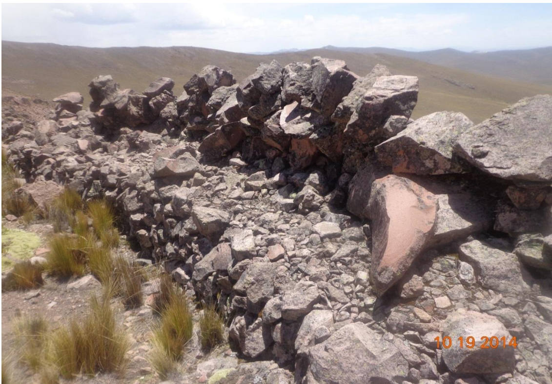
FOTOGRAFÍA DE TANA PACAARCHIVOS DE CUADERNO DE CAMPO SENDERO DEL MURO

Por la forma de su construcción de la primera muralla se encargaba de cuidar el ganado y la movilización de las personas y el ejército como se mencionó esta muralla cuenta con la puerta de ingreso más grande que se ubica mirando al lago la cual se