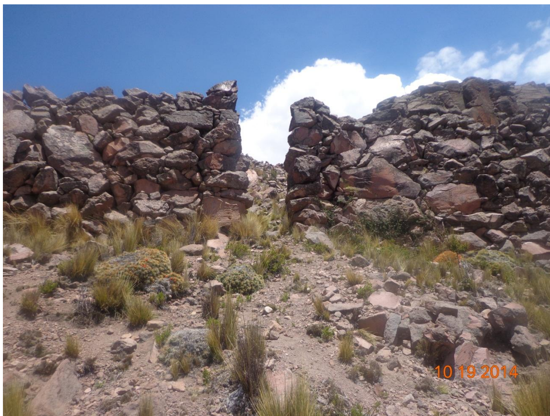
FOTOGRAFÍA DE TANA PACA ARCHIVOS DE CUADERNO DE CAMPO PUERTA DE INGRESO DE LA SEGUNDA MURALLA