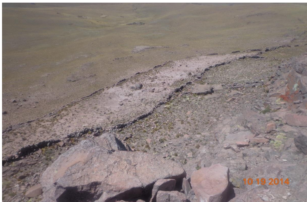
FOTOGRAFÍA DE TANA PACA ARCHIVOS DE CUADERNO DE CAMPO LOS MUROS