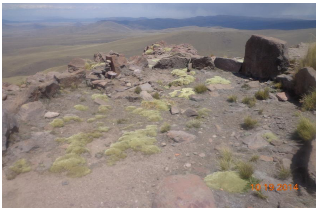
FOTOGRAFÍA TANA PACA ARCHIVO DE CUADERNO DE CAMPO LUGAR DE CEREMONIA