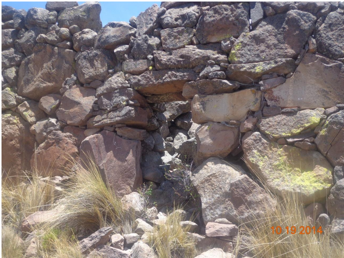
FOTOGRAFÍA DE TANA PACA ARCHIVOS DE CUADERNO DE CAMPO CORRAL DE LOS CAMELLIDOS ANDINOS

En la parte sur pude verse o asimilar como un forma de mirador su acceso por este lado es complicado pues este tiene más de cuatro torres que permitirán la visión total de sus territorio la particularidad de esta zona es que se encuentra más unida de la siguientes murallas con en otra parte en su altura es de dos metros con al mismo forma de construcción.