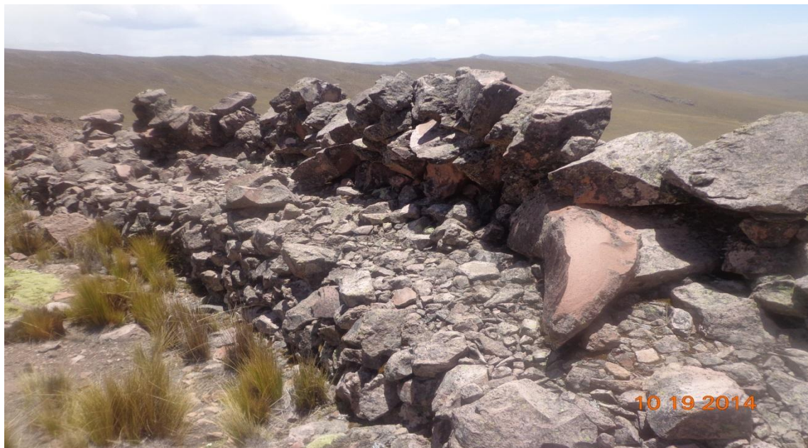
FOTOGRAFÍA TANA PACA ARCHIVOS DE CUADERNO DE TANA PACA: CAMINO DEL VIGILANTE DE LA FORTALEZA DE TANA PACA SEGUNDA MURALLA