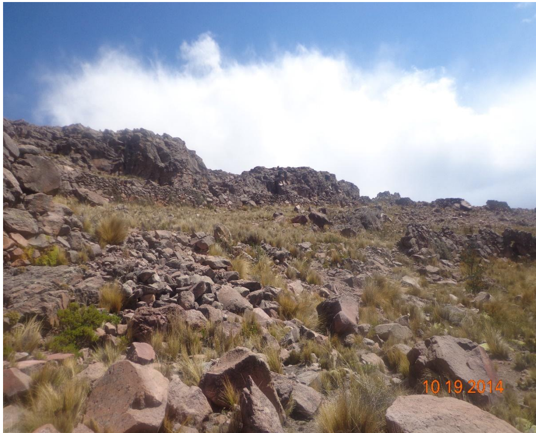
FOTOGRAFÍA TANA PACA ARCHIVOS DE CUADERNO DE CAMPO PRIMERA MURALLA DESTRUIDA.