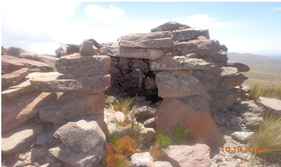
FOTOGRAFÍA TANA PACA ARCHIVOS DE CUADERNO DE TANA PACA: VIVIENDA DE ATIGUSO POBLADORES DE LA FROTALEZA DE TANA PACA