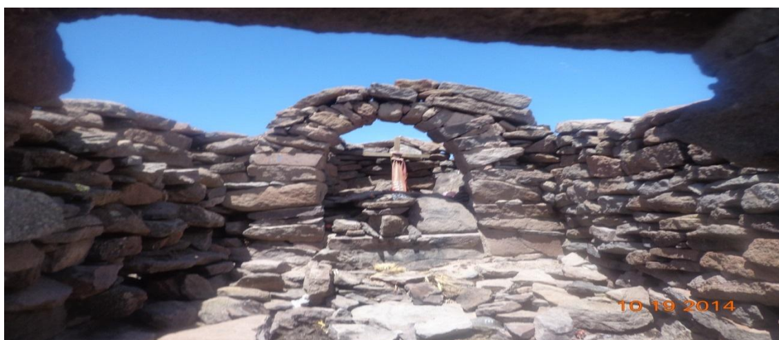
INTERIOR DE RECINTO MODIFICADO POR LOS POBLADORES PARA LA CELEBRACIÓN DE SU FIESTA DEL 6 DE AGOSTO.