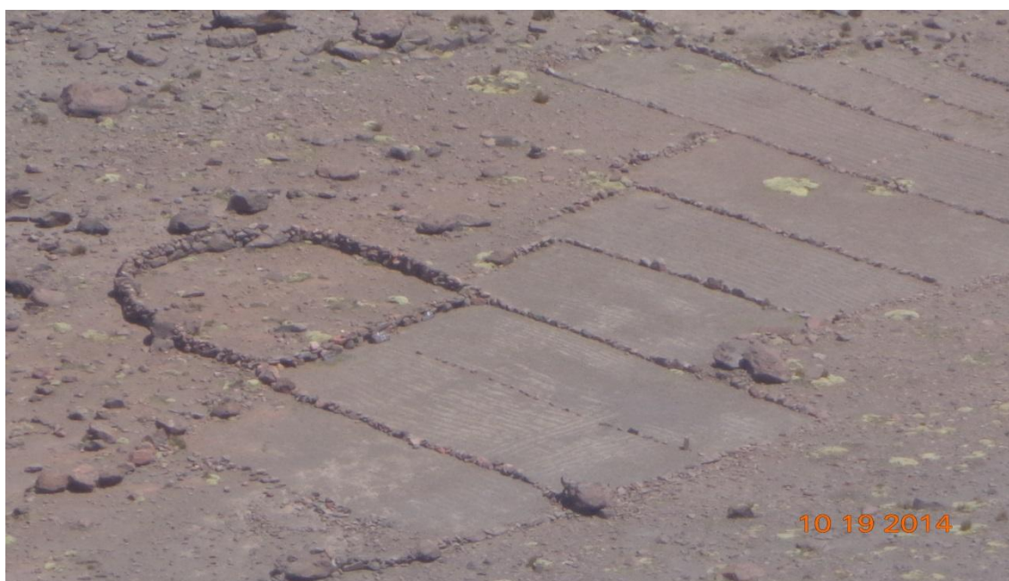
FOTOGRAFÍA TANA PACA ARCHIVOS DE CUADERNO DE TANA PACA: LUGAR DE CULTIVO DE LOS POBLADORES DE LA FORTALEZA DE TANA PACA ABANDONADO