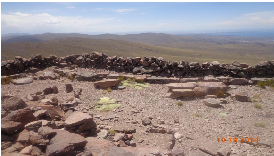
ESPACIO PARA LA CELEBRACIÓN O PAGOS O PARA REUNIONES PARA RENDIR CULTO A SUS DIOSES.