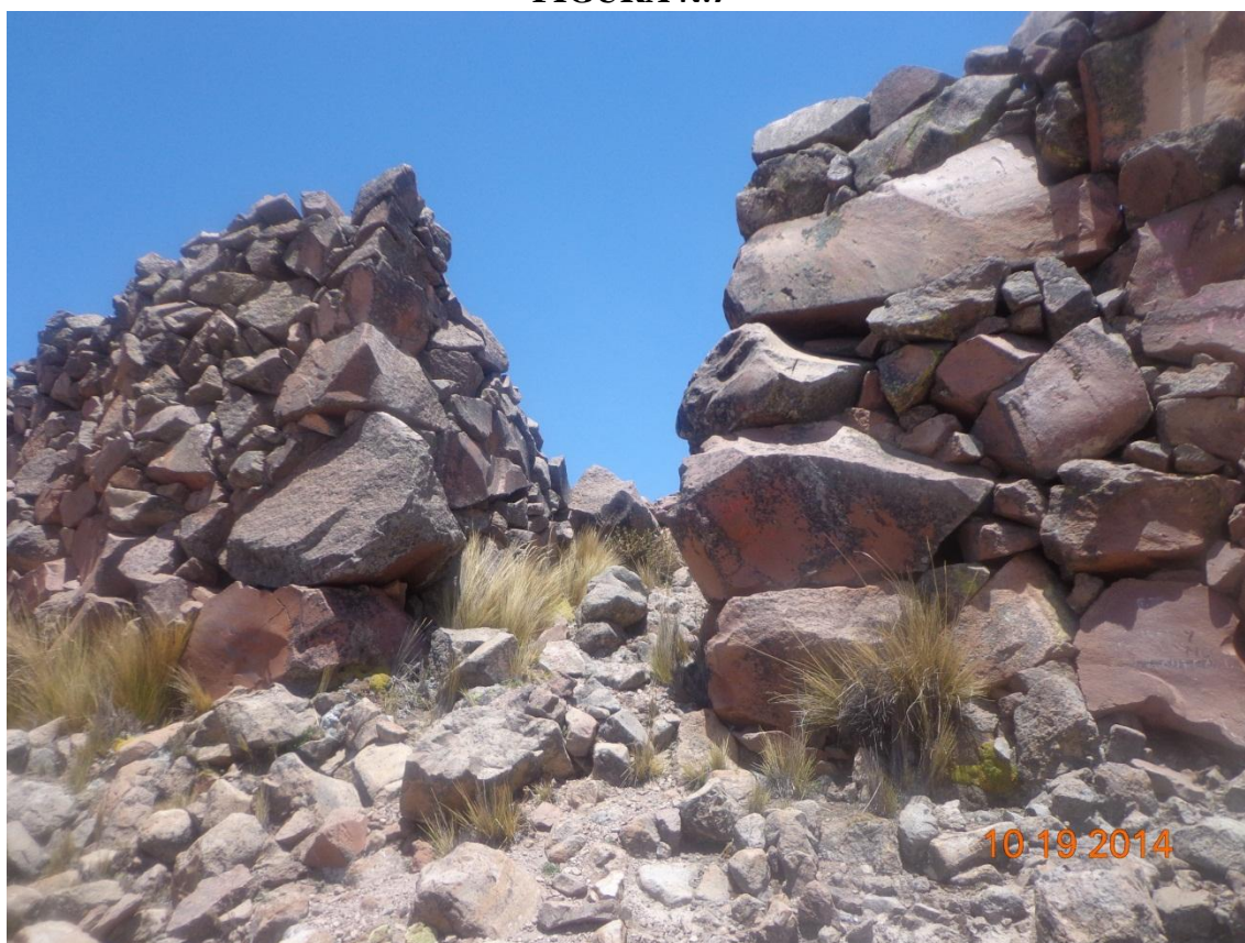
FOTOGRAFÍA DE TANA PACA ARCHIVOS DE CUADERNO DE CAMPO PUERTA DE INGRESO DE LA TERCERA MURALLA