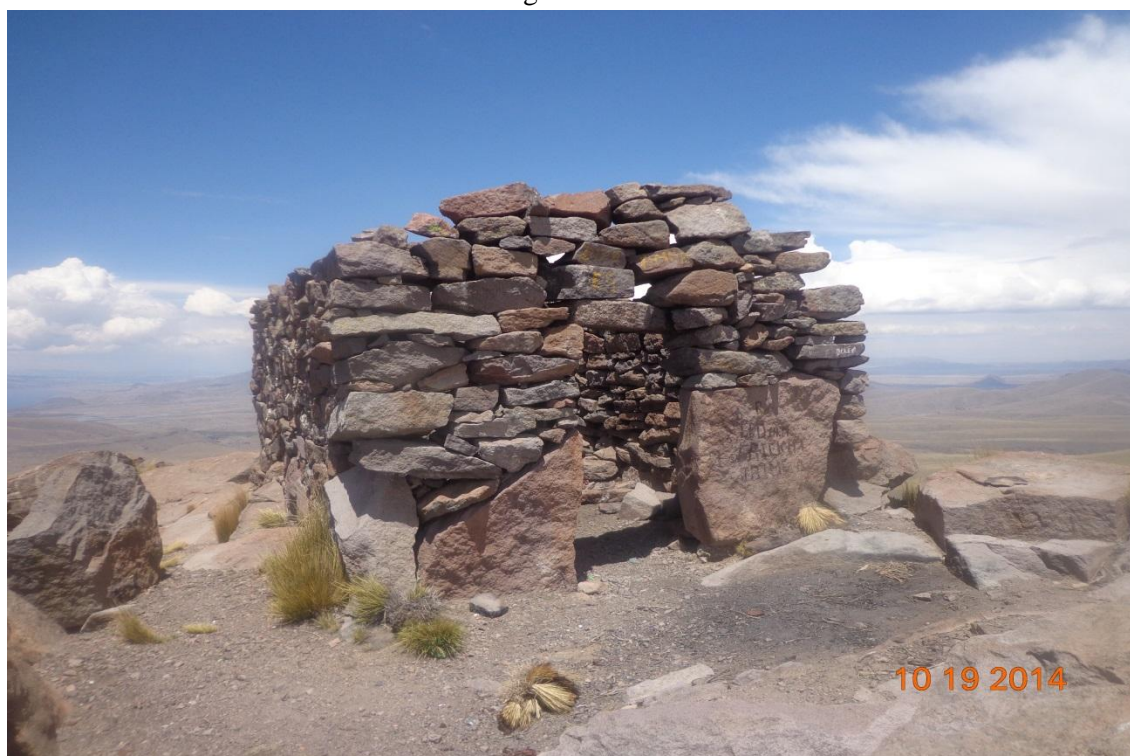
FOTOGRAFÍA TANA PACA ARCHIVOS DE CUADERNO DE TANA PACA: MODIFICACIÓN DEL CENTRO RELIGIOSO DE TANA PACA A CALVARIO DE LA FIESTA DE 6 DE AGOSTO