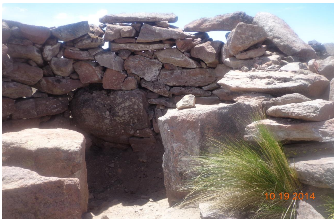
FOTOGRAFÍA TANA PACA ARCHIVOS DE CUADERNO DE TANA PACA: VIVIENDA DE ATIGUSO POBLADORES DE LA FROTALEZA DE TANA PACA.