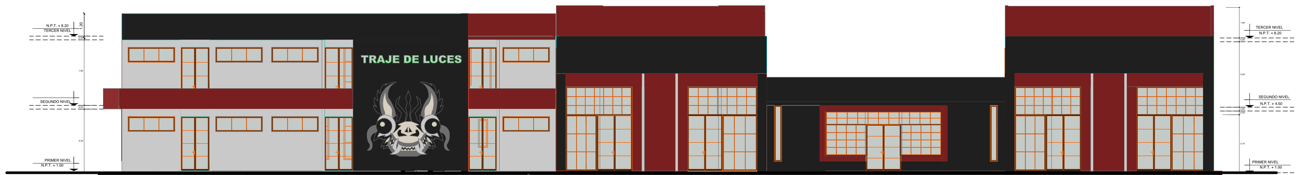
ELEVACION BLOQUE - E DANZA TRAJE DE LUCES ESC. 1/100