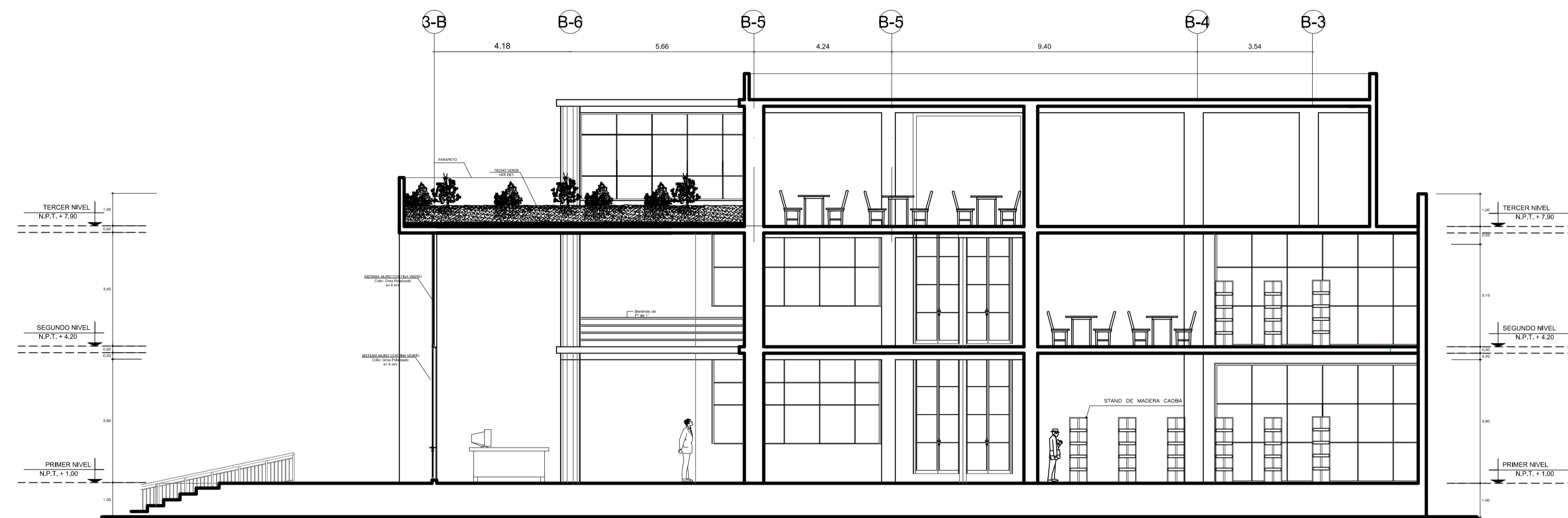
SECCION BLOQUE A (ADMINISTRACION)