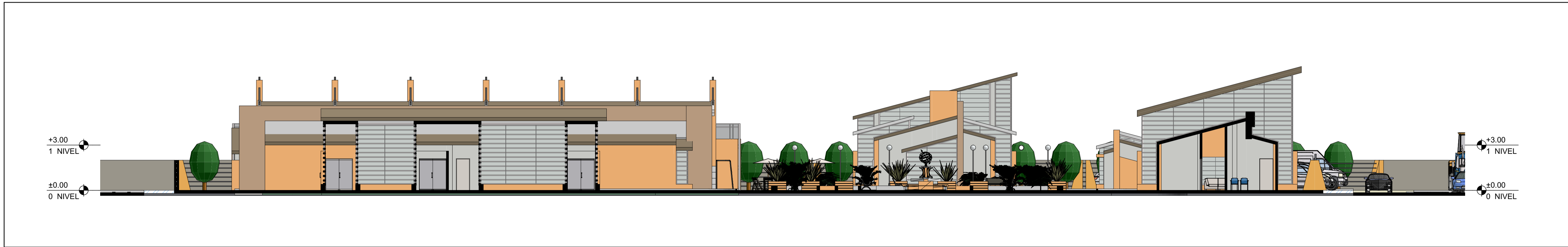
SECCION S4 ESC: 1/150