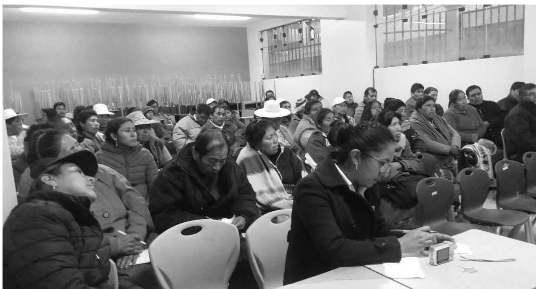
Foto 02: Estudiantes de 4to grado recibiendo indicaciones, previas al llenado de encuestas.