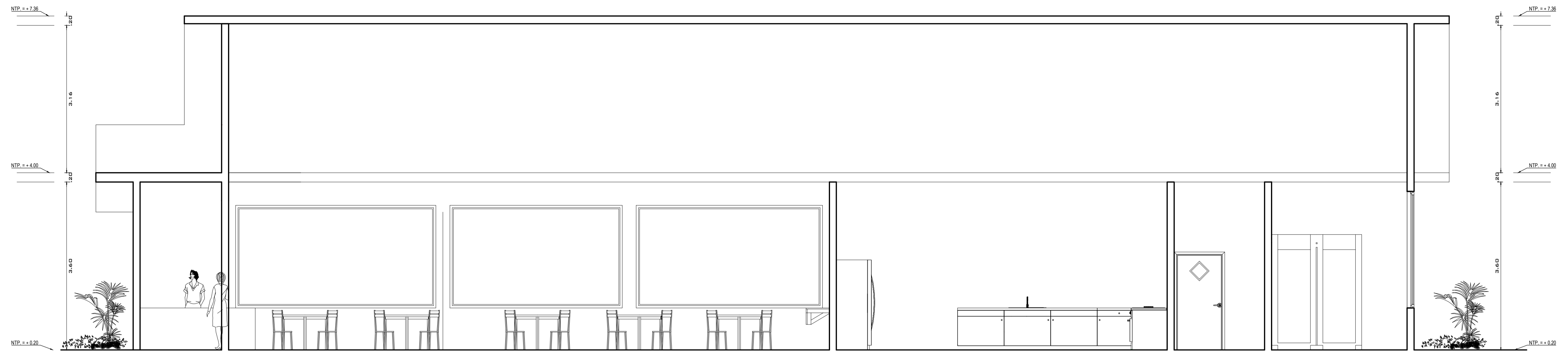
CORTE A - A