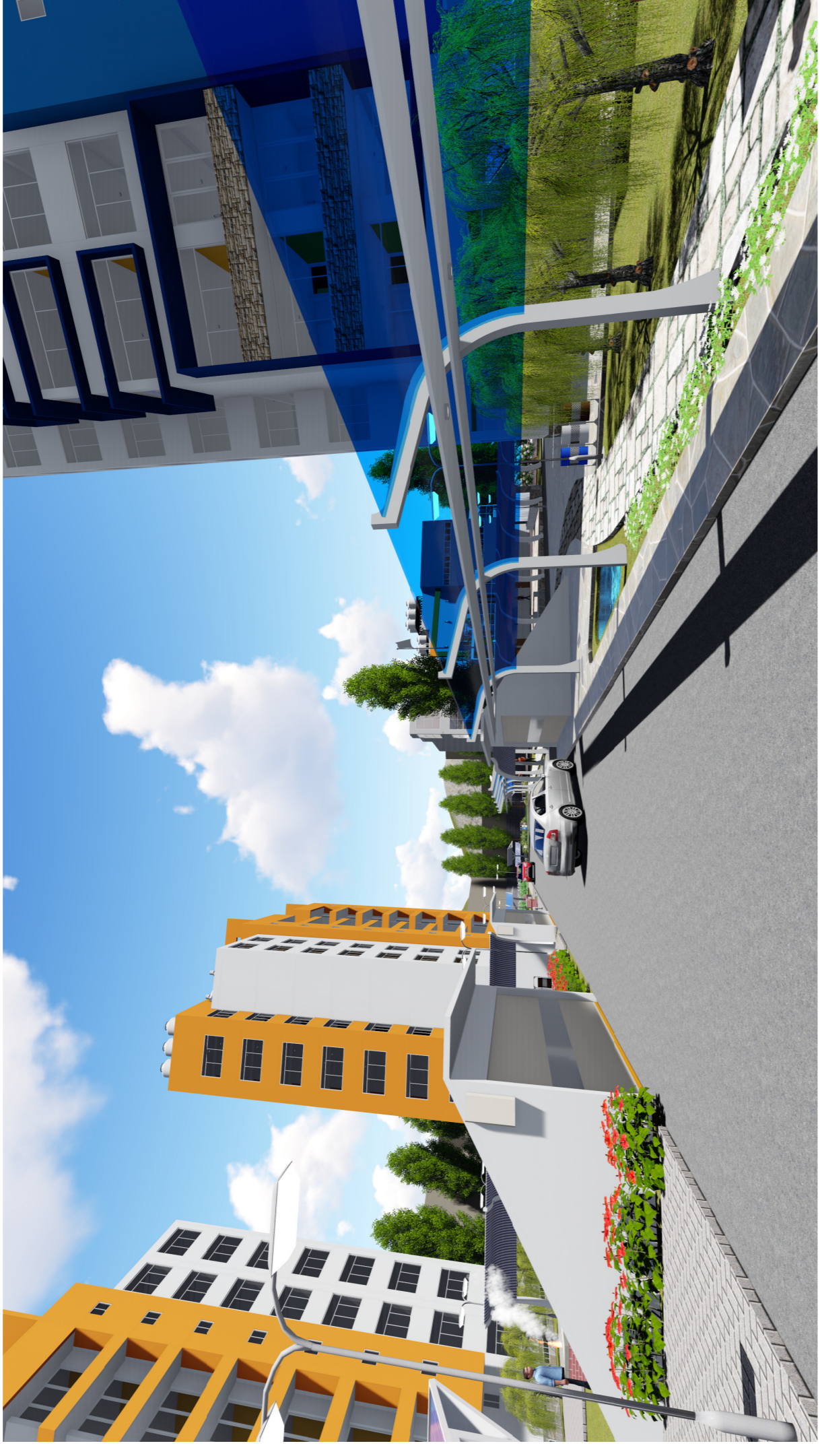
MODELADO 3D DE INGRESO DE ESTACIONAMIENTO SUBTERRANEO