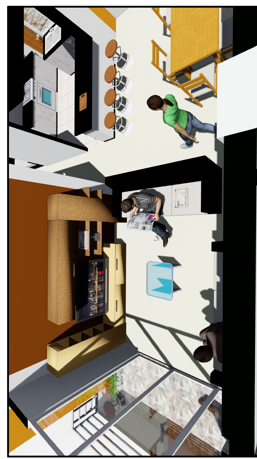
MODELADO 3D DE DE SALA-TIPO FLATS