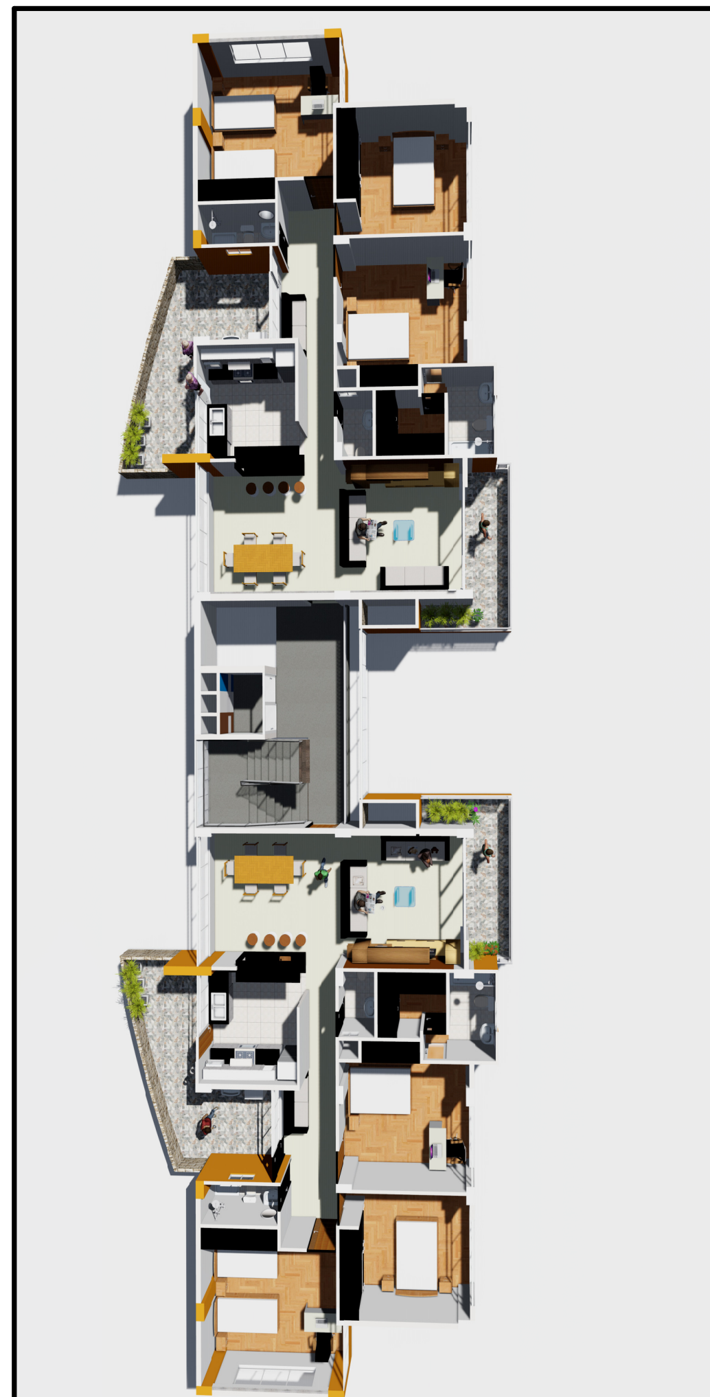
MODELADO 3D DE PLANTA DE DISTRIBUCION TIPICA (MODULO DE VIVIENDA TIPO FLATS)