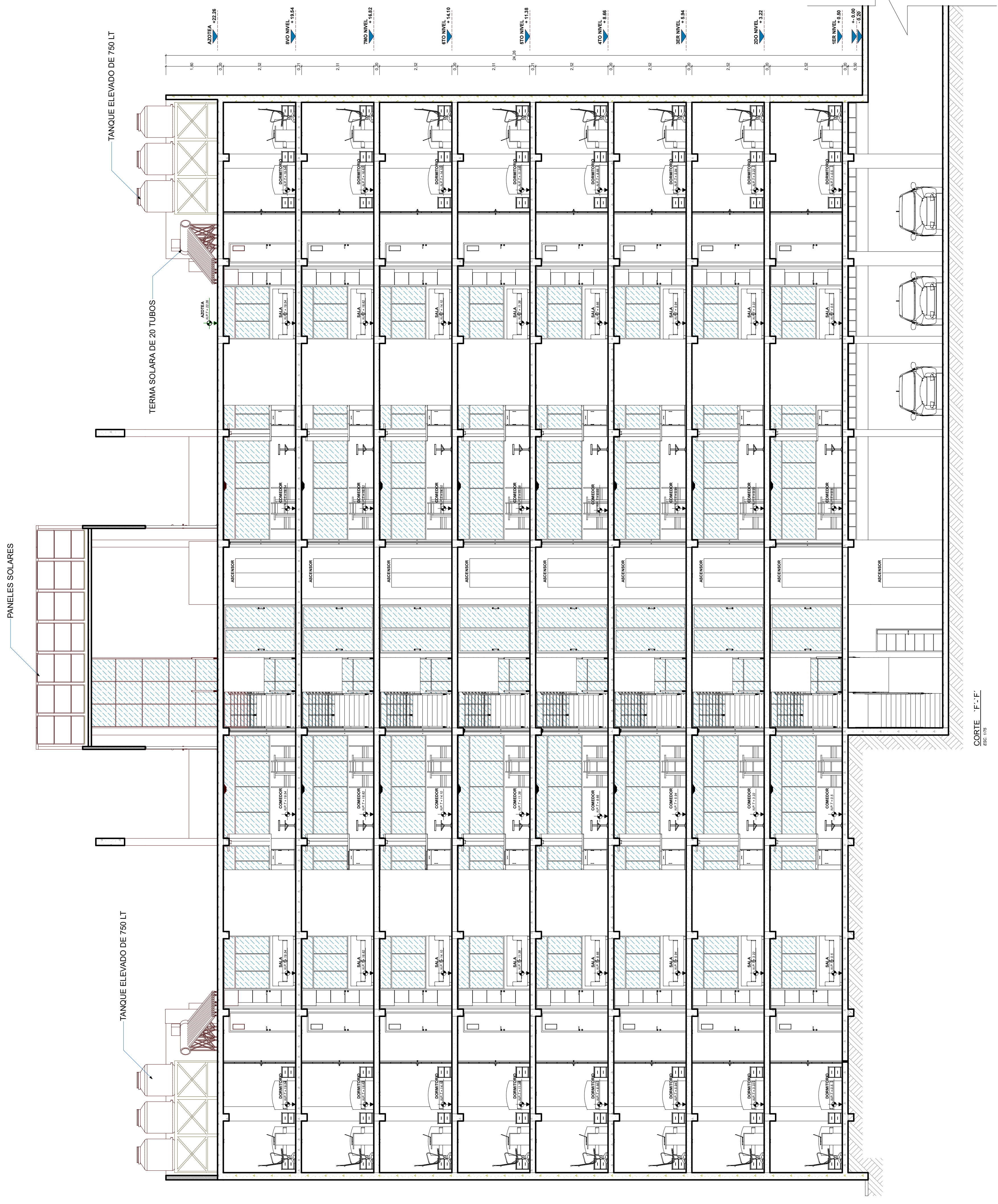
CORTE 'F'-F' 85% / 100%