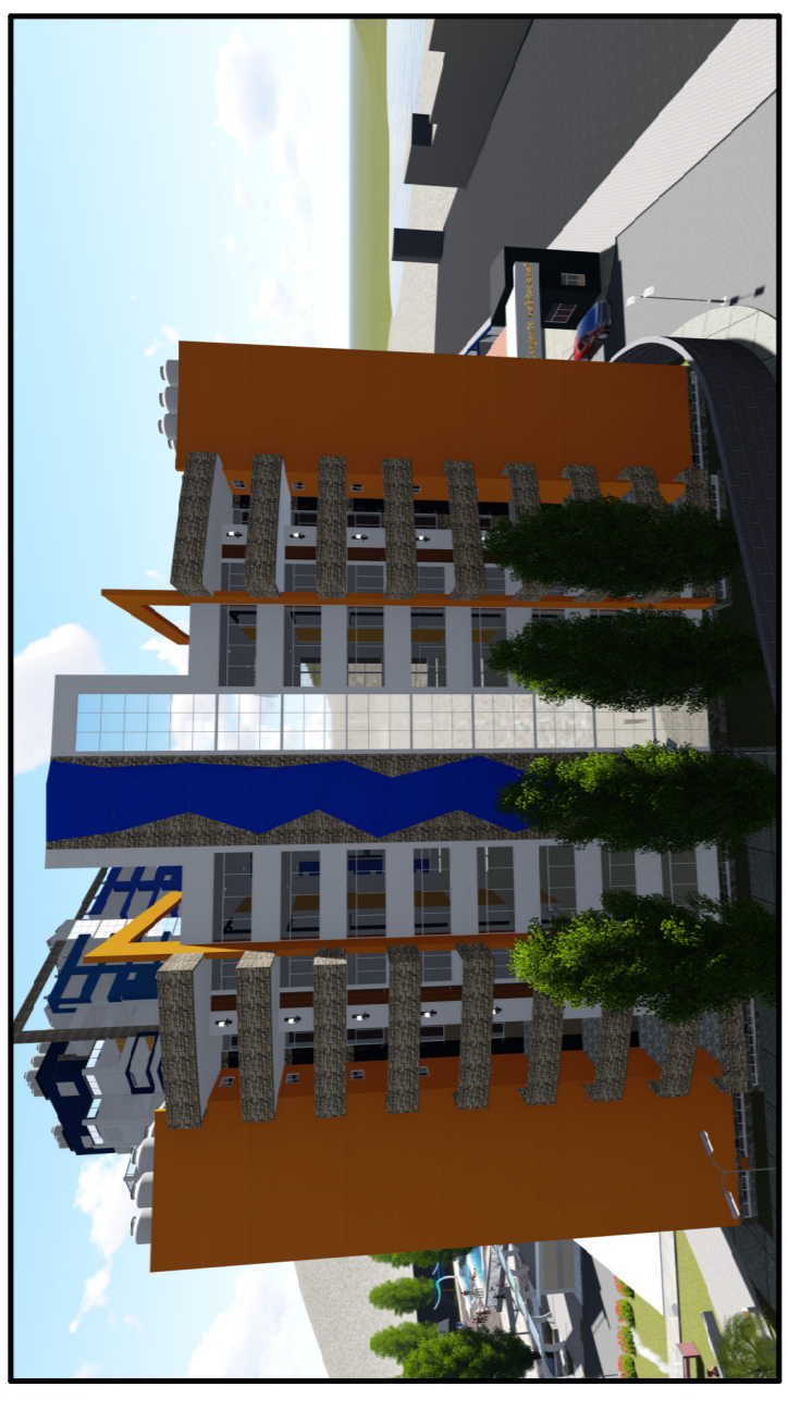
MODELADO 3D, FACHADA POSTERIOR