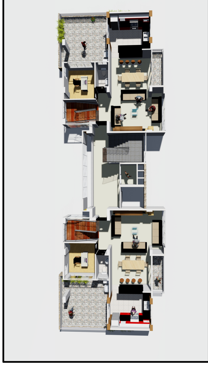
DETALLE 3D DE MODULO DE VIVIENDA TIPO DUPLEX 1ER NIVEL